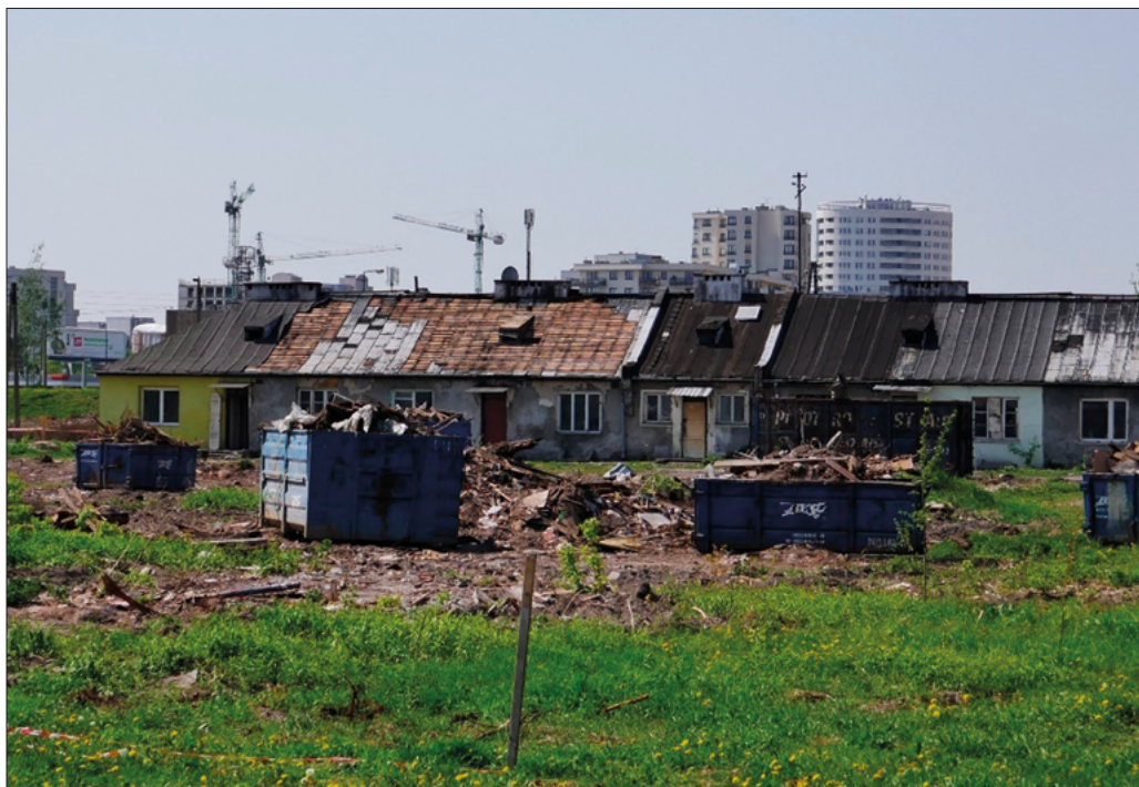
FOT. 2 Czworak pracowników PGR-u

Pracowników PGR-u zakwaterowano w specjalnie dla nich wybudowanych czworakach. Zostały zburzone dopiero w 2018 r. Prawdopodobnie stałyby tam do dziś, gdyby nie budowa Południowej Obwodnicy Warszawy. Jej trasa będzie przebiegać przez środek dawnych zabudowań PGR-u.