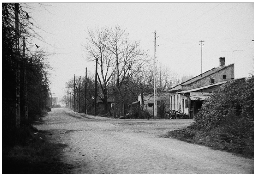
FOT. 3 Pętla autobusu linii 104

Autobus 104 był przez dziesięciolecie jedynym łącznikiem Wolicy z miastem. Do lat 80. XX w., kiedy powstały pierwsze bloki osiedla Natolin, na „głębokie południe” Warszawy można było dojechać wyłącznie linią 104. Pętla autobusowa o nazwie „Wolica” mieściła się przy ul. Nowoursynowskiej, która jeszcze pod koniec ubiegłego wieku była pokryta kocimi łbami. Tuż obok pętli znajdowała się kuźnia, w której pracował kowal. Jeszcze do niedawna podkuwano tam konie ciągnące wolickie furmanki. Budynek przetrwał. Obecnie mieści się w nim zakład mechanika samochodowego.