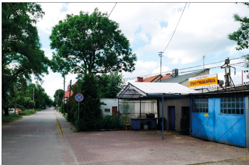
FOT. 4 Dawna kuźnia, obecnie warsztat mechanika

Uwaga: W miejscu znaku drogowego był kiedyś przystanek linii 104.