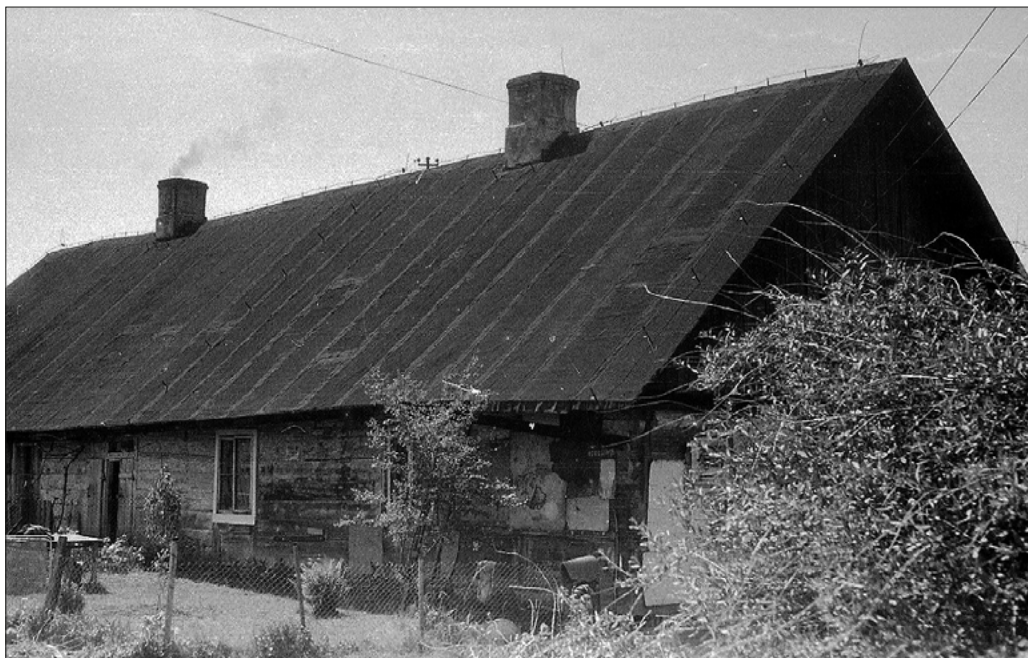
FOT. 1 Chata turecka w latach 90. XX w.

Na południowym krańcu Wolicy znajdował się folwark. Jak wspominałam, jeszcze przed II wojną światową jego właścicielami byli Branicczy. Jednym z bardziej charakterystycznych budynków pamiętających te czasy był olbrzymi czworak, największy w całej wsi. Jeszcze na początku XXI w. mieszkali w nim potomkowie służby Branickich 18 . Budynek nazywano chatą turecką. Legenda głosi, że chata ta pochodzi z XVII w. Jej pierwszymi mieszkańcami mieli być janczarzy sprowadzeni tu przez króla Jana III Sobieskiego 19 . W materiałach źródłowych próżno by szukać potwierdzenia tej tezy. Pewne jest to, że chata była jedną z najstarszych na terenie dzisiejszego Ursynowa. Spłonęła w 2011 r. Po drugiej wojnie światowej na bazie folwarku powstał PGR Wolica. W 1956 r. właścicielem gruntów została SGGW, która urządziła swoje pole doświadczalne. Tak wspomina je Pani Beata: