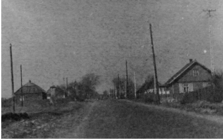
Ryc. 6. Stąporków, fot. Z. Mączyński, 1969 r., zbiory prywatne

Zakłady w Stąporkowie utrzymywały od pokoleń wiele rodzin z obszaru ziemi koneckiej. Tradycje zawodowe były podtrzymywane przez kolejne pokolenia. W 1967 r. Stąporków uzyskał prawa miejskie, a w jego herbie znajdują się elementy nawiązujące do tradycji przemysłowych. Rolniczy charakter osady w kolejnych dekadach ulegał stopniowemu zatarciu.