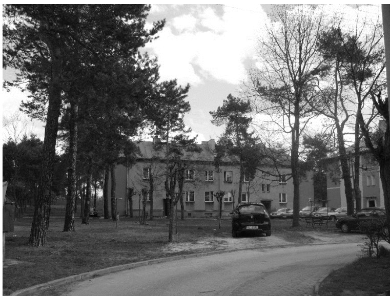
Ryc. 3. Osiedle Plac Wolności, 2014 r.