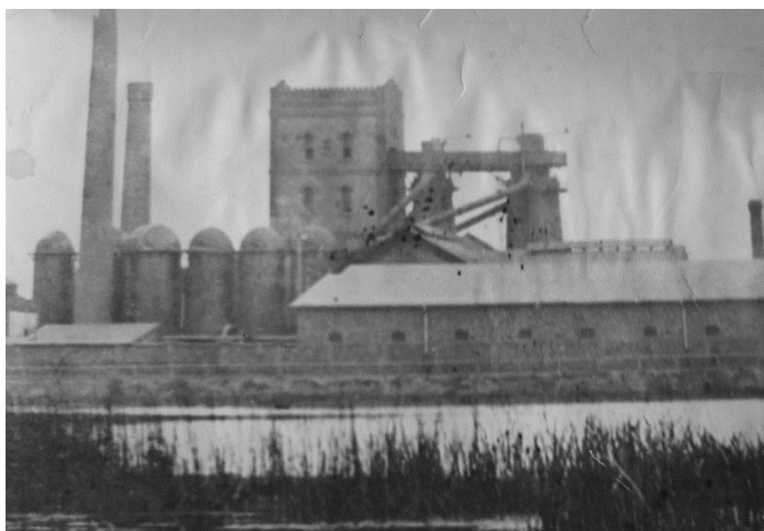
Ryc. 2. Miejsko-Gminny Ośrodek Kultury i Sportu, zbiory Biblioteki w Stąporkowie, Huta Stąporków , fot. ok. 1929 r.