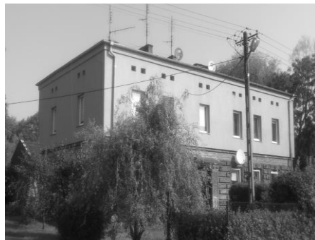
Ryc. 3. Obecny stan budynku dawnej szkoły w Markówce (wrzesień 2016)

Inną grupę obejmują obiekty położone w koloniach niemieckich założonych w okresie istnienia Prus Południowych. Pierwotnie szkoły znajdowały się w obrębie niwy siedliskowej, zawsze przy głównej osi komunikacyjnej wsi. Jednym