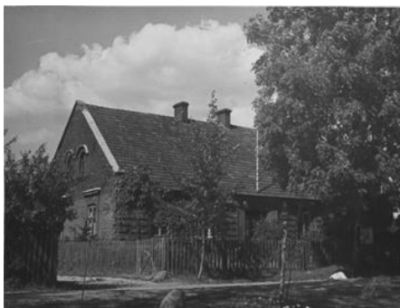
Ryc. 2. Murowany budynek szkoły w Markówce w okresie międzywojennym

Kolejnym, charakterystycznym miejscem lokalizacji szkoły, zwykle w dawnych osadach olęderskich, było sąsiedztwo cmentarza ewangelickiego. Obiekty oświatowe znajdowały się często na skraju zabudowy wsi, przy głównym ciągu komunikacyjnym. Można przypuszczać, że dobór właściwej lokalizacji szkoły stanowił odzwierciedlenie lokalnych uwarunkowań przyrodniczych i antropogenicznych 67 . W Słowiku szkoła znajdowała się w pobliżu cmentarza, przy obecnej drodze krajowej nr 91, w rejonie dzisiejszych torów tramwajowych 68 . Za niwą siedliskową, na południowym skraju osady, ulokowano kantorat i pierwszy dom modlitwy z Pustkowej Górze. Obecnie obiekt popada w ruinę 69 . Podobną lokalizacją cechował się obiekt w Rudzie-Bugaj 70 . Stwierdzić można, że w olęderskiej osadzie Janów budynek szkolny zlokalizowany był pierwotnie w miejscu sąsiadującym z powstałymi później torami kolejowymi, na wysokości ul. Augustów, zaraz za obecną stacją Łódź Widzew 71 .