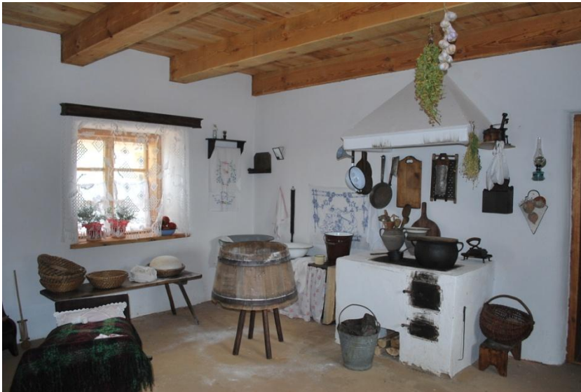
Dom mieszkalny w Łęczyckiej Zagrodzie chłopskiej – kuchnia.