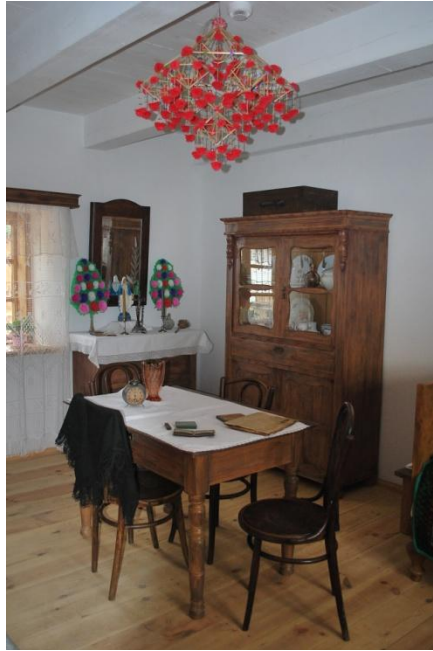
Dom mieszkalny w Łęczyckiej Zagrodzie chłopskiej – pokój.