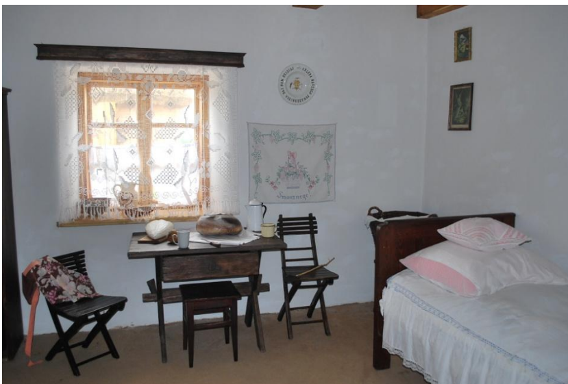
Dom mieszkalny w Łęczyckiej Zagrodzie chłopskiej – kuchnia.