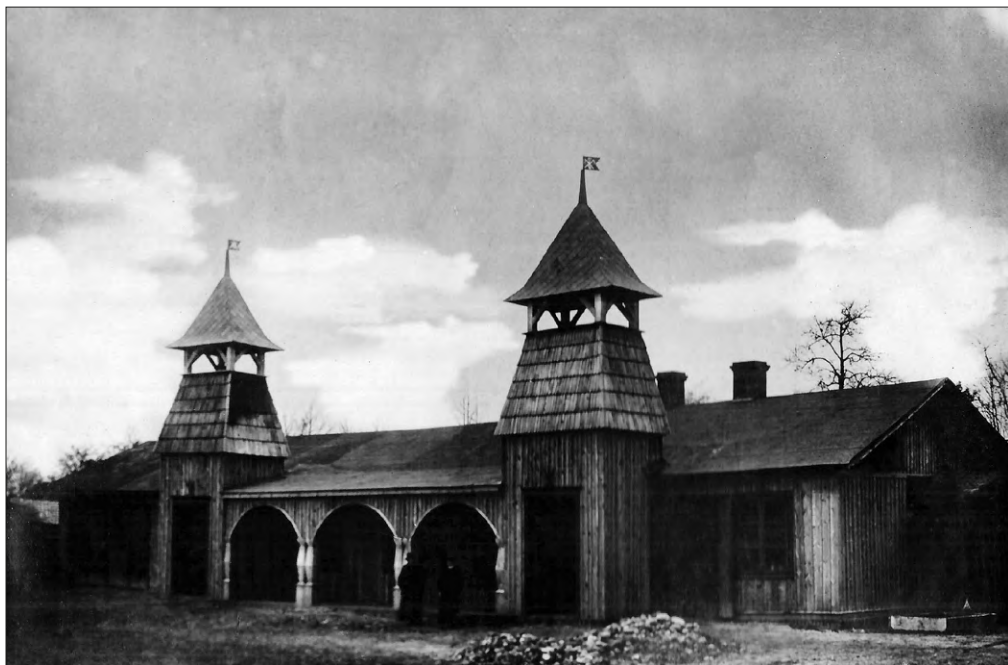
FOT. 3 Dom ludowy w Rzęśni.

uzyskał kredyt, dzięki czemu zakupił deski do wykonania obić ścian, drzwi, okien, podłóg i podbitkę, a ich transport zapewnili miejscowi gospodarze. Część cegieł do wykonania wewnętrznych ścian pochodziła z rozbiórki filarów parkanu okalającego ogród parafialny. Wiosną proboszczowi udało się uzyskać kolejne dofinansowania z sejmiku powiatowego (500 zł), Ministerstwa Pracy i Opieki Społecznej (300 zł) i dyrekcji Wzajemnych Ubezpieczeń od Ognia (400 zł). Ponadto na kontynuowanie prac przeznaczono dochód z wiejskiej zabawy zorganizowanej przez strażaków, a proboszcz nadal prowadził kwesty. Dzięki tym środkom w lipcu wznowiono prace. Łącznie koszt nowo wzniesionego budynku wyniósł 13 802 zł. Część środków spłacano z dochodów uzyskiwanych przy okazji działalności domu ludowego w kolejnych miesiącach. W 1927 r. zadłużenie wynosiło ponad 4 tys. zł, jednak ks. Kokowski przy pomocy parafian spłacił wszystkie należności. Wnętrze budynku zostało udekorowane płótnami, które na prośbę proboszcza ofiarowały i pozyszywały miejscowe gospodynie 20 .