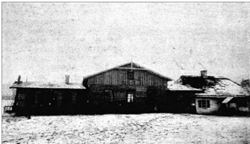
FOT. 2 Dom ludowy w Ręczni. Źródło: „Zorza” 1909, nr 2, s. 3

Ks. W. Kokowski był przekonany, że rozwijanie działalności społecznej wymagało zapewnienia odpowiedniego lokalu umożliwiającego funkcjonowanie instytucji i odbywanie spotkań. W związku z tym podejmował starania zmierzające do budowy domów ludowych. Postulował, żeby „pokryć całą Polskę siecią domów ludowych” 16 . Te ambitne przedsięwzięcia udało mu się zrealizować w Ręcznie, Sroczku i Rzęśni. Przed jego przybyciem do Ręczna w tej miejscowości nie było żadnego lokalu, w którym mogłyby się odbywać spotkania osób zrzeszonych w organizacjach społecznych. W związku z tym proboszcz wyszedł z inicjatywą wzniesienia odpowiedniego budynku i podjął starania w kierunku zrealizowania wysuniętego postulatu. Ich zwieńczeniem było pobłogosławienie domu ludowego w Ręcznie w dniu 29 XI 1908 r. Wówczas ks. W. Kokowski w wygłoszonym przemówieniu zaznaczył, że stanowi on własność wszystkich parafian. Mieściła się w nim sala o długości 20 łokci i szerokości 16 łokci, w której odbywały się pogadanki kółka rolniczego, odczyty, amatorskie przedstawienia teatralne i zabawy dla mieszkańców. W lewej części budynku zlokalizowano pomieszczenie dla potrzeb spółki handlowej, a w prawej – czytelnię i bibliotekę kółka rolniczego. Inauguracja działalności stała się okazją do przeprowadzenia dyskusji o potrzebie organizowania kółek rolniczych i wygłoszenia odczytu o chwastach