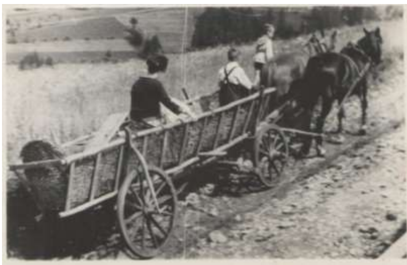
Jeszcze do lat 60. XX w. do wsi prowadziła jedna kamienista droga.