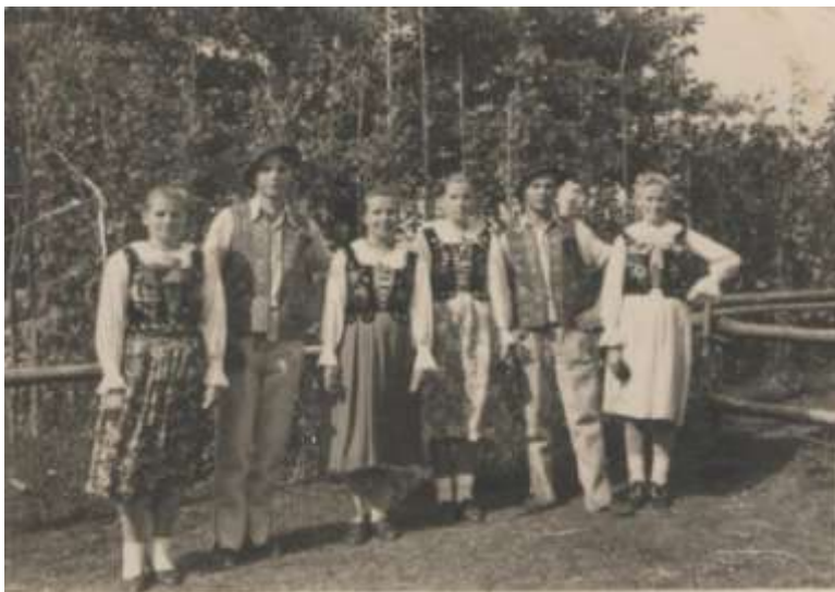
Mieszkańcy Hałuszowej w strojach regionalnych – przełom lat 40./50. XX w.