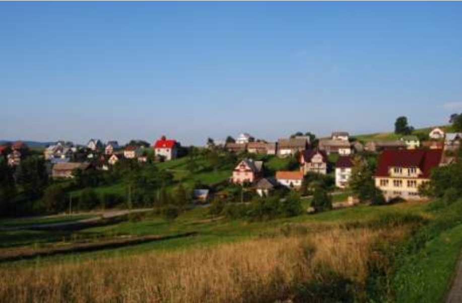
Hałuszowa widoczna od południa – czasy obecne.