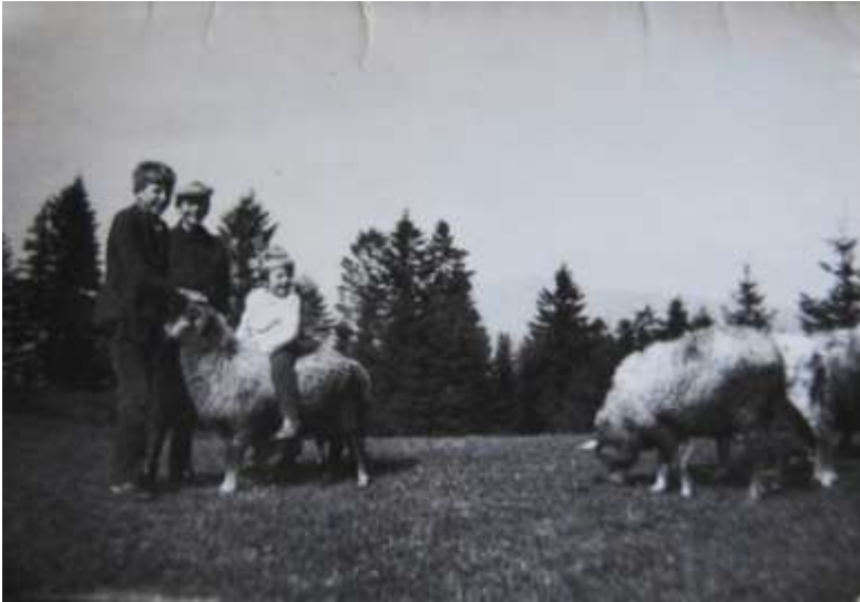
Na Majerzu – połowa lat 60. XX w.