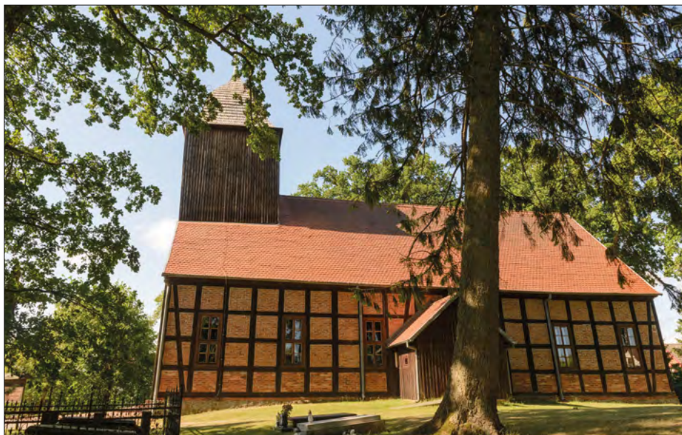
FOT. 4. Kościół w Ugoszczy.