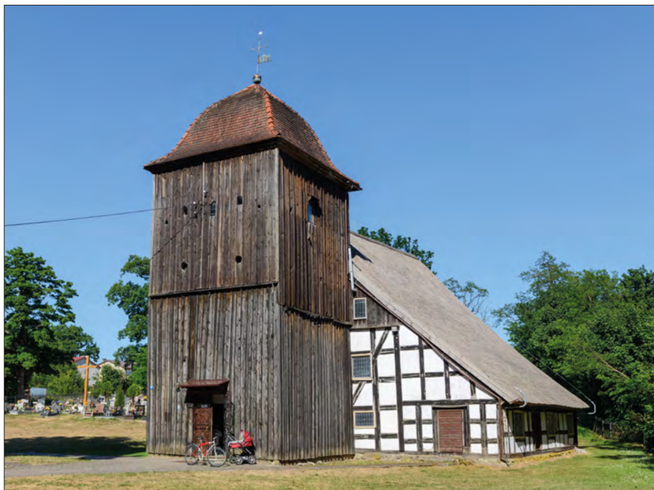
FOT. 1. Kościół w Jasieniu.

Trzy drewniane świątynie ziemi bytowskiej zachowane do dzisiaj wraz z ich bogatym wyposażeniem stanowią pomnik sakralnego budownictwa drewnianego w jego dwóch odmiennych formach: zrębowej, uważanej za tradycyjną i pierwotną, oraz szkieletowej, kojarzonej nie zawsze właściwie z żywiołem niemieckim, zwanej „pruską”. Poza tym kościoły w Sominach, Jasieniu i Ugoszczy stanowią dziedzictwo kulturowe wielowyznaniowej historii ziemi bytowskiej. Współcześnie odbywają się w nich nabożeństwa katolickie, ale przechowują elementy wyposażenia i dekoracji artystycznej oraz rozwiązań architektury typowe dla praktyk protestanckich. Charakter zarówno architektury, jak i dekoracji nosi cechy sztuki i wrażliwości ludowej.