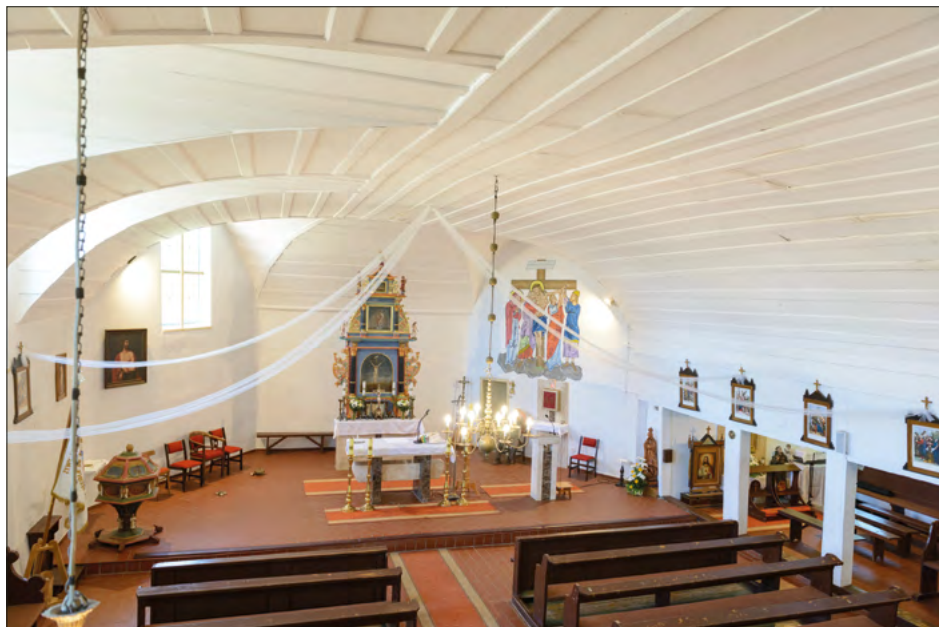
FOT. 2. Wnętrze kościoła w Jasieniu.