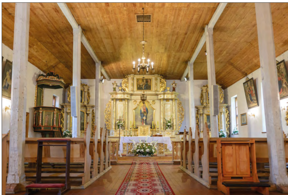
FOT. 5. Wnętrze kościoła w Ugoszczy.