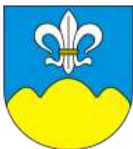
Ilustracja nr 48 Herb gminy Łęki Szlacheckie