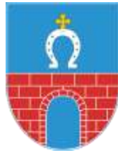
Ilustracja nr 22 Herb gminy Rusiec