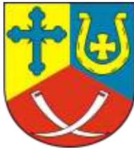
Ilustracja nr 27 Herb gminy Lubochnia