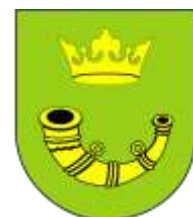
Ilustracja nr 20 Herb gminy Pabianice