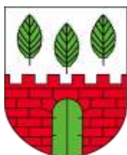
Ilustracja nr 7 Herb gminy Grabów