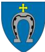
Ilustracja nr 12 Herb gminy Wielgomłyny