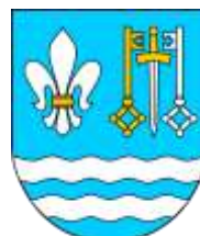
Ilustracja nr 44 Herb gminy Aleksandrów