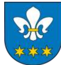
Ilustracja nr 32 Herb gminy Domaniewice