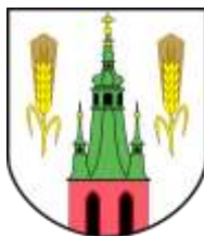
Ilustracja nr 55 Herb gminy Brójce