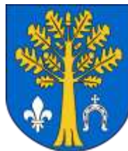
Ilustracja nr 31 Herb gminy Kluki