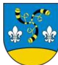
Ilustracja nr 17 Herb gminy Nieborów