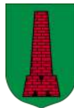
Ilustracja nr 56 Herb gminy Mokroś