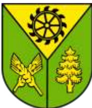
Ilustracja nr 57 Herb gminy Kleszczów