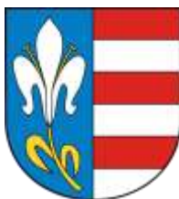
Ilustracja nr 52 Herb gminy Sławno