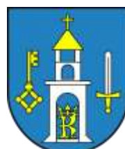
Ilustracja nr 38 Herb gminy Szczerców