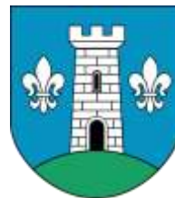
Ilustracja nr 11 Herb gminy Głowno