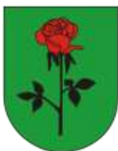
Ilustracja nr 60 Herb gminy Ksawerów