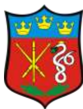
Ilustracja nr 19 Herb gminy Dłutów