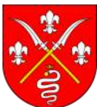
Ilustracja nr 18 Herb gminy Sędziejowice