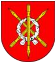
Ilustracja nr 21 Herb gminy Moszczenica