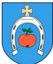
Ilustracja nr 61 Herb gminy Sadkowice