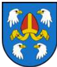
Ilustracja nr 46 Herb gminy Ręczno