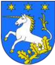
Ilustracja nr 24 Herb gminy Zgierz