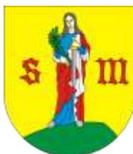
Ilustracja nr 34 Herb gminy Góra Świętej Małgorzaty