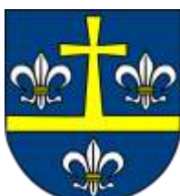
Ilustracja nr 36 Herb gminy Piątek