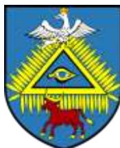
Ilustracja nr 13 Herb gminy Sokolniki