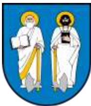
Ilustracja nr 45 Herb gminy Rzaśnia