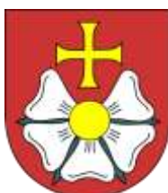
Ilustracja nr 37 Herb gminy Burzenin