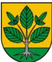
Ilustracja nr 33 Herb gminy Grabica