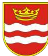
Ilustracja nr 6 Herb gminy Drzewica