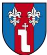
Ilustracja nr 15 Herb gminy Goszczanów