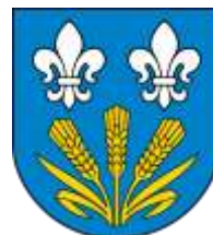
Ilustracja nr 14 Herb gminy Chańsko