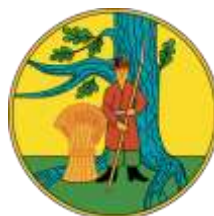
Ilustracja nr 3 Logo gminy Sędziejowice