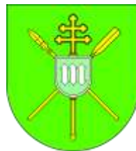
Ilustracja nr 47 Herb gminy Maków