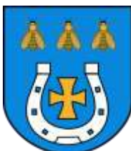
Ilustracja nr 42 Herb gminy Zduńska Wola