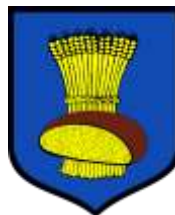
Ilustracja nr 59 Herb gminy Zadzim