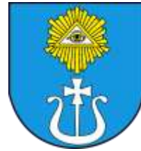
Ilustracja nr 23 Herb gminy Wola Krzysztoporska