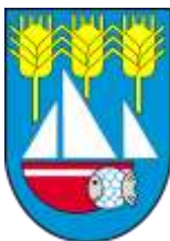
Ilustracja nr 54 Herb gminy Pęczniew