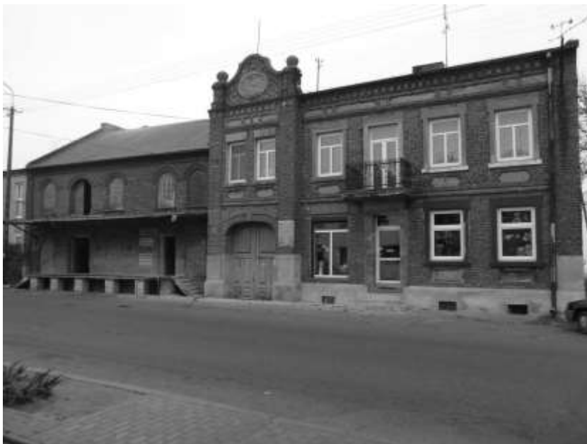
Ryc. 3. Młyn w 2013 r.