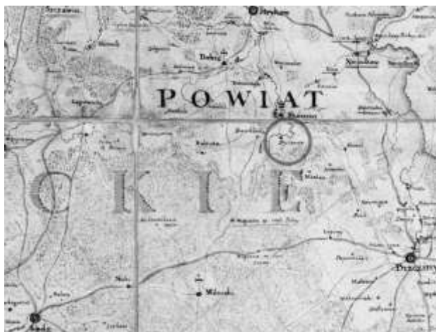
Ryc. 1. Byszewy na mapie Karola Perthées'a z 1793 r.

Wiek XIX to czasy powolnego, ale stałego rozwoju osadnictwa przemysłowego. Według stanu z 1937 r. w dolinie Moszczenicy znajdowało się 5 młynów wodnych, w tym w Byszewach. Pozostałością po nich są stawy pomłyńskie. Jednym z nich jest Poperka w Boginii, w połowie drogi pomiędzy Byszewami i Skoszewami – jak zapisał Jarosław Iwaszkiewicz w swoich Podróżach po Polsce . Jak czytamy na tablicy, umieszczonej na byszewskim „dworze z czterema kolumnami” (ryc. 4), przebywał w nim w latach 1911–1931 61 .