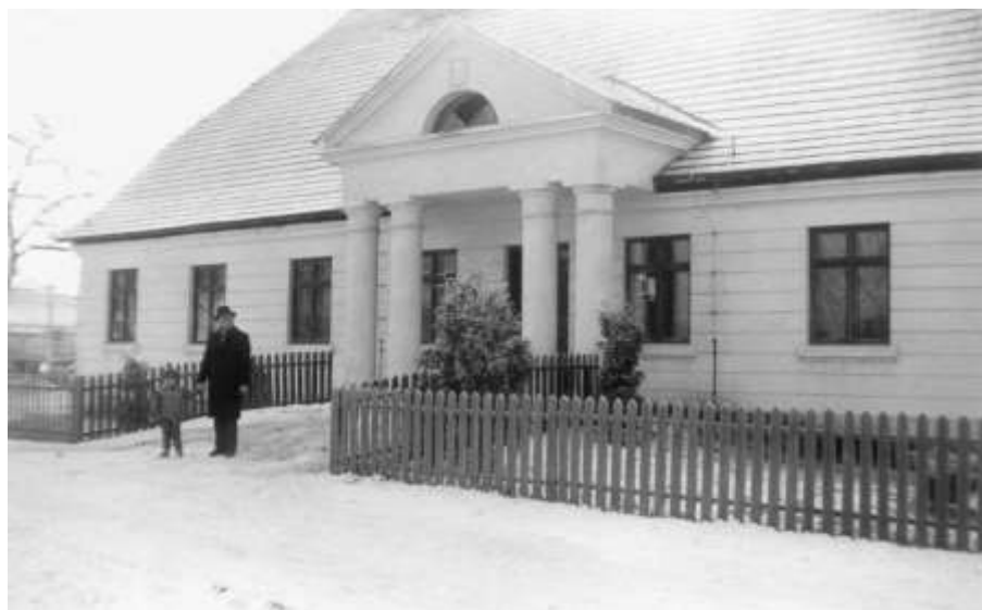
Ryc. 4. Dwór w Byszewach