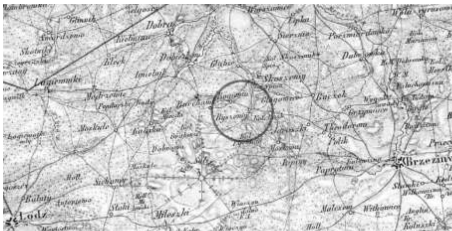
Ryc. 3. Byszew na mapie Reymann's'a (pierwsza połowa XIX w.)