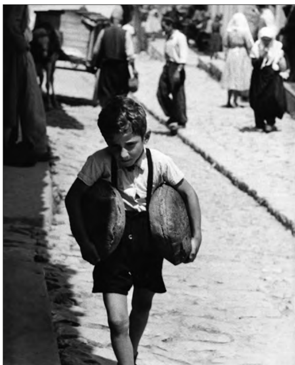
FOT. 6 Z cyklu Maty człowiek , Albania 1961, zr_A_05_0009