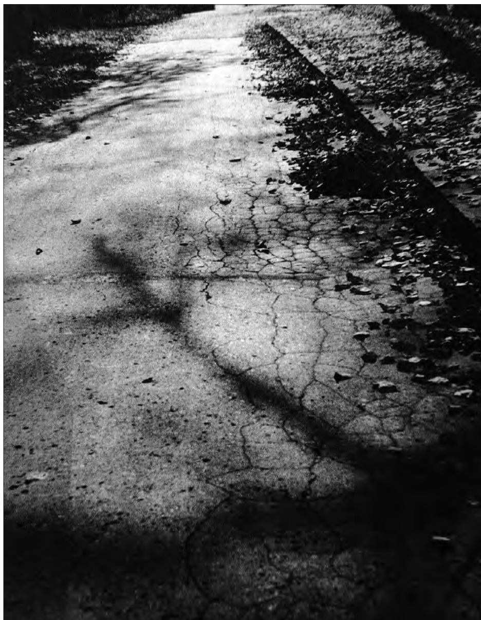
FOT. 9 Z cyklu Nieskończoność dalekich dróg , Gliwice 1980, zr_E_01_0015