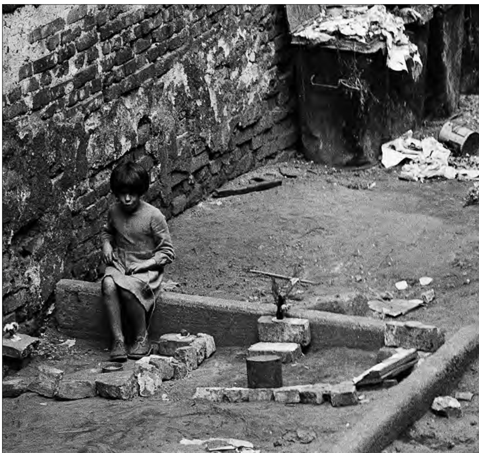
FOT. 4 Z cyklu Mały człowiek , Bytom 1961, zr_A_05_0010

Wypowiedzi J. Buszy i A. Soboty wskazują na spłot konstrukcyjno-tematyczny obecny w twórczości Z. Rydet. Łączy je podobnie akcentowane przez obu krytyków współwystępowanie dwóch odmiennych tendencji estetycznych w procesie kształtowania się głównych nurtów polskiej fotografii zapoczątkowanych w latach 50. XX w., aktualizowanych także w dzisiejszych poszukiwaniach artystycznych początków XXI w. Uwagi J. Buszy i A. Soboty wskazują, że w konfrontacji z tymi dwoma sposobami artystycznej obserwacji świata własnych wyborów fotograficznych dokonuje wówczas polska artystka.