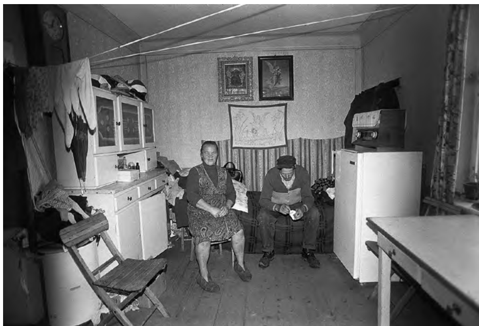
FOT. 12 Zapis socjologiczny , Kozłów, Śląsk 1983–1990, zr_04_064_09