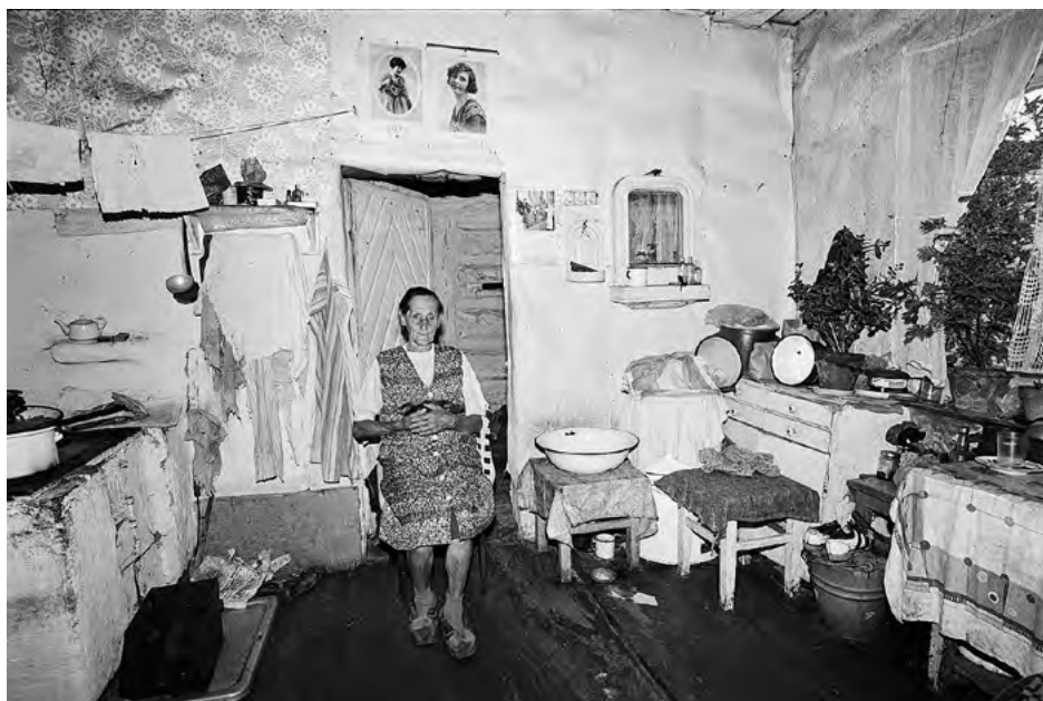
FOT. 13 Zapis socjologiczny , zr_03_063_08 Raba Wyżna, Podhale 1978–1990, zr_03_063_08