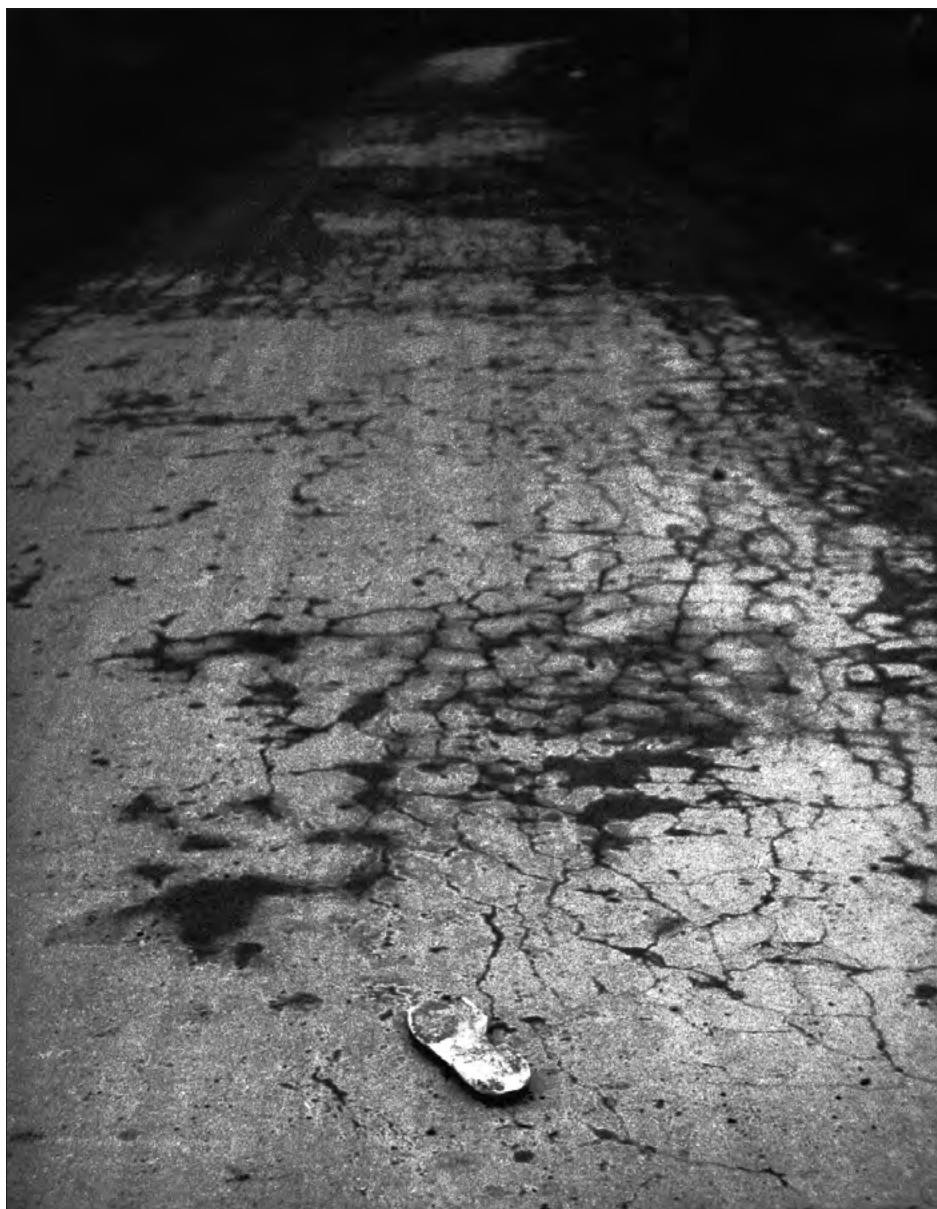
FOT. 10 Z cyklu Nieskończoność dalekich dróg , Gliwice 1980, zr_E_01_0022