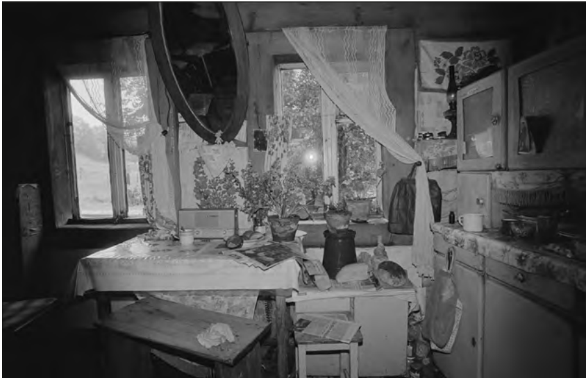
FOT. 1 Biały Dunajec, Podhale 1984, zr_01_007_13