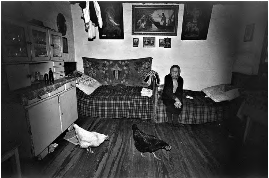
FOT. 15 Zapis socjologiczny , Lanckorona 1981, Małopolska, zr_08_002_22