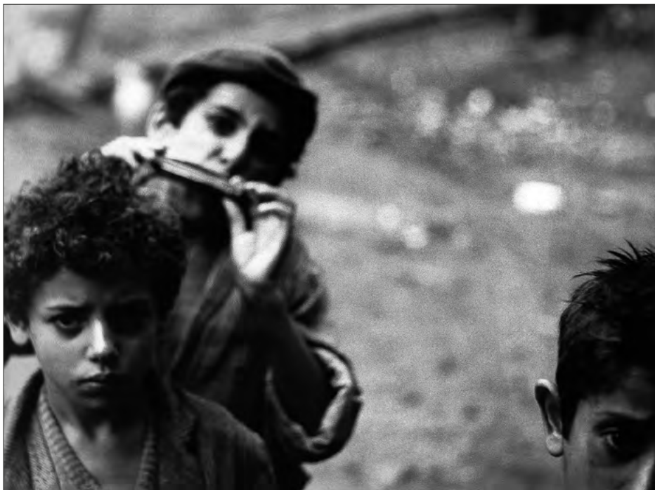
FOT. 3 Z cyklu Mały człowiek , Szczawnica 1961, zr_A_05_0006