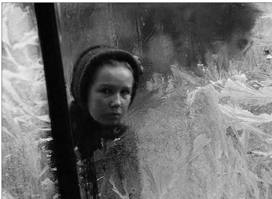
FOT. 5 Z cyklu Maty człowiek , Bytom 1961, zr_A_05_0019