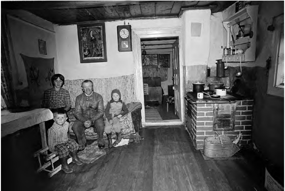
FOT. 14 Zapis socjologiczny , Skawa, Podhale 1978, zr_03_010_18