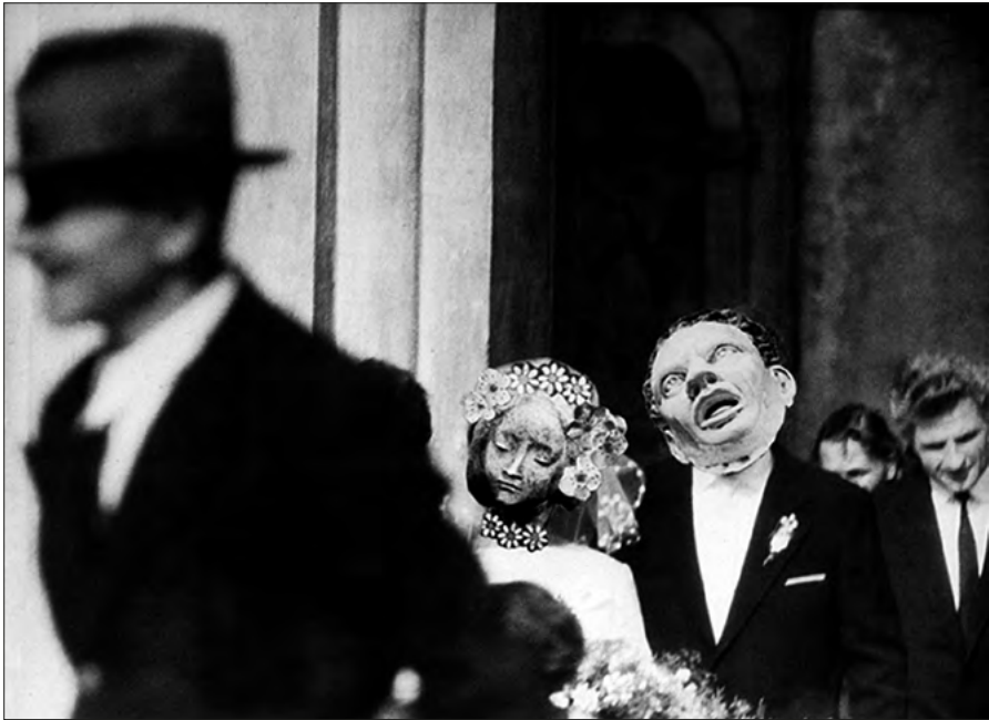
FOT. 7 Z cyklu Świat uczuć i wyobraźni , Sentymentalna ballada 1975–79, zr_D_08_0003