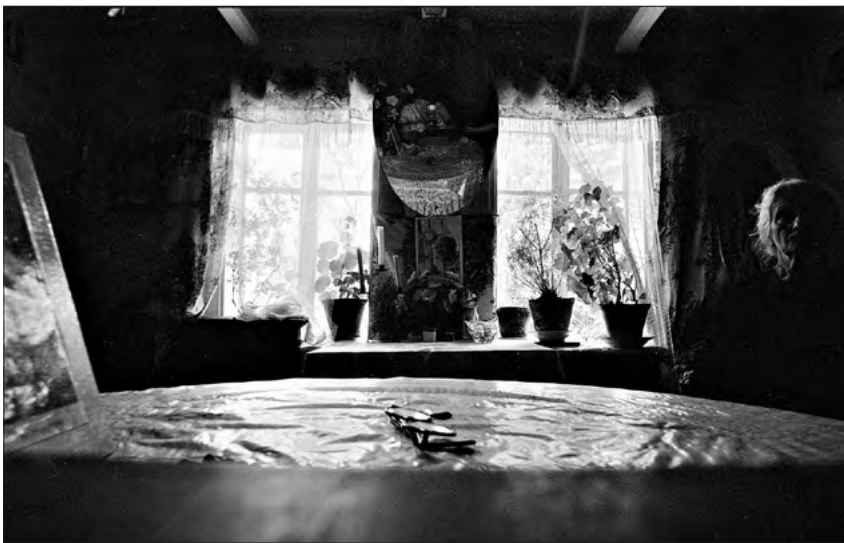
FOT. 2 Naprawa, Podhale 1988, zr_03_087_27

elementem kompozycji, a w rozumieniu Ingolda elementem „przepływów” i „przekształceń”, świadczy o obecności sił wzajemnie oddziałujących na siebie. W obu przypadkach mowa zatem o jednoczącej te elementy kompozycji. Wypowiedź V. Nabokova wskazuje, że w nakierowaniu uwagi na szczegół chodzi nie tylko o aspekt opracowania całości artystycznej, ale także o uznanie