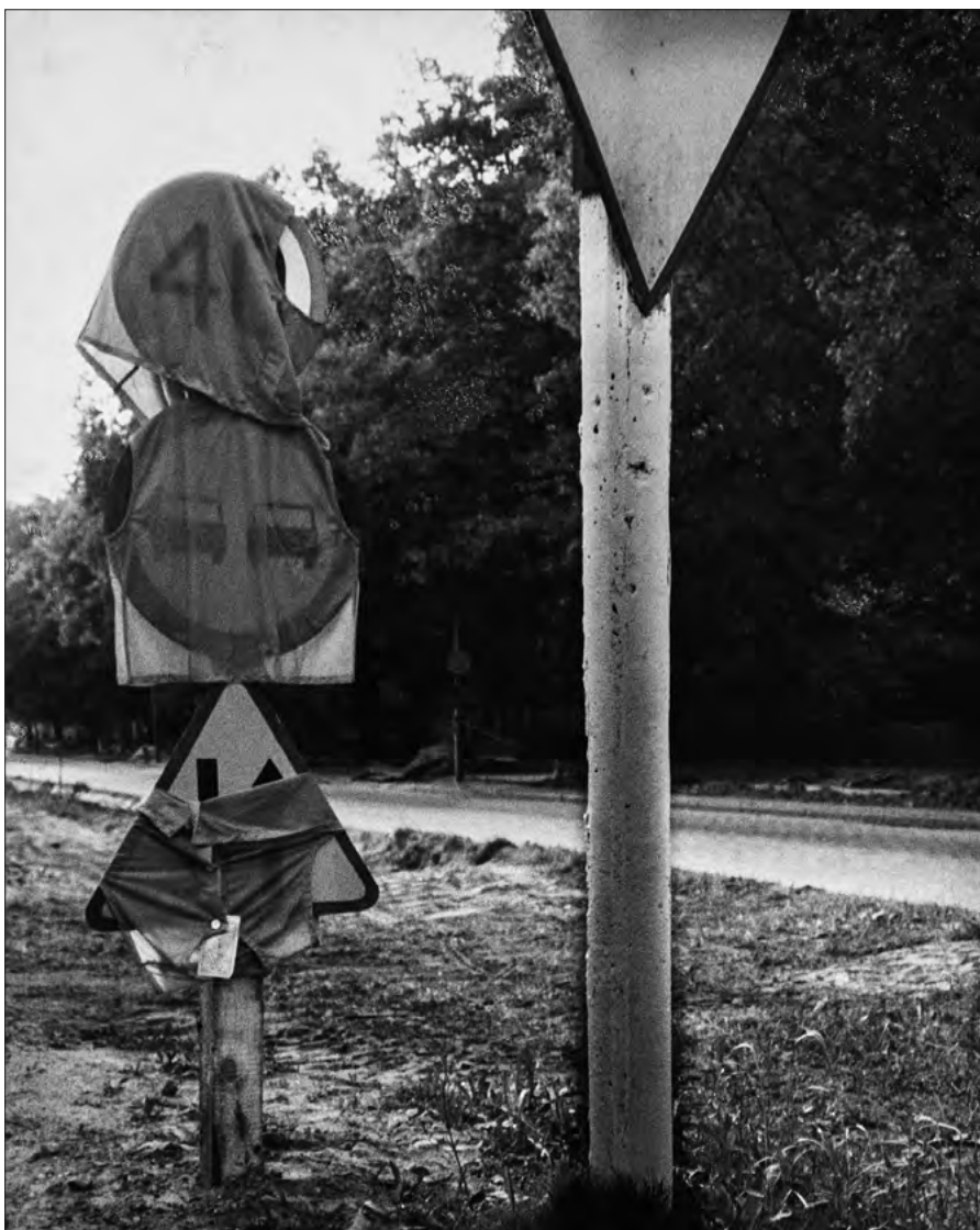
FOT. 11 Z cyklu Nieskończoność dalekich dróg , Gliwice 1980, zr_E_03_0008

Wartość ta zostaje wyrażona jeszcze tymczasowo w kategoriach dwóch dziedzin, z jednej strony krytyki sztuki, a z drugiej nauk społecznych jako wyzwanie przyszłego odbioru i oceny.