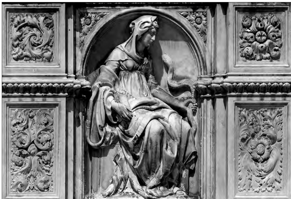
IL. 1 Fontana della Gioia in Piazza del Campo a Siena

Keywords: Gaia myth, paganism, Christianity, secularization, Prometheism, culturology, diachrony