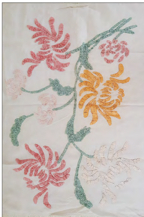
FOT. 6 Hafty Zofii Danielak, haft płaski i aplikacja w formie kwiatów. Ze zbiorów autorki. Fot. M. Kowalik