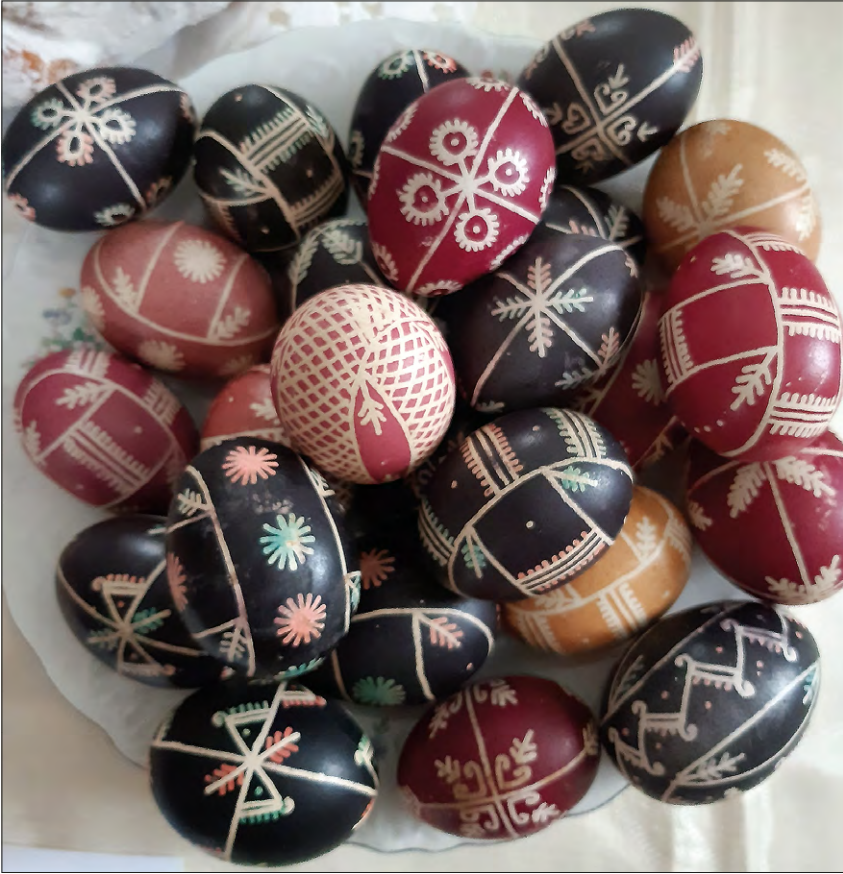
FOT. 5 Pisanki ze zbiorów Zofii Danielak.

zdjęcia pozwalają na rzeczowy opis twórczości danego artysty z uwzględnieniem cech szczególnych, określeniem stylu 32 . W przypadku dzieł kultury niematerialnej, jak śpiew czy taniec, istotne są: zapisy słów, opisy występów, zdjęcia lub materiał filmowy. W przypadku Zofii Danielak nie posiadamy takich zbiorów, a jedynie niewiele informacji. Ulotny charakter występów z okresu jej aktywności scenicznej w połączeniu z brakiem dokumentacji (np. audiowizualnej) powoduje utratę wielu ważnych dla badacza informacji. Z tej przyczyny w niniejszym tekście postaram się skupić głównie na sztuce plastycznej Zofii Danielak. Najwięcej informacji zachowało się o jej twórczości rękodzielniczej, którą należy podzielić na kilka dziedzin, tak aby jak najpełniej opisać ich cechy.