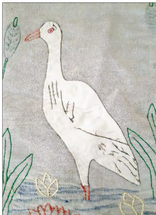
FOT. 7 Hafty Zofii Danielak, haft płaski i aplikacja w formie bociana. Ze zbiorów autorki.