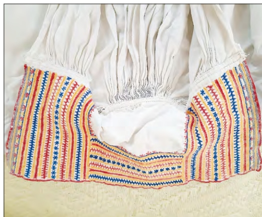
FOT. 9 Koszula haftowana ściegami liczonymi, wykonana z białego płótna. Ze zbiorów autorki. Fot. M. Kowalik