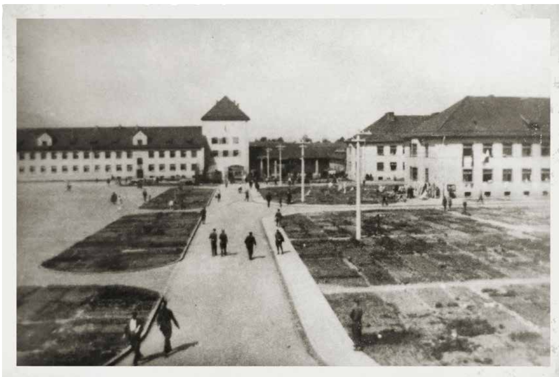
Oflag VII A Murnau – plac obozowy, na wprost budynek komendatury niemieckiej, po prawej bloki A i B (D. Kisielewicz, 2015)