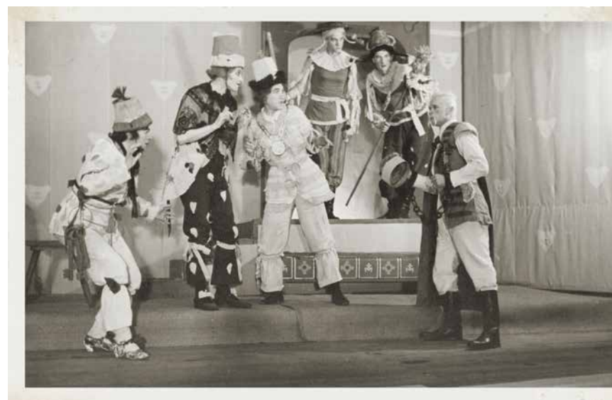
Akt III, scena XIV – Przewraca się świat na opak, kobiety w szatach męskich, przestraszone na wieść o wojnie i konieczności walki zbrojnej, do której się nie nadają. Od lewej: Agata bakałarz – ppor. Fijałkowski, Barbara pisarz – por. A. Rudolphi, Urszula burmistrz Osieku (z łańcuchem na szyi) – ppor. W. Padé, z prawej Bekiesz przyjaciel Jana Kantego Doręby – ppor. Moncewicz, w głębi Makary szeregowiec – mjr Kędzierski i Sowizdrzał – ppor. Z. Bessert