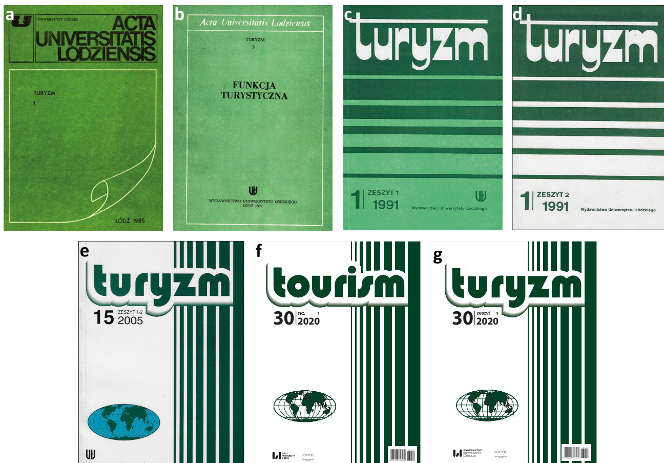
Rysunek 1. Okładki czasopisma „Turyzm/Tourism” od 1985 do 2020 r.

wersją pierwotną. Ogółem w latach 2009–2020 w 12 tomach ukazało się 170 artykułów, 11 notatek naukowych, 9 sprawozdań i 16 recenzji.