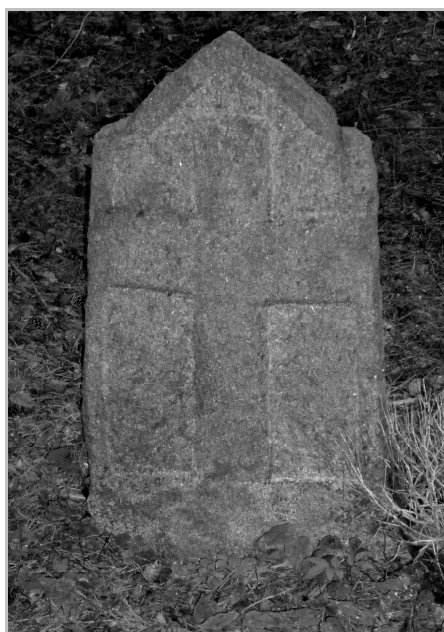
Fot. 1. Kamienny nagrobek bez napisów na nieużytkowanym cmentarzu luterzańskim we wsi Kocioł Duży (nadleśnictwo Pisz), fot. S. Sobotka 2014

Źródło: opracowanie autorów; modyfikacja kryteriów oceny zawartych w: A. DŁUGOZIMA, I. DYMITYRSZYN, E. WINIARSKA (2012).