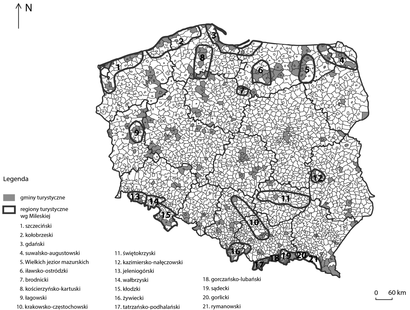
Rys. 1. Regiony wypoczynkowo-turystyczne wyróżnione przez M.I. MILESKĄ (1963) na tle gmin turystycznych (o liczbie miejsc noclegowych 500 i więcej)

Na rys. 1 przedstawiono również stan aktualności opracowania M.I. MILESKIEJ (1963), odnosząc go do współcześnie wyróżnionych gmin turystycznych (o liczbie miejsc noclegowych 500 i więcej). W trakcie 50 lat zaszły niewielkie zmiany na północy i południu kraju. Większość gmin wiąże się z regionami wyróżnionymi przez M.I. Mileską.