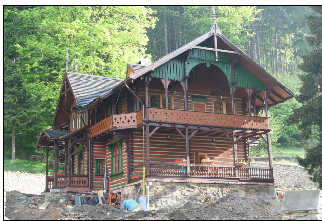
Fot. 10. Międzygórze – przykład zabudowy turystycznej z XIX w.