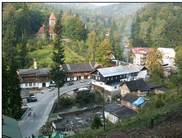
Fot. 9. Międzygórze – przykład harmonii w przestrzeni i krajobrazie

Jako przykład można podać krajobraz turystyczny stacji klimatycznej Międzygórze w Masywie Śnieżnika, w której z wyjątkiem jednego z obiektów