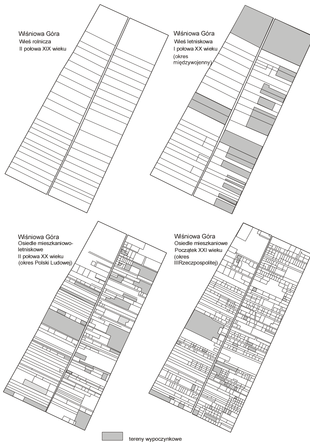
Rys. 1. Zmiany morfologii (układu przestrzennego) Wiśniowej Góry w latach 1870–2008 jako ilustracja procesu urbanizacji podmiejskiego osiedla letniskowego

okolicznej ludności pracującej w Łodzi (a niemogącej uzyskać w niej zameldowania) do osiedli podmiejskich, zwłaszcza tych, które dysponowały wolnymi zasobami mieszkaniowymi. A do takich osiedli podmiejskich należała m.in. Wiśniowa Góra. Opuszczone wille i pensjonaty częściowo przekształcono na mieszkania dla ludności stałej. Dlatego już w 1946 r. Wiś-