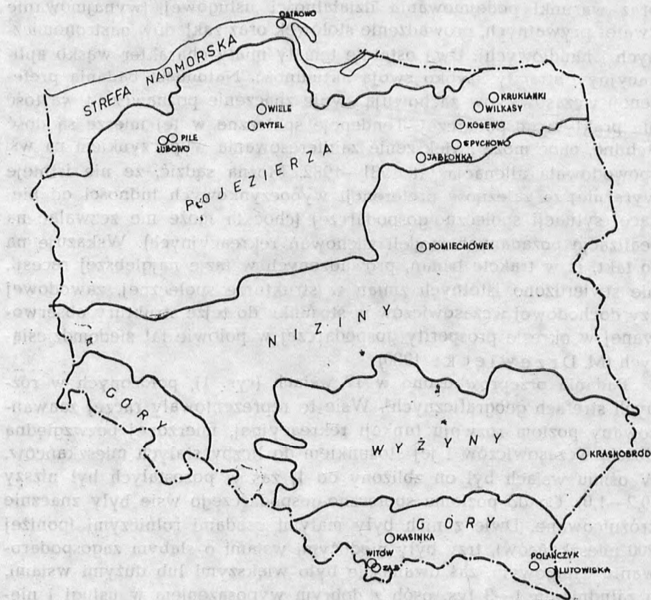
Rys. 1. Położenie badanych wsi letniskowych w strefach geograficznych

Fig. 1. La situation des villages estivaux examinés dans les zones géographiques