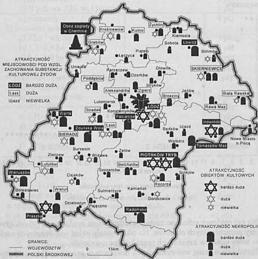
Rys. 4. Walory krajoznawcze miejscowości związane z kulturą żydowską na obszarze Polski Środkowej (opracowanie własne)

W podsumowaniu waloryzacji nekropolii należy wyraźnie podkreślić, że została ona przeprowadzona przez geografa wyłącznie pod kątem przydatności obiektów dla potencjalnego turysty. Pominięte zostały wszystkie niewymierne aspekty związane z uczuciowym podejściem do nekropolii.