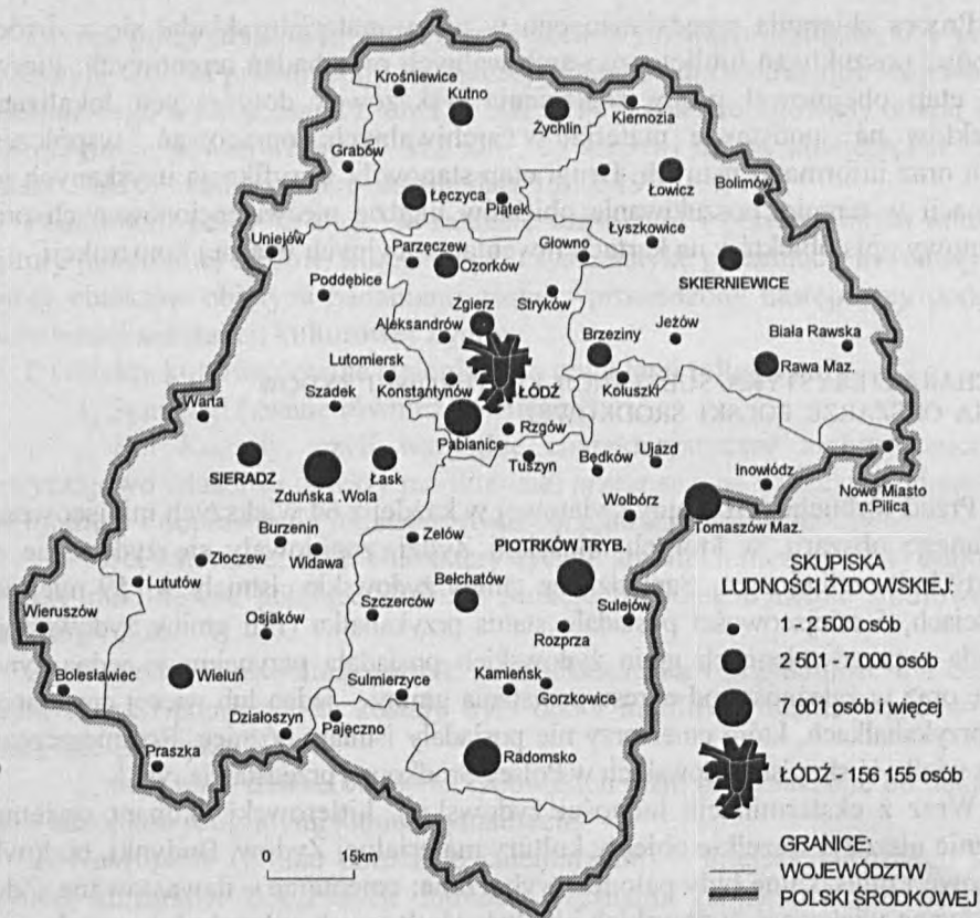
Rys. 1. Skupiska ludności żydowskiej na obszarze Polski Środkowej

Stan z 31 XII 1921 r. (opracowanie własne na podstawie spisu powszechnego z 1921 r.)