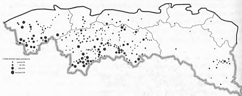
Rys. 2. Wsie posiadające kwatery turystyczne (zarejestrowane) w 1985 r. Liczba miejsc noclegowych: 1 – poniżej 30, 2 – 30–100, 3 – 100–300, 4 – powyżej 300 (W. K u r e k 1990)

Dessin 2. Les villages disposant de logements touristiques (enregistrés) en 1985. Le nombre des lieux de couchage: 1 – moins de 30, 2 – de 30 à 100, 3 – de 100 à 300, 4 – plus de 300 (W. K u r e k 1990)