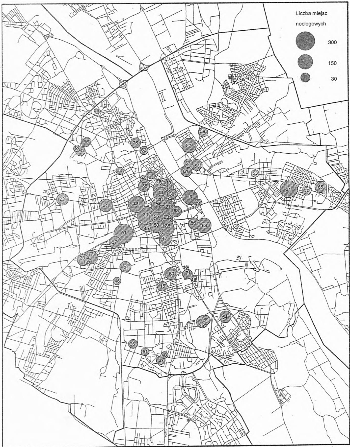
Rys. 2. Liczba miejsc w ogólnodostępnych obiektach noclegowych w gminie Warszawa-Centrum w 1994 r. Uwaga: numeracja obiektów jak w Tab. I