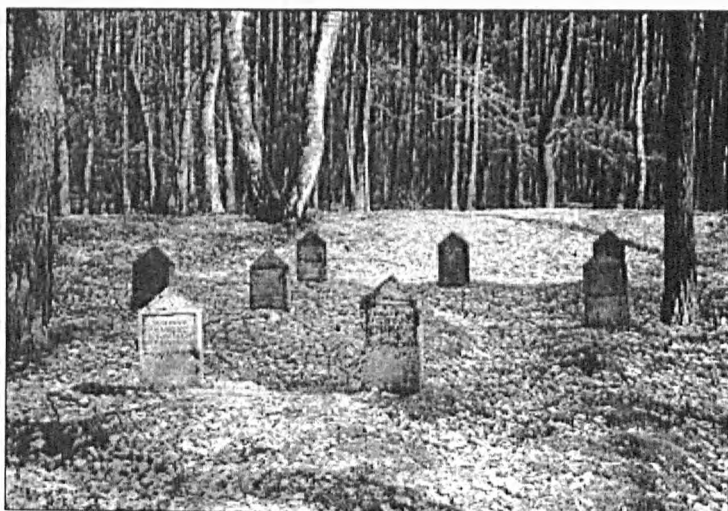
Fot. 2. Cmentarz w Wymysłowie

Photo 1. The cemetery in Kielczówka