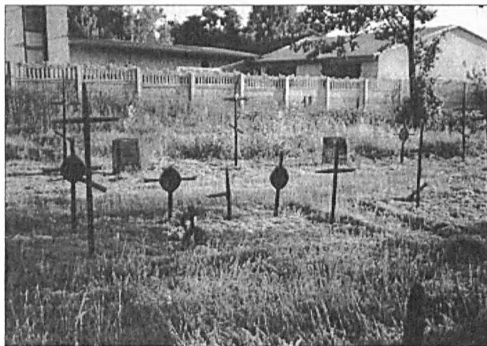
Fot. 1. Cmentarz w Kielczówce

central monuments, in addition to information about the number and nationality of the soldiers buried, short epitaphs can also be found i.e. texts in the form of a motto, often rhymed ( Encyklopedia popularna PWN, 1994 ).