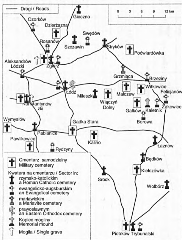
Rys. 1. Wojskowe miejsca pochówku z okresu I wojny światowej w okolicach Łodzi

(RÓŻYCKI 1936). The battle was not limited to the Brzeziny region, but included all movements of the German 9 th army and the Russian 1 st , 2 nd and 5 th armies around Łódź (DĄBROWSKI 1937) from Piotrków and Będków in the south, through Pabianice, Konstantynów and Aleksandrów in the west, to Stryków, Zgierz and even Ozorków in the north. One result of Operation Łódź was the division of the region into two occupation zones: German and Austrian, with the border running to the north of Piotrków and Wieluń.