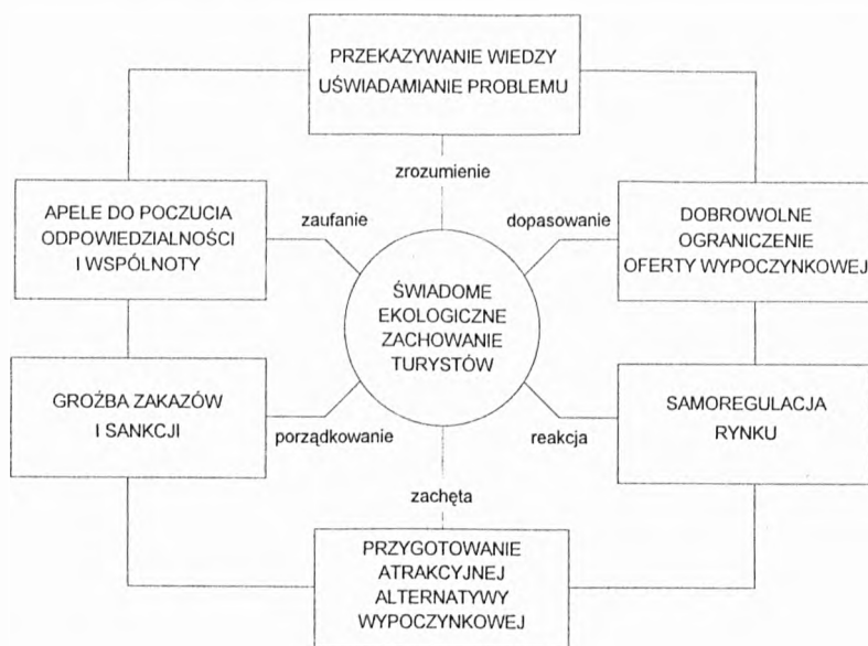
Rys. 3. Czynniki wpływające na zmianę zachowania turystów (wg H. W. Opaschowskiego 1991, tłumaczenie autora)

6. Działalność propagandowa i edukacyjna. Najskuteczniejszą jednak formą łagodzenia konfliktów między ochroną przyrody a turystyką jest kształtowanie właściwych postaw i zachowań zwiedzających. Kształtowanie świadomości ekologicznej jest niewątpliwie procesem trudnym, długotrwałym i wymaga wszechstronnego oddziaływania na społeczeństwo. Nie wystarczą już same