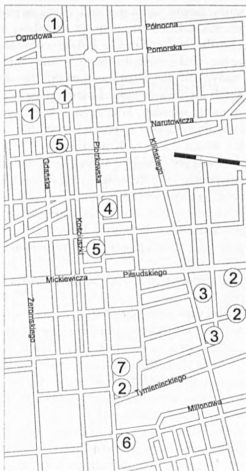
Rys. 1. Usytuowanie omawianych pałaców na planie centrum Łodzi

cyjnymi i balowymi), częściowo hotelową (dla przyjezdnych gości i interesantów). Czasami funkcje te mieściły się pod jednym dachem i wówczas np. parter zajmowały kantory biurowe, czasem sale giełdowe, magazyny, pomieszczenia reprezentacyjne, piętro pokoje prywatne i gościnne, poddasze (lub oficyny czy skrzydła boczne) pokoje dla służby.