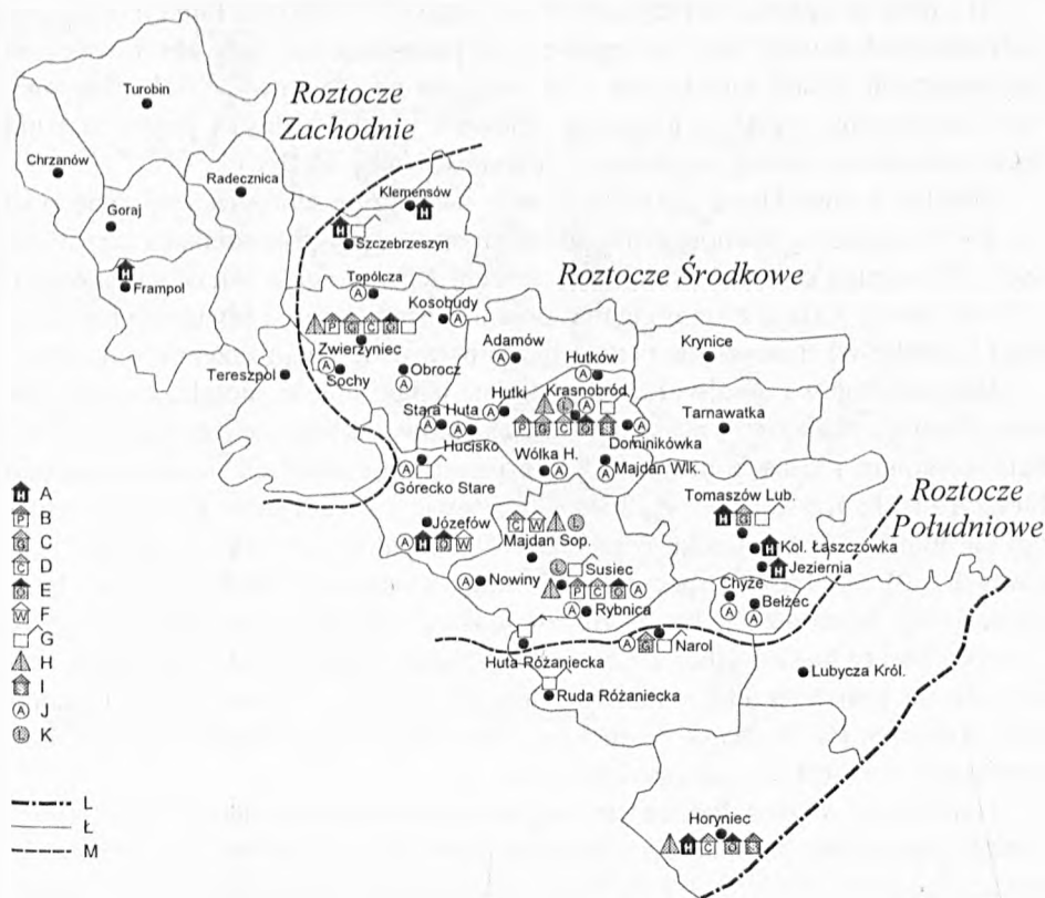
Rys. 2. Struktura bazy noclegowej Roztocza w 1997 r.

nowały już w okresie międzywojennym (K u r e k 1995), a we wsiach wybrzeża i pojezierzy baza turystyczna rozwinęła się w latach sześćdziesiątych i siedemdziesiątych (D r z e w i e c k i 1995). Tradycje agroturystyki na Roztoczu, w porównaniu z innymi regionami turystycznymi Polski, są bardzo krótkie – 4–5 lat. Pomimo tego, roztoczańskie gospodarstwa agroturystyczne są obecnie najszybciej rozwijającą się i najliczniej reprezentowaną formą bazy noclegowej.