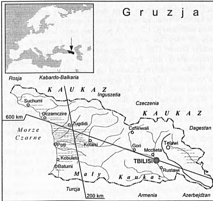
Rys. 1. Mapa Gruzji – ujęcie schematyczne

miłość, przyjaźń i równość płci, jak i Stalina – jednego z największych zbrodniarzy XX w.