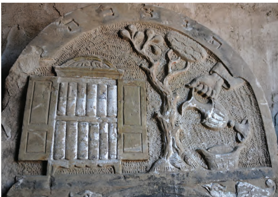
13. Fragment zwieńczenia macewy z żółtą polichromią Fot. M. Milerowska, 2013