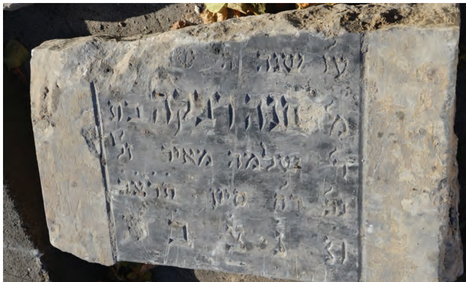
11. Fragment macewy Chanj Rebeki z zaznaczonym czarnym polem inskrypcji, fot. M. Milerowska, 2013