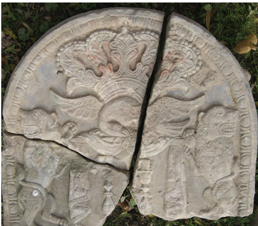
8. Relief zwierczenia macewy, 2 poł. XIX wieku, 2013