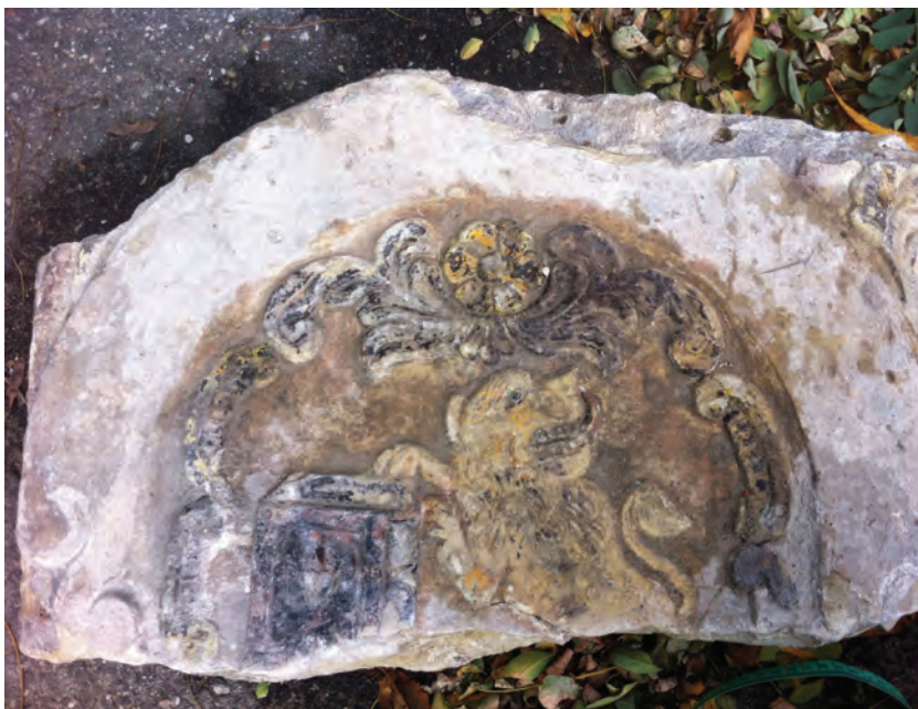
7. Zwierczenia macew o podobnym stylu kamieniarki, fot. M. Milerowska, 2013