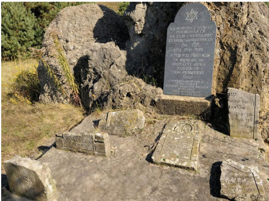
2. Tablica pamiątkowa na terenie cmentarza w Brzezinach, https://www.e-kalejdoskop.pl/wiadomosci-a230/brzeziny-zujja-na-macewach-r669

Na mocy istniejącego prawa 46 w komunistycznej rzeczywistości dopełniono aktu zniszczenia, przeznaczając teren pod żwirownię 47 . Piach wraz z ludzkimi szczątkami wykorzystano w wytwórni prefabrykatów budowlanych. Zdewastowany cmentarz przemienił się w wysypisko śmieci. Dopiero w latach 90. XX wieku z inicjatywy Żydów brzezińskich, rozrzuconych po różnych zakątkach świata, cmentarz został uporządkowany i ogrodzony. W 1992 roku, z okazji pięćdziesięciolecia zagłady getta, odbyły się uroczystości i została wmurowana tablica pamiątkowa z napisem: „Na wieczną pamięć pochowanym na tym cmentarzu Żydom