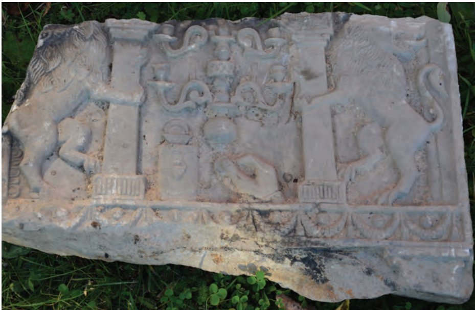
9. Fragment zwieńczenia macewy, piaskowiec, poł. XIX wieku, fot. M. Milerowska, 2013