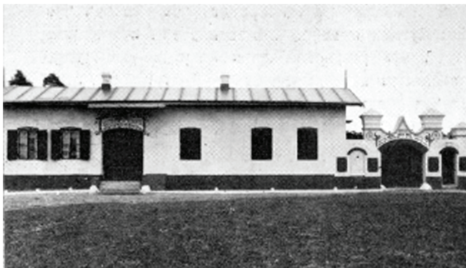
1. Dom przedpogrzebowy w Brzezinach i główne wejście na teren cmentarza, https://digitalcollections.nypl.org/items/683538f0-6152-0133-0087-00505686a51c#/?uuiid=6d7e9a20-6152-0133-6125-00505686a51c

Z powodu trwającej od czasów II wojny dyslokacji nagrobków i zniszczenia terenu cmentarza nie wiadomo, jak wyglądało rozkwaterowanie grobów, ale w Polsce przyjął się zwyczaj, że kobiety, mężczyźni i dzieci chowano w osobnych częściach 44 . Procesy asymilacyjne, właściwe dla drugiej połowy XIX wieku, po części zniwelowały ten układ (wprowadzenie grobów rodzinnych, przeważnie przy głównych alejach). Przymuszenie w Brzezinach przyjęto tradycyjny podział. Przemawiałby za tym konserwatyzm lokalnego środowiska aż do początków XX wieku – świadczą o tym dekoracje i epigrafy na nagrobkach. W zespole inwentaryzowanych macew znajdujących się w brzezińskim muzeum dominują pomniki z grobów kobiet, co może świadczyć o tym, że istniała taka odrębna kwatera, która została zniszczona, a kamienny materiał wykorzystano do budowy mostu i jazu przy zalewie nad rzeką Mroźycą. Potwierdzają to także kompletne nagrobki dzieci, które z kolei wykorzystano do budowy drogi do Dąbrówki. Przed II wojną światową cmentarz był ogrodzony, wejście do niego wiodło przez reprezentacyjną bramę. Przygotowania do pogrzebu odbywały się w skromnym domu przedpogrzebowym.