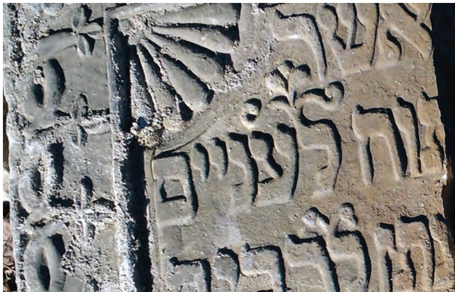
14. Stylizowane pismo wypukłe, piaskowiec, poł. XIX wieku, fot. M. Milerowska, 2013

od XIX wieku zaczęły pojawiać się teksty w językach danego kraju. Na cmentarzu żydowskim w Brzezinach obok inskrypcji hebrajskich funkcjonowały także mieszane: polskie i hebrajskie 62 oraz jidyszowe. Odczytanie wybranych epigrafów pozwoliło na identyfikację kilkunastu osób i ustalenie czasu powstania pomników 63 . Litery są przeważnie rytowane wklęsłe, natomiast wypukłe pojawiają się tylko na kilku pomnikach z I połowy XIX wieku oraz z okresu dwudziestolecia międzywojennego. Te drugie cechuje geometryczna stylizacja. Na jednej z macew zachowały się wypukłe stylizowane litery wykończone ozdobnymi ptasimi główkami. W brzezińskich epitafiach występują charakterystyczne dla żydowskich epigrafów znaki segmentacji tekstu, abrewiacje i akrostychy.