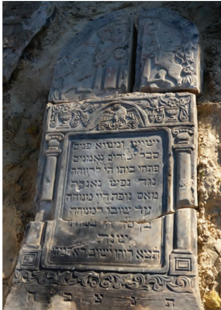
4. Macewa Jozefa, syna Menachema, zm. 1879, piaskowiec