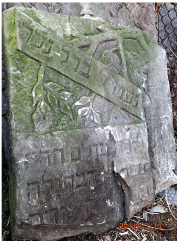
5. Fragment nagrobka Netil Berliner, XX wiek Fot. M. Milerowska, 2013

Jak wskazuje tabela, najczęściej nagrobków posiada zwieńczenie zakończone półkolistym łukiem. Ciekawy przykład zakomponowania płyty odnajdujemy na nagrobku z motywem złamanego drzewa, którego liście przyozdabiają inskrypcję.