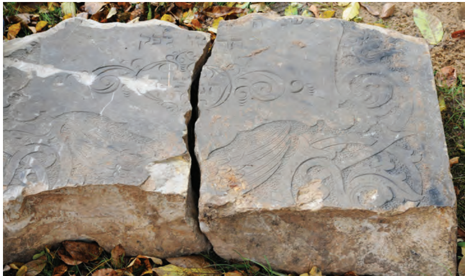
6. Fragmenty granitowej macewy nieznaney kobiety Fot. M. Milerowska, 2013

Podstawowym budulcem steli był piaskowiec, popularny ze względu na niską cenę i łatwą dostępność. Wśród zinwentaryzowanych fragmentów tylko jeden z nagrobków wykonany został z granitu.