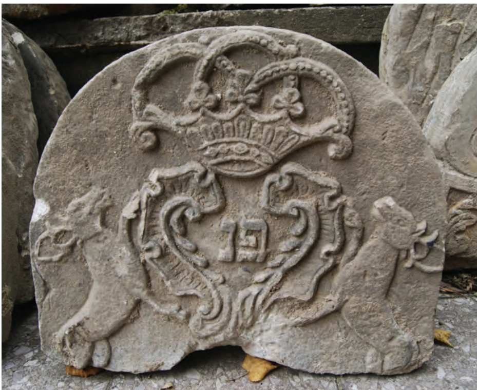
10. Zwiercienie macewy, piaskowiec, poł. XIX wieku, 2013