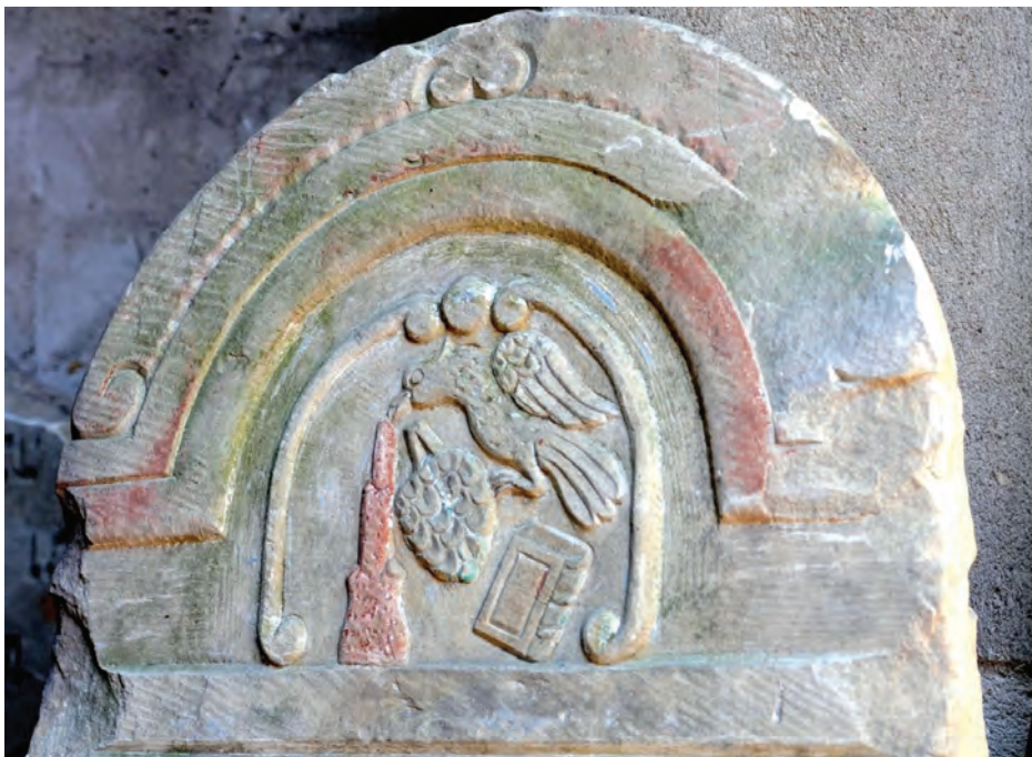
12. Zachowana polichromia macewy, piaskowiec, XX wiek. Widoczne ślady niebieskiej barwy, czerwieni i srebra, fot. M. Milerowska, 2013