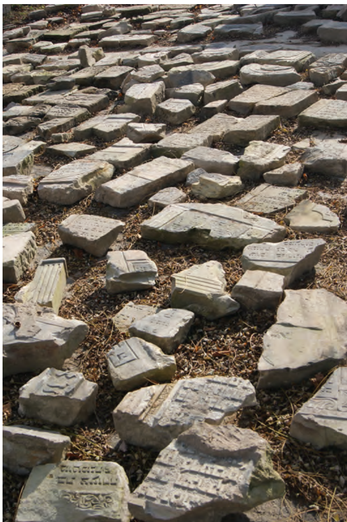
15. Początek inwentaryzacji w 2013 roku, plac muzealny, fot. M. Milerowska, 2013

stanowią zniszczone fragmenty. Przeprowadzone do tej pory badania pozwoliły na wstępną typologię nagrobków (w oparciu o kształt zwieńczeń), wskazanie najpopularniejszych motywów dekoracyjnych, wykonanie pomiarów i dokumentacji fotograficznej. Na części płyt wydobytych z wody zachowała się malatura. Niestety podczas prac inwentaryzacyjnych, na skutek różnych warunków atmosferycznych (słońce, deszcz), kolory uległy zatarciu. Niektóre stele pod wpływem powietrza wyschły, zaczęły się rozwarstwiać i kruszyć. Miejsce przechowywania – muzealne podwórko – oraz brak zabezpieczeń sprzyjają procesowi postępującej destrukcji. Oprócz objęcia nagrobków konieczną ochroną ważnym postulatem jest przeprowadzenie dalszych badań nad inskrypcjami i dekoracją. Połączone z archiwalną