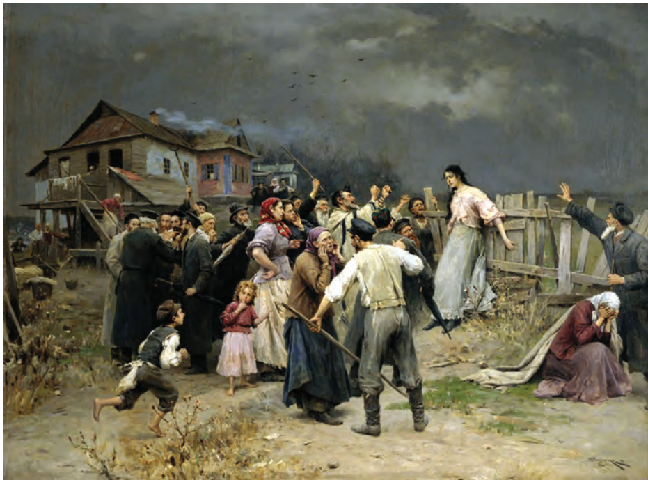
3. Mykoła Pymonenko, Ofiara fanatyzmu, „Жертва фанатизму”.

Wołodymyr Orłowskiy z Kijowa, uważany za twórcę nowoczesnego realistycznego krajobrazu ukraińskiego i inni.