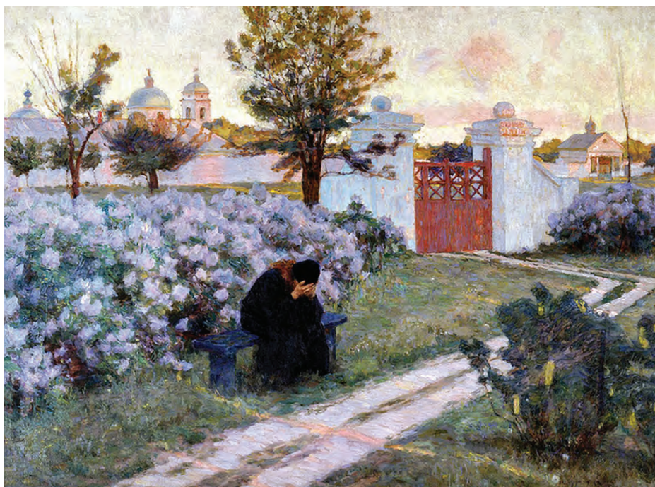
4. Kyriak Kostandi, Bez, „Розквітлий бузок”.

często tematyką związaną z życiem miasta, różniły się od sytuacji w środowisku artystycznym Ukrainy, gdzie impresjonizm nie stał się samodzielny nurtem malarstwowym, a pozostawił ślady w twórczości poszczególnych artystów.