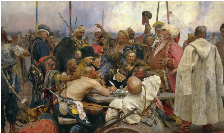
2. Ilja Riepin, Kozacy piszą list do sułtana, „Запорожцы пишут письмо турецкому султану”.