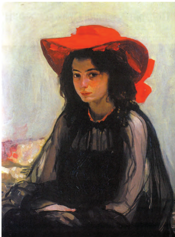
5. Ołeksandr Muraszko, Dziewczyna w czerwonym kapeluszu . Źródło: „Дівчина в червоному капелюсі”, https://upload.wikimedia.org/wikipedia/commons/7/7b/Olexandr_murashko_Divchyna_u_chervonim_kapeliusi.jpg [dostęp: 11.12.2019]

o zasady malarstwa modernistycznego swój własny styl. Charakterystyczne jest operowanie barwą (barwna plama, przenikające się często jaskrawe, mocne kolory), gra światła w obrazie. Obrazy tego artysty wydają się „malowane światłem” 8 .