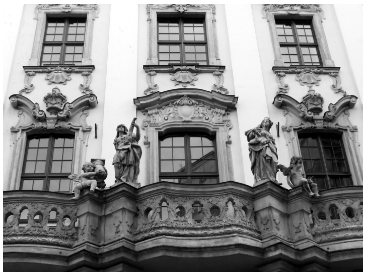
Elewacja kolegium jezuickiego we Wrocławiu

Przedstawiona publikacja jest cennym zwieńczeniem sesji naukowej, a podejmowane zagadnienia dotyczą szczególnie ważnych, znanych, lecz stale wymagających dalszych badań obiektów architektonicznych. Zawężenie tytułu do dwóch ośrodków, Genui i Wrocławia, w rzeczywistości zaowocowało spójnością dopełniających się artykułów, a zarazem pozwoliło na wpisanie dwóch tytułowych realizacji w kontekst sztuki europejskiej doby baroku. Poza wysokim poziomem merytorycznych do atutów woluminu należy bogaty materiał ilustracyjny, dopełniający obraz wskazywanych w tekstach motywów, jak i analiz porównawczych. Dzięki wydaniu tomu w języku angielskim książka może zyskać charakter uniwersalny, przyczyniając się do wymiany myśli z zagranicznymi historykami sztuki i popularyzacji dokonań polskich badaczy na arenie międzynarodowej.