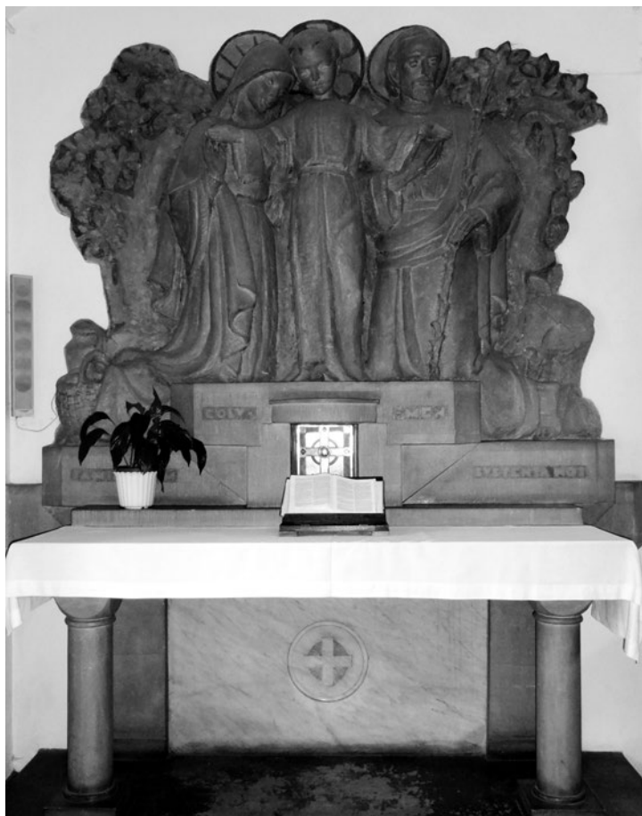
Lublin, kościół akademicki pw. Św Krzyża, ołtarz w nawie bocznej, fot. 2017

kamiennego ołtarza podkreślały (zastąpione dziś obrzędem namaszczenia) wyryte na mensie znaki krzyża, odpowiadające pięciu ranom Pana 36 . Aleksander z Hales (ok. 1185-1245) dostrzegał symboliczny związek pomiędzy Chrystusem, ołtarzem i własnościami materiału skalnego: communitas (jedność, komunია, wspólnota) 37 , fortitudo (siła, męstwo) i durabilitas (trwałość) 38 . Bernard de Parentinis (†1342) w kamiennej formie ołtarza widział z kolei symbol grobu Pańskiego 39 . Zachowane kamienne mensy, pochodzące z I tysiąclecia, z bogato profilowanymi, rzeźbionymi pasami ścianek bocznych i górną powierzchnią blatu, są świadectwem artystycznego