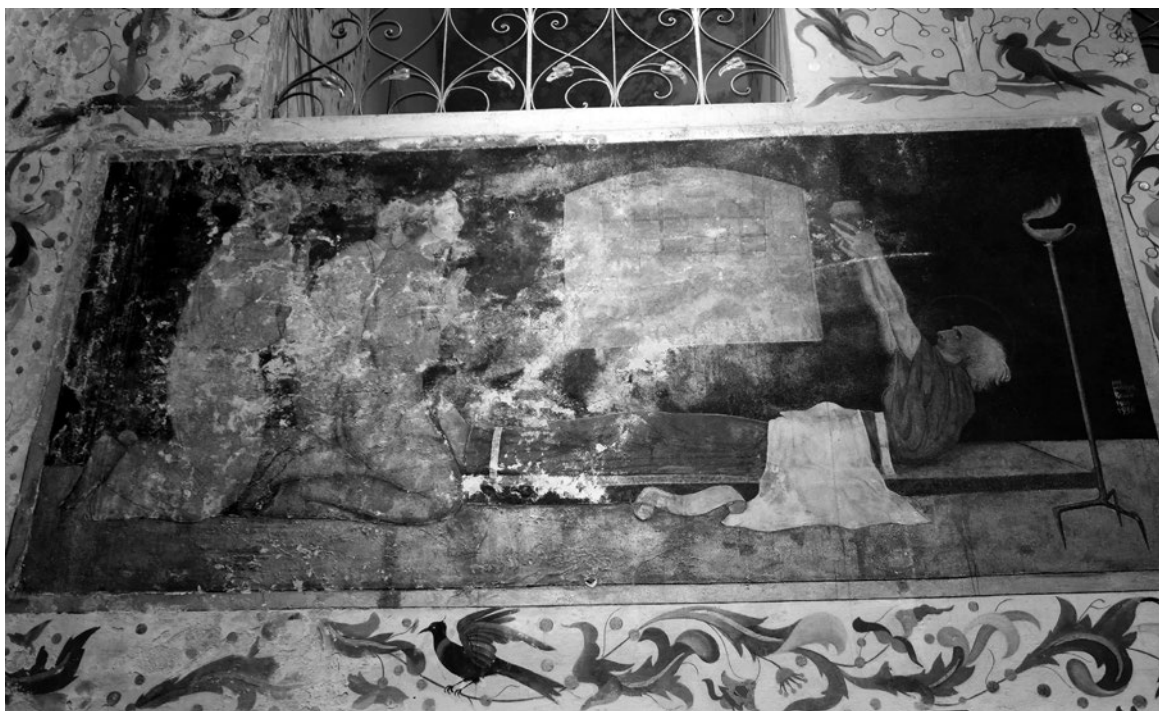
Lwów, Kaplica seminaryjna Siedmiu Sakramentów, Jan Heryk Rosen, Eucharystia, fot 2017

z symbolem Chrystusa już w chrześcijańskiej starożytności 31 . Podobnie bowiem jak na pustyni za dotknięciem laski Mojżesza ze skały wypłynęła woda, tak z przebitego boku Chrystusa, wypłynęła krew i woda, z której biorą początek sakramenty, w szczególności sprawowana na ołtarzu Eucharystia 32 . Znamiennym wyrazem utożsamiania ołtarza z Chrystusem (który przez ofiarę swego ciała na krzyżu (...) sam stał się Kapłanem, Ołtarzem i Barankiem ofiarnym 33 i jest jednocześnie ołtarzem i ciałem, hostią i ofiarą, kapłanem (ipse offerens) i żertwą ofiarną (ipse oblatio) 34 ) jest bardzo wymowny fresk Jana Heryka Rosena z kaplicy siedmiu sakramentów lwowskiego seminarium duchownego. Przedstawia on uwięzionego kapłana, który jako alter Christus odprawia Eucharystię na swoim ciele 35 . Chrystologiczną symbolikę