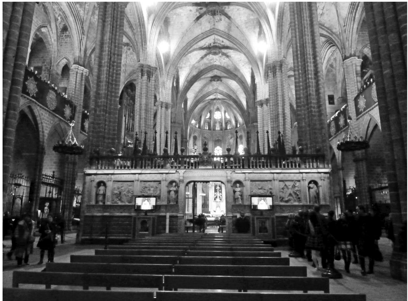
Barcelona, Katedra Św. Eulalii (Santa Eulàlia), lektorium, fot. 2016

przez przedstawicieli reformacji 97 kazały wierzącym w realną obecność Boga na ołtarzu dołożyć starań, by zewnętrzną formą jeszcze mocniej podkreślić dostojeństwo, świętość i wielkość eucharystycznej tajemnicy. Jednocześnie, kiedy dziś tak bardzo podkreślamy altarocentryzm przestrzeni sakralnych kształtowanych po Soborze Watykańskim II (1962-1965) 98 , warto zwrócić uwagę, że już okres reformy po So-