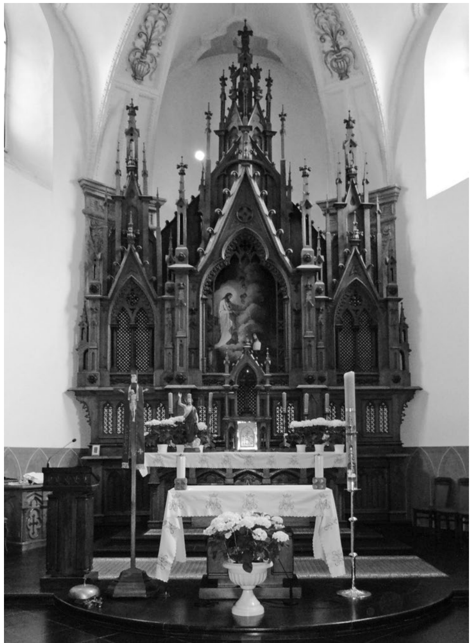
Lublin, Kościół Rektoralny pw. Wniebowzięcia Najświętszej Maryi Panny Zwycięskiej, neogotycka nastawa 1901, fot. 2017