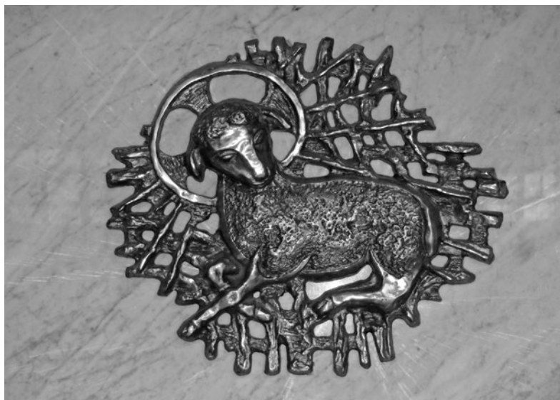
Lublin, kościół św. Franciszka i Serca Maryji, podstawa ołtarza, fot. 2017

kunsztu, głębokiej myśli teologicznej 40 i troski o godną oprawę sprawowanego na nich Sakramentu. Na późniejszym etapie rozwoju sztuki sakralnej, dekorację ołtarza wzbogacą złożone, posrebrzane, czy haftowane antepedia 41 . Podstawę ołtarza, poza wymienionymi wcześniej modelami (stołowym, skrzyniowym, blokowym) formować będą kształty sarkofagowe. Zachowane przykłady wskazują, że każda postać stipes (profilowane kolumny, płaskorzeźbione płyciny, metaloplastycznie kształtowane fenestella confessionis) traktowana była w dekoracyjno-rzeźbiarski sposób. Obecnie obowiązujące przepisy nie odnoszą się do formy podstawy, dając projektantom niemal pełną swobodę, co znajduje wyraz w różnorodności ich kształtów. Zalecają jedynie stosowanie kamiennej mensy 42 , pozostawiając możliwość wprowadzenia innego, odpowiednio wartościowego i trwałego materiału 43 . Bryły współczesnych ołtarzy przyjmują najczęściej prostą postać, uformowaną z gładko wyszlifowanych, kamiennych płyt bądź bloków. Ich podstawy wzbogacają niekiedy symboliczne dekoracje, przedstawiające między innymi, częstokroć powtarzany, podkreślający ofiarniczy charakter sakramentu, motyw baranka albo ostatniej wieczerzy.