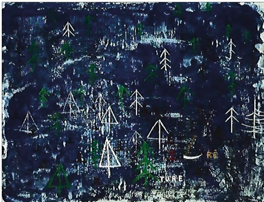
1. Zofia Lipecka – obraz pt. Forts & faibles_5 / Silni i slabi_5 , 2018