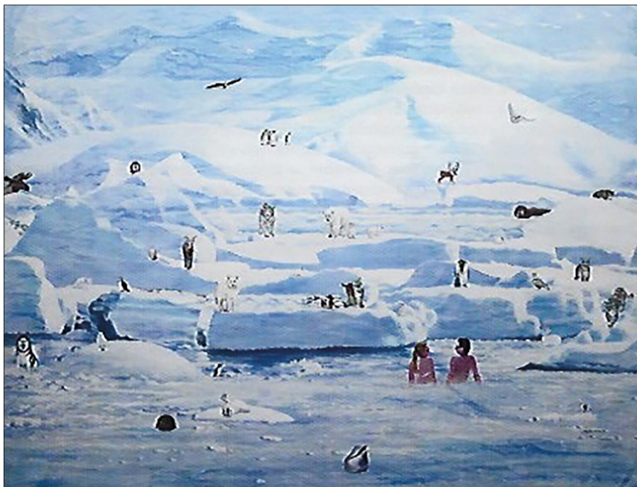
3. Zofia Lipecka – obraz pt. Biotopia_10 (Nord) / Biotopia_10 (Północ) , 2017

ogłupiałych ludzi w strojach plażowych, znajdujących się pośród pokrytego lodem i śniegiem arktycznego krajobrazu, ślepych i obojętnych na otaczający ich świat, w dojmujący sposób pojawia się także w obrazie Biotopia_10 (Nord) z 2017 roku – w arktycznym otoczeniu dominuje biel. Jak pisze sama artystka: „Biel w moich obrazach oznacza interesujący mnie problem życia i śmierci. Kontrast ciepło – zimno, nagość – ubranie, wywołują sprzeczne odczucia: zachwyt nad pięknem przyrody, lęk przed ludzkim okrucieństwem, melancholię...”. Eleonora Jedlińska dodaje, że w mitologii Aborygenów biel uznawana jest za kolor święty.