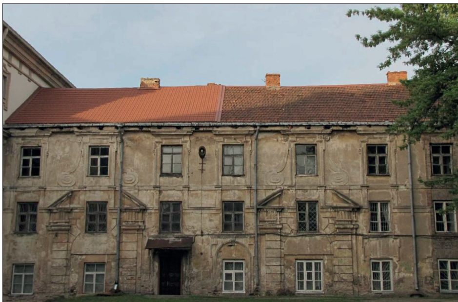
3. Wilno, pałac „Januszowski” – skrzydło środkowe, fot. T. Bernatowicz, 2015

Niezwykle cennym i godnym podkreślenia elementem pozostają wypisy z archiwaliów – w przypadku pałacu Abramowiczów cytowane są fragmenty korespondencji z lat 1782–1784, odnoszące się do prac budowlanych i wykończeniowych. Spośród analizowanych założeń rezydencjonalnych pozwolimy sobie przywołać przynajmniej dwa kolejne exempla. Należy do nich pałac Radziwiłłów („Januszowski”) na Łukiszkach, przy Bramie Wileńskiej [il. 3–4]. Anna Sylwia Czyż jako czas budowy przyjęła okres po roku 1638, analizując dotychczasowe ustalenia historyków sztuki i zawężając datowanie.