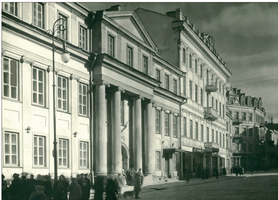
2. J. Bułhak, Wilno, pałac Abramowiczów (Brzostowskich), Biblioteka Narodowa, fot. domena publiczna

Ciekawym wątkiem podjętym w publikacji jest przybliżenie sposobu prowadzenia „fabryk”. W ostatniej części Autorka zapoznaje czytelników z architekturą rezydencjonalną Wilna, w przekrojowy i syntetyczny sposób charakteryzując między innymi bryły, elewacje, rzuty i układu funkcjonalne, wystrój wnętrz i kształtowanie otoczenia rezydencji.