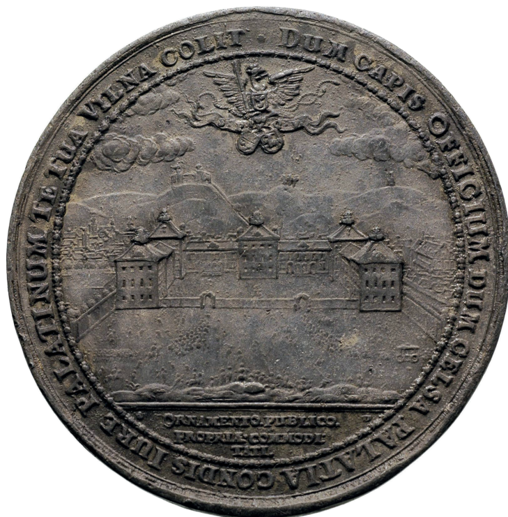
4. S. Dadler, Medal Janusza Radziwiłła (motyw: pałac „Januszkowski”), fot. domena publiczna

grupujących obiekty o zbliżonym czasie powstania, stanie zachowania lub o analogicznej formie architektonicznej. Powyższa uwaga ma jednak charakter czysto techniczny i nie umniejsza wartości merytorycznej katalogu.