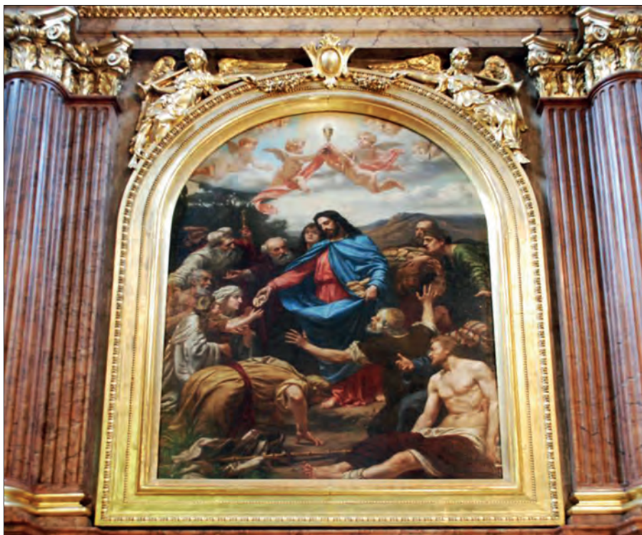
11. Ołtarz główny w kościele św. Wojciecha w Kielcach z obrazem Jana Styki, Cudowne rozmnożenie chleba na pustyni, 1885

warszawską „Biesiadę Literacką”, o którym była wcześniej mowa, a dzieło sygnowane jest „Jan Styka, 1885 r.” 25 Jest to więc z pewnością obraz, jaki pojawił się na warszawskiej wystawie, a datowanie „1889 r.” podawane w źródłach parafialnych i w monografii Styków jest błędne. Artysta podarował parafii swoją pracę sprzed kilku lat w 1889 roku – stąd pojawiające się fałszywe datowanie – być może wówczas domalowując górną partię z adoracją Eucharystii. Z pewnością łódzkie dzieło zdecydowanie góruje pod względem klasy artystycznej nad obrazem kieleckim. Styka w czasie kilkuletniego pobytu w Kielcach wykonał do tego kościoła jeszcze kompozycje Św. Jan Nepomucen ; Św. Józef ; Św. Rozalia i Św. Franciszek – mogły to być prace wykonane wcześniej i ofiarowane świątyni w czasie pobytu w mieście 26 .