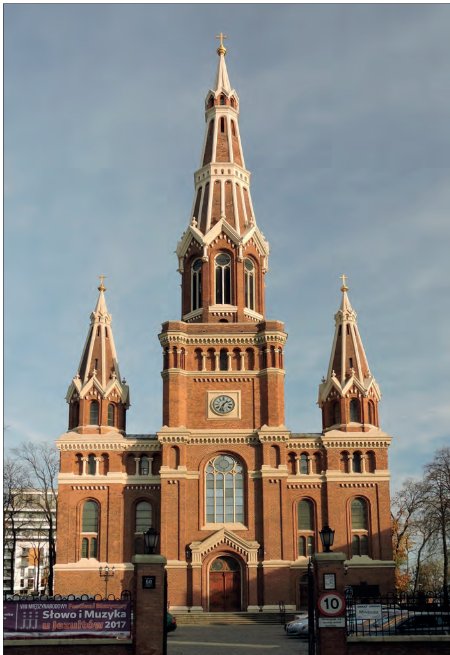
2. Ludwik (Louis) Schreiber, Kościół jezuicki Najświętszego Serca Jezusa (dawny kościół ewangelicko-augsburski św. Jana Ewangelisty) w Łodzi, 1880–1884, fasada; fot. K. Stefański, 2017