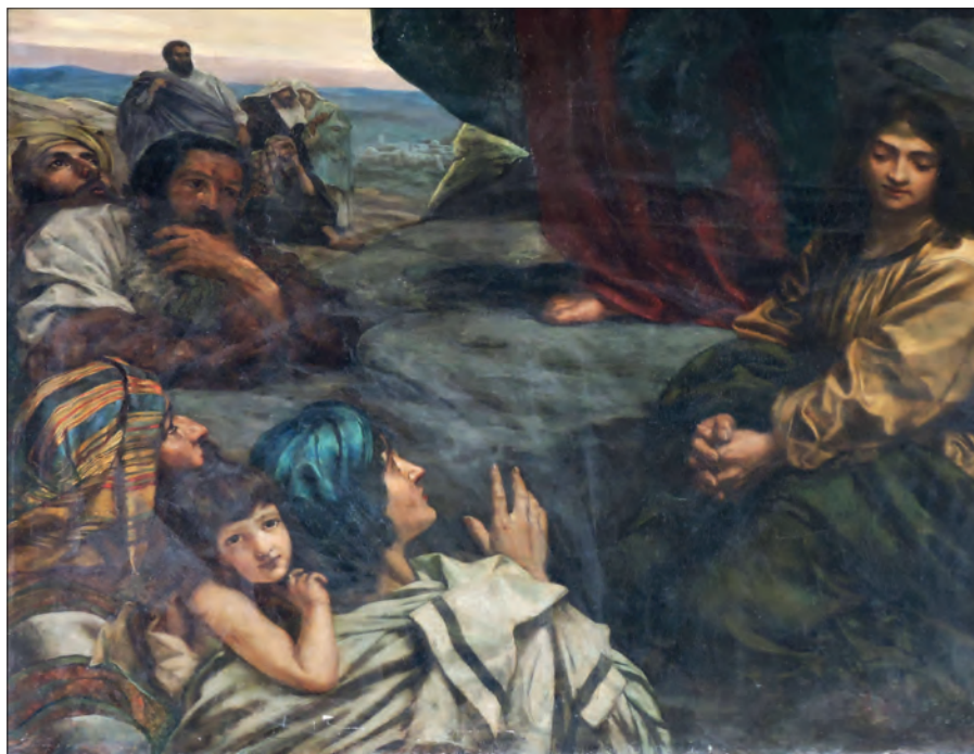
10. Jan Styka, Chrystus nauczający uczniów i rzesze ludu (Kazanie na górze) , fragment, 1885, kaplica św. Krzysztofa przy kościele jezuitckim Najświętszego Serca Jezusa (dawny kościół ewangelicko-augsburski św. Jana Ewangelisty) w Łodzi

realistyczne, powagę i surowość formy, dynamizując poprzez wyrazistą, dominującą postać Chrystusa ukazywaną zazwyczaj statycznie scenę.