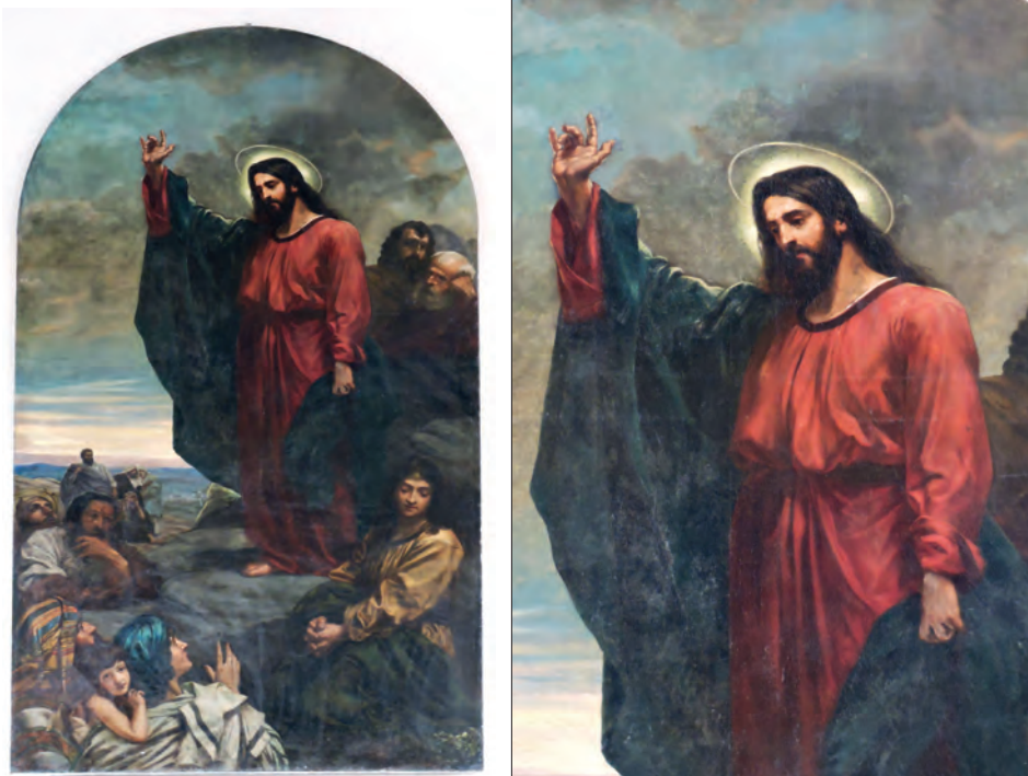
7–8. Jan Styka, Chrystus nauczający uczniów i rzesze ludu (Kazanie na górze) , 1885, kaplica św. Krzysztofa przy kościele jezuickim Najświętszego Serca Jezusa (dawny kościół ewangelicko-augsburski św. Jana Ewangelisty) w Łodzi – widok ogólny i fragment z postacią Chrystusa

apostołowie, umieszczeni z tyłu, za Chrystusem, z uwidocznionymi na pierwszym planie dwiema postaciami, zapewne św. Piotra i św. Jakuba Starszego (?).