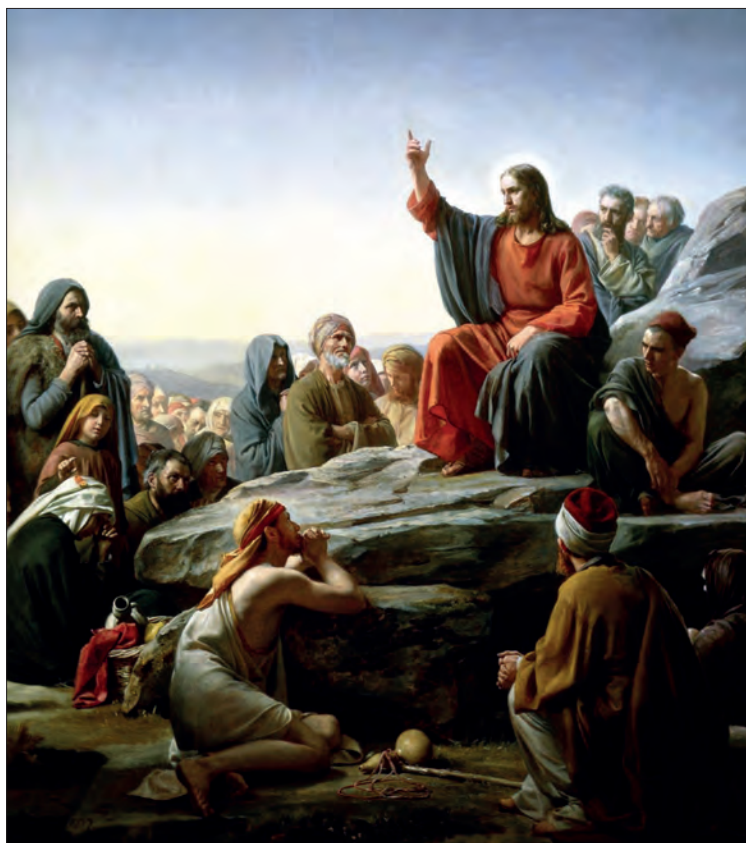
9. Carl Bloch, Kazanie na górze , ok. 1870, Kopenhaga, kaplica na zamku Frederiksborg; za: https://en.wikipedia.org/wiki/Carl_Bloch , [24.10.2022] domena publiczna

Spośród innych przykładów ujęcia tematu najbardziej istotne jest dla nas bliższe czasowo dzieło Duńczyka Carla Blocha (ur. w Kopenhadze w 1834 – zm. tamże w 1890), który przez wiele lat żył i pracował w Rzymie 20 (il. 9). Jest to obraz ze stworzonego przez artystę dużego cyklu, obejmującego 23 prace ilustrujące życie Jezusa, powstałego w latach 1865–1879 dla kaplicy zamku Frederiksborg w Kopenhadze. Cykl ten cieszył się w owym czasie dużym uznaniem i zdobył znaczny rozgłos 21 .