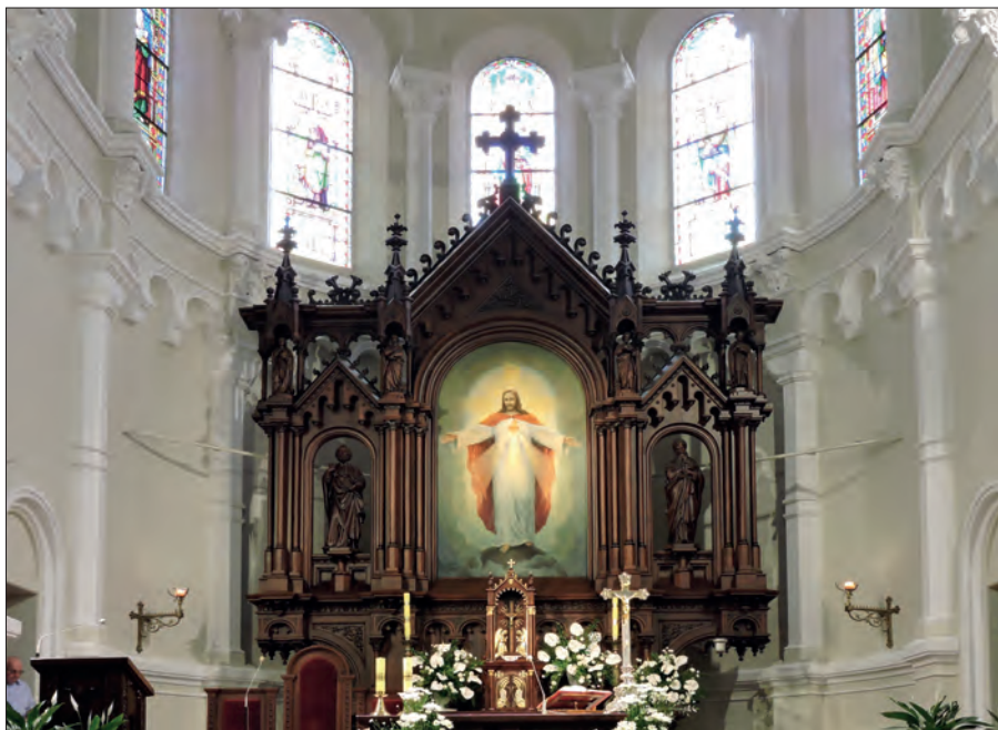
3. Ludwik (Louis) Schreiber, Kościół jezuicki Najświętszego Serca Jezusa (dawny kościół ewangelicko-augsburski św. Jana Ewangelisty) w Łodzi, 1880–1884, prezbiterium z ołtarzem głównym; fot. K. Stefański, 2017