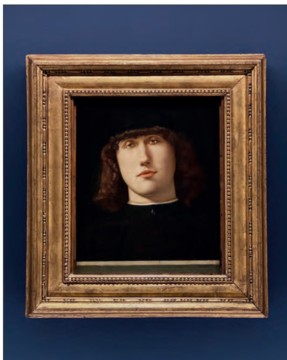
7. | L. Lotto, Portret młodego mężczyzny , ok. 1500, olej na desce, Bergamo, Accademia Carrara, fot. autorka, 2022