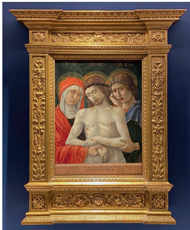
8. | G. Bellini, Pieta, ok. 1455, tempera na desce, Bergamo, Accademia Carrara

Mówiąc o malarstwie włoskim omawianego okresu, nie można pominąć sztuki religijnej. Na wystawie gatunek ten prezentowany jest przez kilka prac, np. Pieta Giovanniego Belliniego (ok. 1455, tempera na desce; il. 8), niesamowita Madonna z dzieciątkiem pędzla Cosmè Tury (ok. 1475–1480, tempera i złoto na desce) i wreszcie Matka Boska karmiąca Defendentego Ferrariego (ok. 1530, olej na desce), która jest własnością kolekcji zamkowej od 2021 roku. Obrazy prezentowane widzowi służyły głównie do prywatnej dewocji. Wyjątkowość Madonny z dzieciątkiem Tury natychmiast przyciąga wzrok widza, nawet pomimo sąsiedztwa tak wielkiego mistrza jak Giovanni Bellini. Postacie, które na swych obrazach prezentował Tura, są postrzegane jako nagle zatrzymane lub co więcej – skamieniałe. Przerwanie nagle zatrzymanego ruchu stanowi szczególny urok sztuki Tury. To odczucie jest całkowicie zgodne zarówno z występującymi u niego twardymi, ostrymi kształtami, jak i kolorami, nieświadomymi subtelnymi, stopniowych przejść z jednego odcienia do drugiego. Wszystko to, w połączeniu z głęboko wyciętymi liniami, nadaje dziełom Tury niesamowitą stylistyczną całość. W książce Obrazy Włoch Paweł Muratow, rosyjski pisarz i historyk sztuki, pisze o tym artyście: