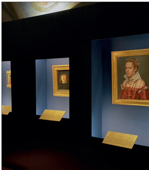
6. | Fragment aranżacji wystawy z Portretem młodego mężczyzny L. Lotta, fot. autorka, 2022