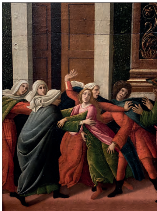
1. | S. Botticelli, Historia Wirginii, ok. 1500, tempera, olej i złoto na desce, Bergamo, Accademia Carrara – detal

Natomiast od czerwca 2022 roku widzowie mogli zapoznać się z siedmioma renesansowymi arcydziełami – po raz pierwszy przywiezionymi do stolicy Polski – ze zbiorów Akademii Carrara w Bergamo. Jak czytamy na stronie internetowej Muzeum Zamku Królewskiego, wystawa Botticelli opowiada historię... składa się z prac artystów reprezentujących pięć ośrodków artystycznych północnych Włoch: Wenecję, Florencję, Ferrarę, Bergamo i Weronę, w okresie od połowy XV wieku (quattrocento) do ostatnich dziesięcioleci XVI wieku (cinquecento). Ukoronowaniem wystawy jest obraz namalowany przez Sandro Botticellego Historia Wirginii z około 1500 roku, który stanowił jedną z dwóch spallier, niegdyś zdobiących reprezentacyjne wnętrza w patrycjuszowskim domu rodu Vespuccich we Florencji. Druga spalliera, która ukazuje scenę śmierci Lukrecji, obecnie znajduje się w Isabella Stewart Gardner Museum w Bostonie. Poprzez wystawę w Zamku Królewskim widz ma okazję poznać talent Botticellego jako rewolucyjnego narratora, który odkrył na nowo dwa ważne epizody z historii starożytnego Rzymu. Botticelli był jednym z pierwszych florenckich artystów, którzy poważnie podszli do zrozumienia antycznych fabuł. Realizm sztuki i kult człowieka pomogły renesansowym mistrzom przezwyciężyć stare średniowieczne podejście do świata. Legendy opowiadane przez Botticellego są przedstawiane w gęstym i graficznym – prawie kinematograficznym – stylu (il. 1).