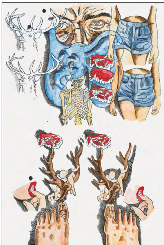
4. | Bez tytułu (akwarela na papierze), 2015, Fundacja Pełkińska xx Czartoryskich