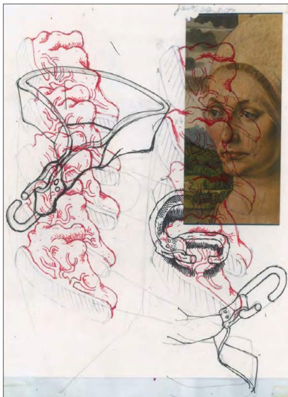
3. | Praca z serii Borborygmi , 2012, Fundacja Pełkińska xx Czartoryskich