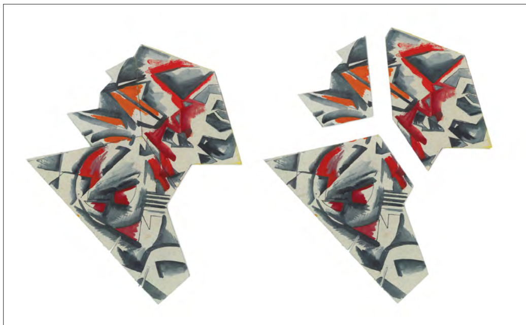
6. | Model abstrakcyjny , 2014, Fundacja Pełkińska xx Czarторыskich