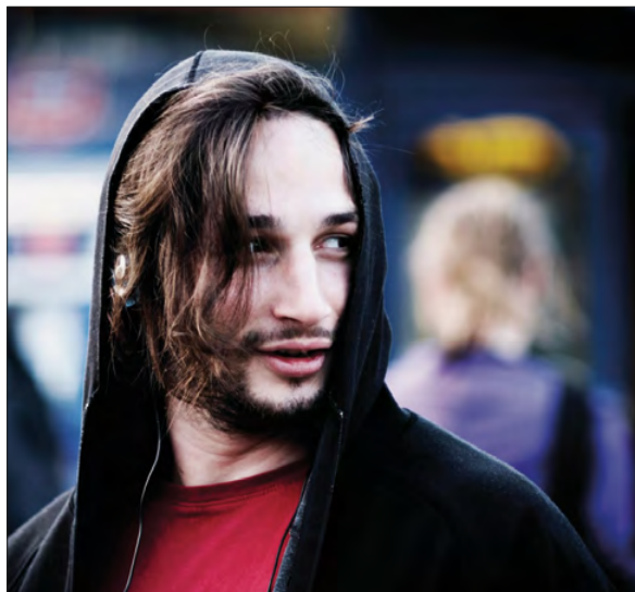
1. | Konstanty Czartoryski – portret, Fundacja Pełkińska xx Czartoryskich