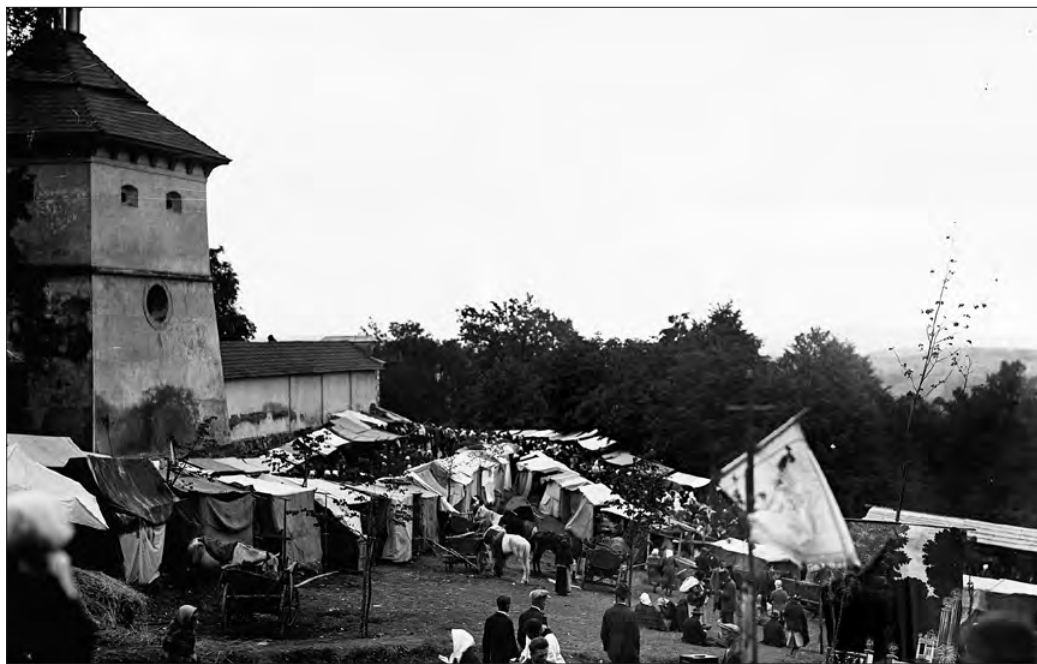
3. | Ogólny widok kramów odpustowych pod klasztorem, 1931

ewentualnie w bractwie św. Michała. Urzędnicy mieli stanowić instytucję ściśle współpracującą z Bernardynami, „wiedząc jak wielki lud, który z różnych miejsc i krajów ciśnie się na to Miejsce S. Kalwaryjskie” 30 . Zakazano pijaństwa, szynkarze mieli donosić do rady miasta o nadużywających alkoholu (artykuł 7). Celem łatwiejszego egzekwowania i nadzorowania pobożności mieszczan ława miasta miała każdego roku organizować „schadzkę z pospólstwa i inkwizycję, wyprowadzając cokolwiek może się znajdować z tego, aby sprawiedliwie [...] zachowania tych artykułów we wszystkim przy obecności od nas ordynowanego [...] obierać mają” 31 . Zabroniono wypasu zwierząt hodowlanych w obszarze Jerozolimy („Także trzody, bydła nierogatego, uchowaj Boże, aby na tych miejscach nie parano, czego obywatele tutejsi, ile którzy rolki trzymają, przestrzegać powinni”) 32 . Nakazano należycie obchodzić w mieście święta i uroczystości kościelne. Wszystko celem „rozmnożenia chwały Pana Boga Wszechmogącego, ku pożytkowi i ozdobie miasteczka Nowego Zebrzydowa” 33 .