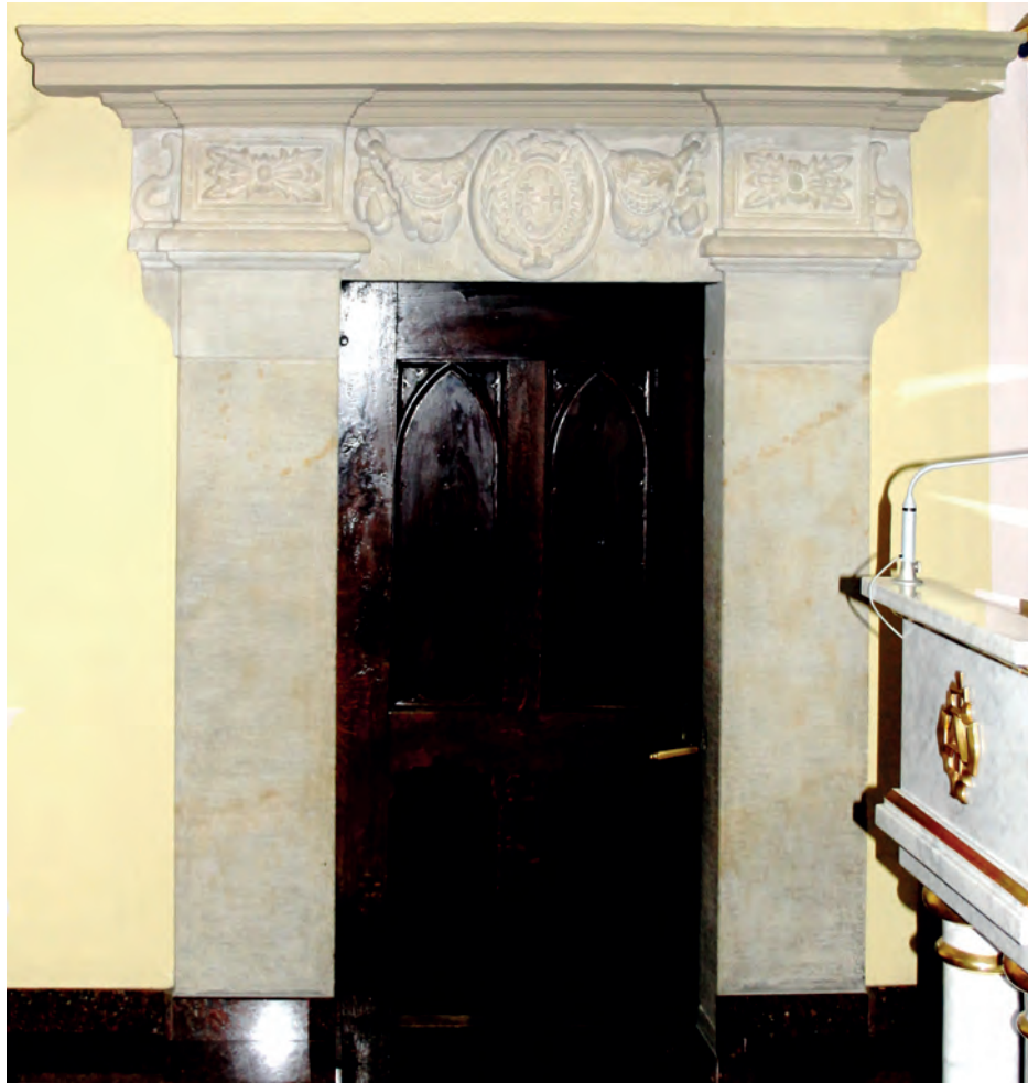
5. Szczepanów, kościół św. Marii Magdaleny i św. Stanisława, manierystyczny portal neogotyckiej zakrystii, fot. autor, 2013

Wynika z tego, że nowe wejście do kościoła zbudowano prawdopodobnie z chwilą zaprzestania funkcjonowania kruchty gotyckiej, którą zamieniono na kaplicę. Asymetryczne umieszczenie kruchty północnej wskazuje na jej późniejsze dostawienie do północnego muru kaplicy. Zarazem wydaje się, że w tym miejscu mogła nastąpić reorganizacja układu wejścia – budując nową kruchtę ustawiono ją bliżej pośredniej przypory północnej, aby nieco powiększyć zachodni aneks kaplicy (może w celu wstawienia drugiego ołtarza), ale też nie ograniczyć zbytnio wschodniej przestrzeni kaplicy. Prawdopodobnie już wcześniej w zachodniej ścianie kaplicy (jak wskazuje rysunek rzutu) funkcjonowało wtórnie wykonane wejście z zewnątrz,