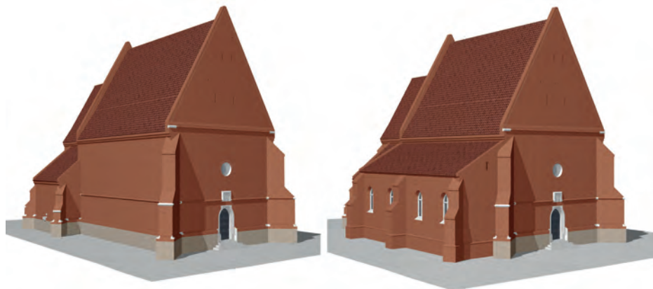
4. Szczepanów, kościół św. Marii Magdaleny, widok od północnego zachodu, rekonstrukcje, z lewej: faza gotycka, z prawej: stan po wybudowaniu północnego traktu, rys. autor

Fakt istnienia przypór oraz sposób ich rozstawienia może wskazywać na pierwotne przekrycie dobudowanego traktu dwoma bardzo wydłużonymi przęsłami sklepieniami krzyżowo – może na wzór sklepienia zakrystii. Jednakże na wewnętrznym polu kaplicy badacz nie wrysował odpowiedniego odrzutowania. Przekrój poprzeczny kaplicy uwidacznia układ sklepienia kolebkowego na półkolistym obrysie, przy czym wysokość pionowego odcinka ściany jest równa szerokości traktu kaplicy. Wschodni odcinek muru pomiędzy dwiema przyporami zawiera dwa okna rozglifione jedynie do wewnątrz, zatem ich stylistyka mogła być renesansowa lub barokowa. Z uwagi na istnienie późnogotyckich struktur w postaci przypór można zakładać, że były to okna ostrołukowe, przekształcone następnie w podobny sposób jak gotyckie okna kościoła, w których Łuszczkiewicz zaznaczył wstawione poziome nadproża 7 .