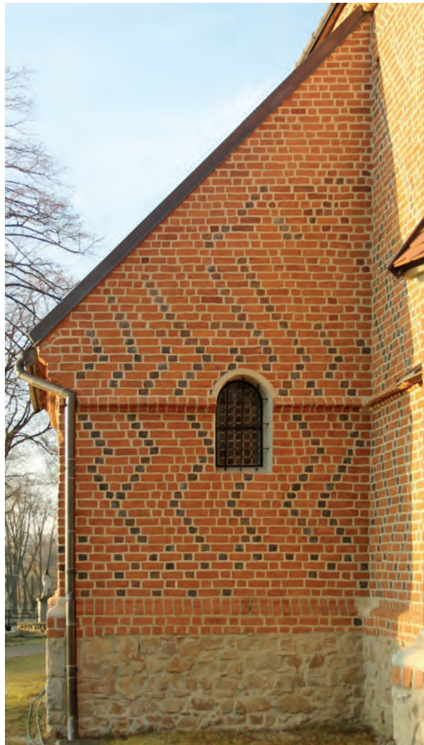
6. Szczepanów, kościół św. Marii Magdaleny, elewacja wschodnia gotyckiej kruchty, 2013

tego przejścia z wejściem zachodnim do kościoła daje pogląd na zakres wykonanej tu przeróbki. Część arkady od strony nawy (około \frac{2}{3} grubości muru), nakryta łukiem odcinkowym, odpowiada temu samemu, wewnętrznemu fragmentowi wejścia zachodniego. Możliwe jest, że dla poszerzenia otworu usunięto dawne rozglifienie i podkuto także rozglifienie łuku. W pozostałej szerokości muru od strony wnętrza kaplicy wykonano rozglifienie, którego górne zamknięcie uzyskało kształt łuku koszowego. Strefa rozglifienia odpowiada szerokością kamieniarki usuniętego portalu gotyckiego, co byłoby zgodne z układem kamieniarki portalu zachodniego.