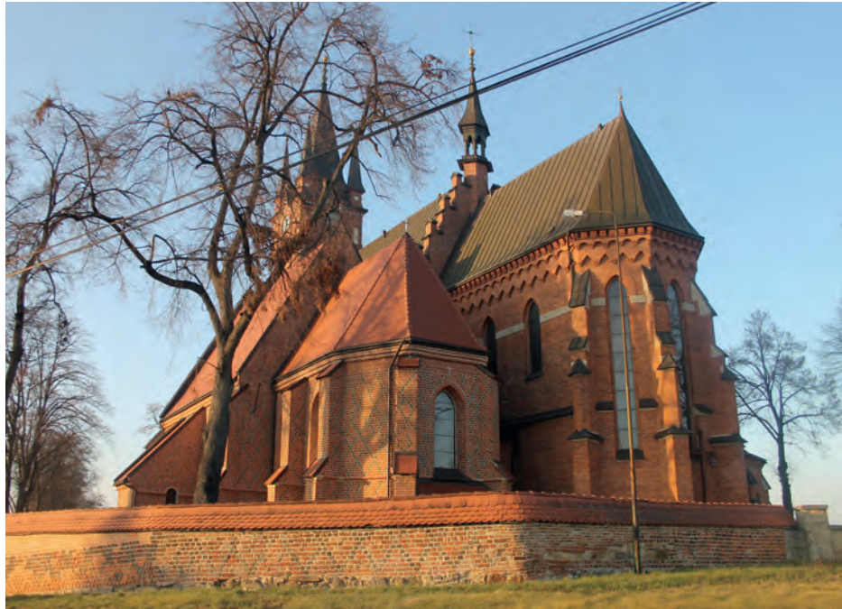
7. Szczepanów, kościół św. Marii Magdaleny i św. Stanisława, widok od południowego wschodu, fot. autor, 2013

Zachowany dawny kościół przyjął funkcję kaplicy zintegrowanej z dobudowaną bazyliką w taki sposób, że przebywając w gotyckim wnętrzu daje się odczuć zarówno jego odrębność, jak i subtelny poziom połączenia z nowo utworzoną przestrzenią emanującą stylistyką neogotycką. Ukształtowany na początku XX wieku zespół sakralny może być zatem uważany zarówno za kościół podwójny, jak też monumentalną świątynię połączoną ze starszą od niej o blisko 450 lat kaplicą.