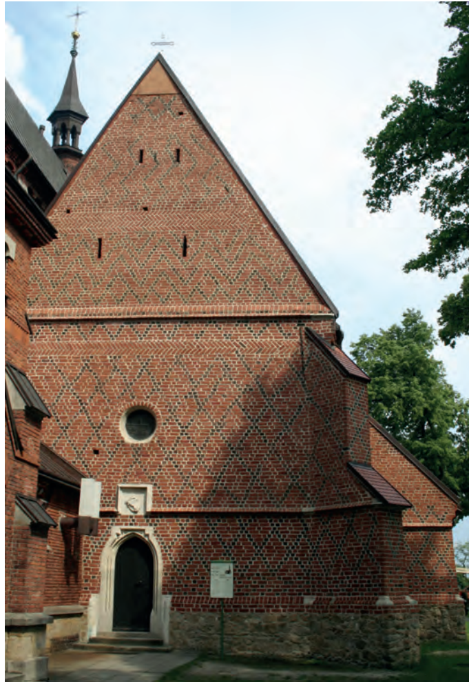
3. Szczepanów, kościół św. Marii Magdaleny, elewacja zachodnia, 2011

Szczepanowski kościół św. Marii Magdaleny, nie będąc siedzibą diecezji, nie mógł posiadać tytułu katedralnego. Jednak jako sanktuarium związane z postacią św. Stanisława biskupa miał nie mniejsze znaczenie nie tylko dla parafii czy najbliższej okolicy. Szczepanów był przecież drugim po Krakowie ośrodkiem kultu tego świętego, którego początki datuje się jeszcze przed jego kanonizacją, obejmującego poza ziemią krakowską także Śląsk, ziemię łęczycką i Pomorze Gdańskie 5 . Zapewne względy silnej tradycji związanej i utożsamianej z kościołem w Szczepanowie