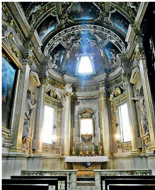
2. Katedra w Urbino, kaplica Najświętszego Sakramentu, koniec XVI wieku, dekoracja malarska autorstwa Federica Barocciego