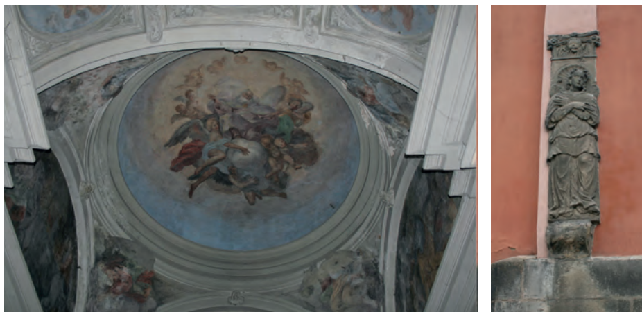
6. Kolegiata św. Jakuba w Nysie, zachowana dekoracja malarska oraz fragment elewacji kaplicy Najświętszego Sakramentu, lata 1670–1680, fundacja biskupa Fryderyka Heskiego, fot. autorka

wizerunkami czterech ewangelistów w pendentywach i przedstawieniem Boga Ojca w kopule kościoła. Do budowy miejsca adoracji Najświętszego Sakramentu użyto fragmentów rozebranego sakramentshaus . Można przypuszczać, że do jego struktury należały też ozdobne pilastry, które obecnie pozostają wkomponowane w południową elewację kaplicy (il. 6) 39 .