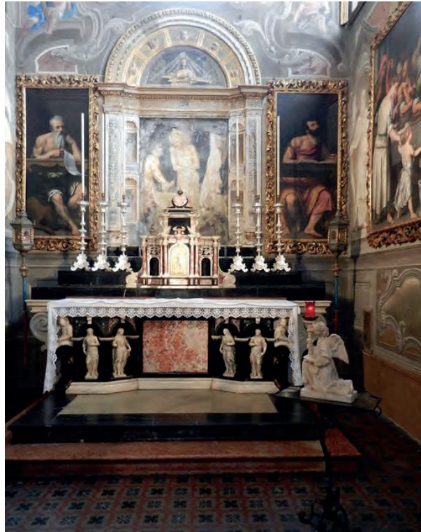
1. Stara katedra w Brescii, kaplica Najświętszego Sakramentu, lata 60. XVI wieku

a także okazałe kaplice brackie w Brescii – w kościele św. Jana Ewangelisty, świątyni św. św. Nazariusza i Celsusa oraz tzw. starej katedrze (il. 1) 9 .