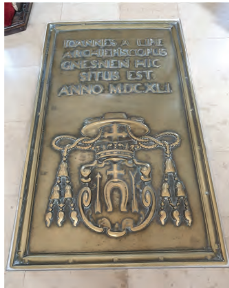
5. Kolegiata (ob. katedra) Wniebowzięcia NMP w Łowiczu, kaplica Najświętszego Sakramentu i płyta nagrobna prymasa, lata 40. XVII wieku, fundacja arcybiskupa Jana Lipskiego, obecnie przekształcona w XVIII wieku