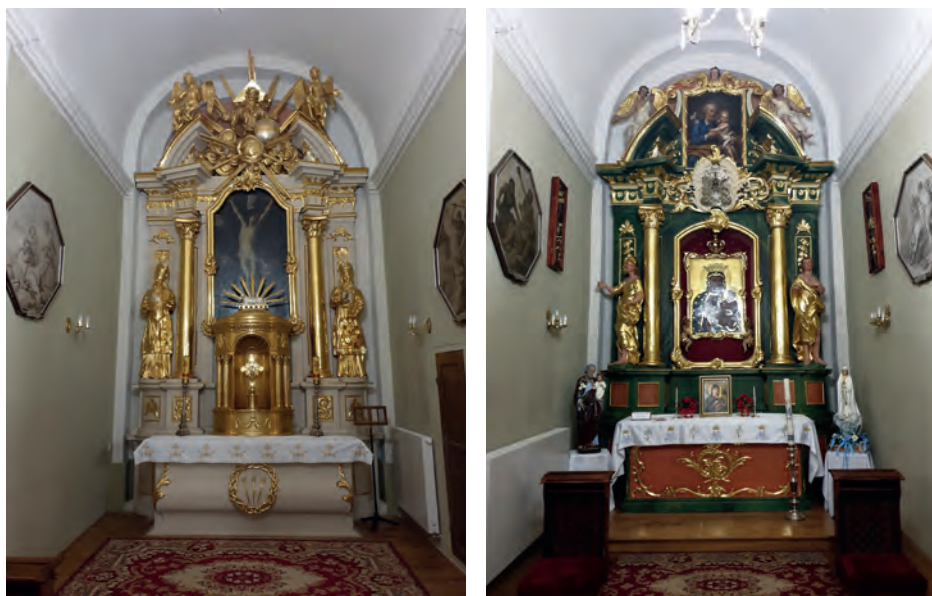
9. Kolegiata św. Trójcy w Janowie Podlaskim, ołtarze w kaplicach usytuowanych na zakończeniu naw bocznych, lata 30. XVIII wieku, przekształcone w XIX wieku

Podobny charakter do omawianego przykładu z Kielc miała kaplica Najświętszego Sakramentu usytuowana w południowej nawie kościoła kolegiackiego pw. św. Trójcy w Janowie Podlaskim. Po północnej stronie odpowiadała jej przestrzeń mieszcząca ołtarz o wezwaniu maryjnym (il. 9) 49 . Obie kaplice wzniesiono w pierwszej ćwierci XVIII wieku, w trakcie gruntownej przebudowy kościoła, którą rozpoczął biskup łucki Aleksander Wyhowski. Z zachowanych archiwaliów wiadomo, że wspomniana kaplica Cyborium miała być miejscem pochówku Wyhowskiego, do czego jednak ostatecznie nie doszło, ponieważ biskup zmarł wcześniej, długo przed jej ostatecznym ukończeniem 50 . „Fabrykę” kościoła kontynuował jego następca – biskup Joachim Przebendowski, a ukończył Stefan Bogusław Rupniewski 51 . W nowo wzniesionej kaplicy postawiono odnowiony ołtarz św. Krzyża 52 , do którego