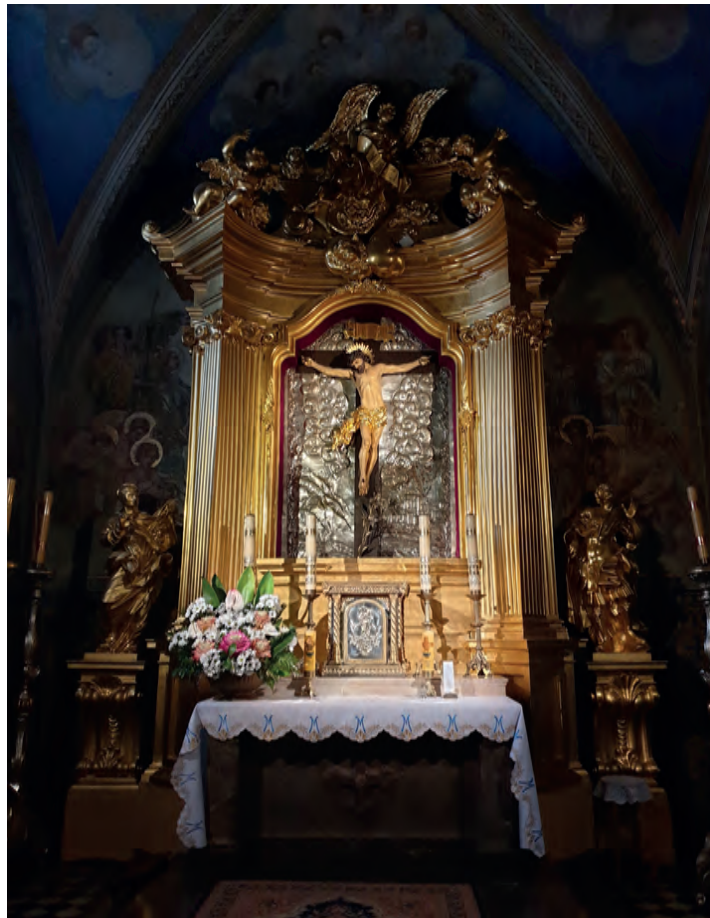
8. Kolegiata (ob. katedra) Wniebowzięcia NMP, ołtarz Ukrzyżowania w kaplicy na zakończeniu północnej nawy bocznej, lata 20. XVIII wieku, fundacja biskupa Konstantego Szaniawskiego

cyborium ustawione na ołtarzu głównym 46 . Fundację osobnej, wydzielonej przestrzeni kultu eucharystycznego w tej świątyni możemy łączyć dopiero z biskupem krakowskim Konstantym Szaniawskim. Z polecenia ordynariusza w latach 20. XVIII wieku w nawie północnej wystawiono okazały ołtarz Ukrzyżowania. Wydzielona wokół niego przestrzeń stwarzała miejsce do prywatnej adoracji, tworząc w ten sposób quasi-kaplicę Najświętszego Sakramentu (il. 8) 47 . Jej ideologicznym odpowiednikiem było miejsce poświęcone kultowi cudownego obrazu Matki Boskiej Łaskawej, umieszczone analogicznie na zakończeniu południowej nawy kościoła 48 .