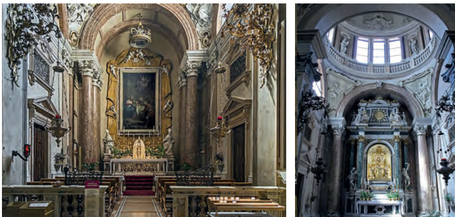
10. Katedra w Weronie, para kaplic pw. Najświętszego Sakramentu oraz Madonny Miłosiernej, lata 50.–60. XVIII wieku

kaplic maryjnych. Ten układ nawiązywać miał zapewne do znanego rzymskiego wzorca – fundacji kaplic Sykstusa V i Pawła V Borghese przy kościele Matki Boskiej Większej, a także licznych okazałych powtórzeń tego rozwiązania, spośród których można wymienić dwie kaplice zaaranżowane z polecenia kardynała Pietra Aldobrandiniego w ramionach transeptu przywoływanej już katedry raweńskiej, a także osiemnastowieczne przykłady odpowiadających sobie kaplic w Udine, Padwie 58 oraz Weronie (il. 10).