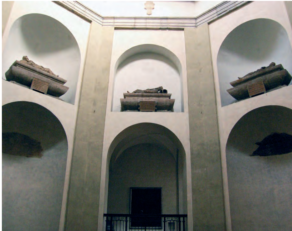
1. Kościół San Nazaro in Brolo w Mediolanie, Cappella Trivulzio, wnętrze, uk. w 1565 roku

dostęp do nich za pomocą krat, w których często pozostawiano wyłącznie małe prześwity. Wiele owych gmachów miało osobne zakryście z bogatym inwentarzem, w niektórych zaś sytuowano drugie tabernakulum, co czyniło z nich de facto odrębne kościoły 5 . Howard Colvin zaproponował więc, aby takie budowle nazywać „kaplicami autonomicznymi” ( autonomic chapels ) albo też „kaplicami dwufunkcyjnymi” ( dual-purpose chapels ), ze względu na pełnienie przez nie zarówno funkcji religijnych, jak i grzebalno-kommemoratywnych 6 .