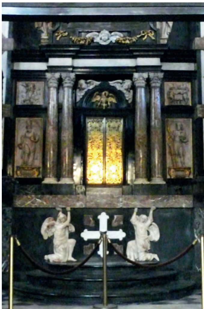
12. Sint-Donaaskathedraal w Brugii, srebrna atrapa drzwiczek wskazująca lokalizację tabernakulum na zapleczu ołtarza głównego, zamówiona 1627

że można upatrywać jej w demokratycznym charakterze municypalnego zarządu przestrzenią korpusu świątyni. Umieszczenie Eucharystii w kaplicy lub na ołtarzu jednej z gildii wyróżniłoby znacznie tę wspólnotę kosztem innych, co byłoby zapewne nie do przyjęcia w społecznościach miejskich, wyznających republikańskie wartości. Te same wartości stały zapewne na przeszkodzie rozbudowywaniu kaplic przy korpusie, które w oczywisty sposób naruszałoby mieszczańską zasadę niewynoszenia się ponad swoją wspólnotę. Trudno sobie również wyobrazić, aby któraś z dumnych i bogatych gildii zechciała przekazać swoją kaplicę na okazałe prywatne mauzoleum. Korporacje te pozawalały wprawdzie składać w swych kaplicach szczątki możnych zmarłych, ale akceptowały wyłącznie ich upamiętnienie za pomocą wizerunków wkomponowanych w obrazy ołtarzowe i skromnych płyt w posadzce,