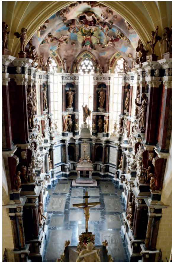
8. Sankt Marien Dom we Freibergu, Fürstliche Begräbniskapelle, wnętrze, arch. Giovanni Maria Nosseni, 1589–1595, fot. Michał Kurzej

kaplicami większymi zachował się wprawdzie w łacinie kościelnej, ale nie wszedł do świeckiej terminologii architektonicznej w językach nowożytnych z wyjątkiem hiszpańskiego 41 .