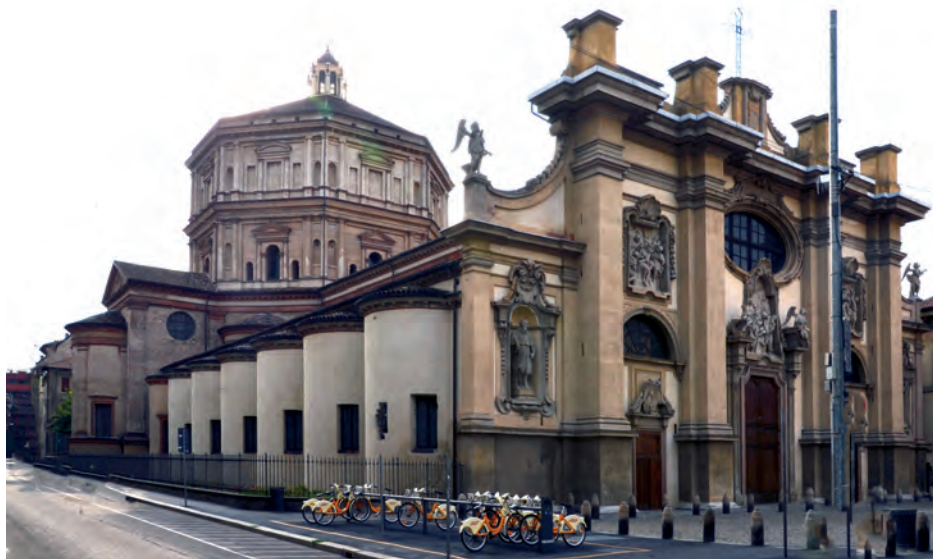
4. Kościół Santa Maria della Passione w Mediolanie, kaplice przy korpusie, arch. Martino Bassi, rozpocz. 1573