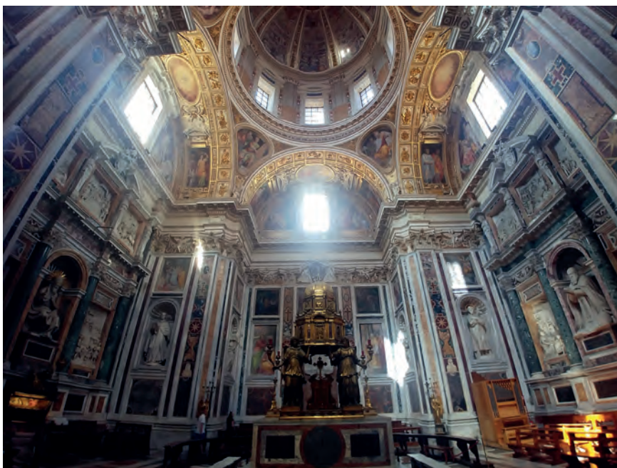
6. Bazylika Santa Maria Maggiore w Rzymie, Cappella Sistina, wewnątrz, arch. Domenico Fontana, rozpocz. 1575, fot. Michał Kurzej