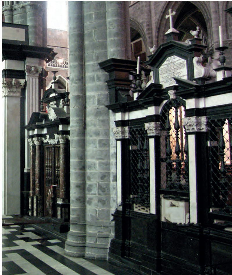
9. Sint-Baafskathedraal w Gandawie, przegroda wydzielająca prezbiterium, Hans van Mildert, ok. 1630, fot. Michał Kurzej

dłuta Hiëronymusa Duquesnoya (1602–1654) 51 . Lokalizacja i zasadniczy schemat owego okazałego dzieła – ukazującego Triesta spoczywającego w bramie życia wiecznego u stóp zmartwychwstałego Chrystusa i Matki Boskiej – były naśladowane przez kolejnych hierarchów (Carolusa van den Boscha, 1597–1665; Eugeniusa Albertusa d’Allamonta, 1609–1673; Philipsa Erarda van der Noota, 1638–1730), co doprowadziło do nadania prezbiterium katedry charakteru okazałej kaplicy grobowej biskupów gandawskich (il. 10) 52 .