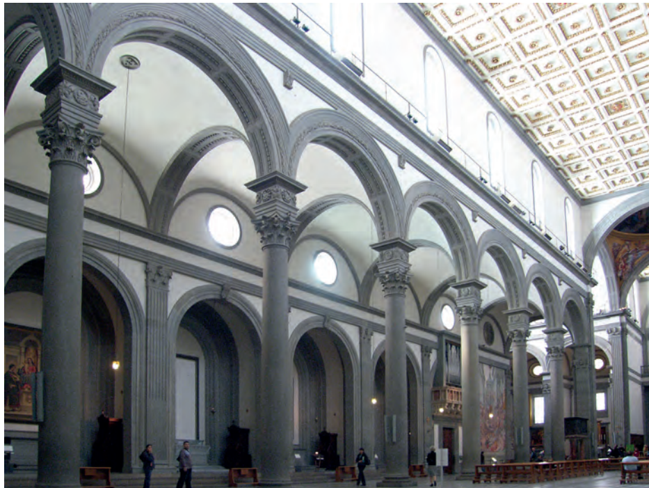
2. Kościół San Lorenzo we Florencji, korpus z ciągiem kaplic, arch. Filippo Brunelleschi, rozpocz. 1419, fot. Michał Kurzej

ale powszechnie znanym traktacie architektonicznym 10 , a także Pietro Cataneo (1510–1569) w I quattro primi libri di architettura (1554, il. 3) 11 . Ów schemat przestrzenny zastosowano w korpusach kościołów San Cristoforo w Lodi (po 1563) i San Gaudenzio w Novarze (1577–1590) oraz San Vittore al Corpo (rozpoczęty 1570) i Santa Maria della Passione w Mediolanie (rozpoczęty w 1573 roku, il. 5), wzniesionych lub przebudowanych z inicjatywy i pod nadzorem Boromeusza 12 . Jest więc rzeczą zrozumiałą, że arcybiskup mediolański uważał to rozwiązanie za gruntownie sprawdzone i przywołał je w swoich instrukcjach jako powszechnie akceptowany sposób sytuowania kaplic w przestrzeni i w bryle kościoła.