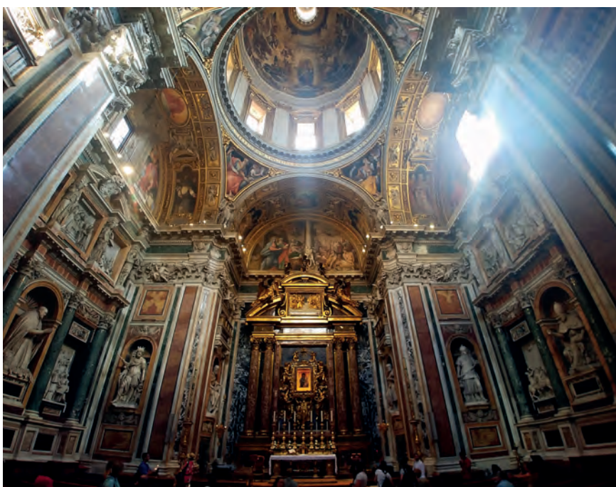
7. Bazylika Santa Maria Maggiore w Rzymie, Cappella Paolina, wewnątrz, arch. Flaminio Ponzio, rozpocz. 1605