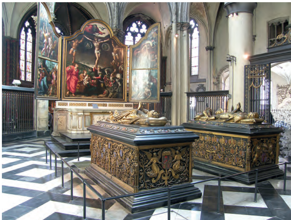
11. Onze-Lieve-Vrouwekerk w Brugii, prezbiterium przekształcone w kaplicę grobową księcia Karola Zuchwałego i jego córki Marii, ok. 1500

wiernych odprawiano w kościele Onze-Lieve-Vrouwekerk przy lepiej widocznych i bardziej okazałych ołtarzach 56 .