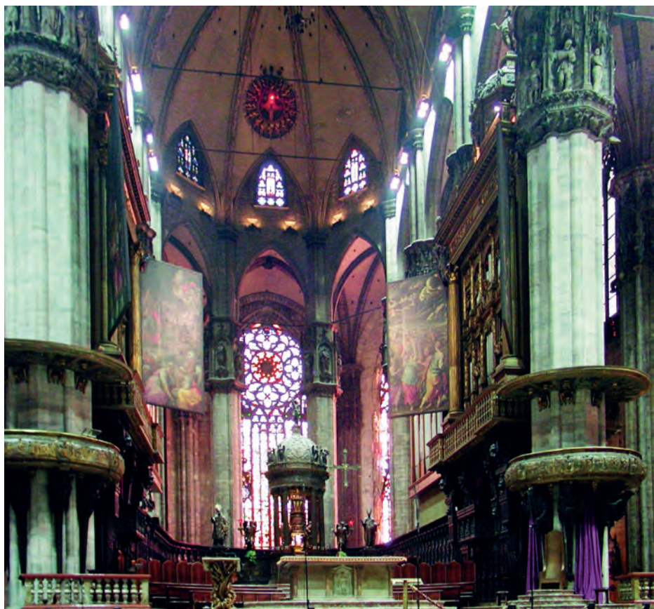
5. Katedra Santa Maria Nascente w Mediolanie, prezbiterium po aranżacji na zlecenie Karola Boromeusza, arch. Pellegrino Tibaldi, przełom lat 60. i 70. XVI wieku

również prezbiteria z wszelkich sytuowanych w nich zwyczajowo w średniowieczu 20 elementów, które odciągałyby uwagę wiernych od Ofiary mszalnej lub zdawały się nie licować z najwyższą powagą tej ceremonii.