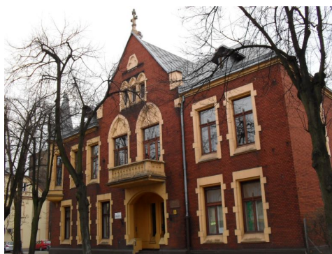
Ryc. 6. Dom parafialny przy ul. Zamkowej