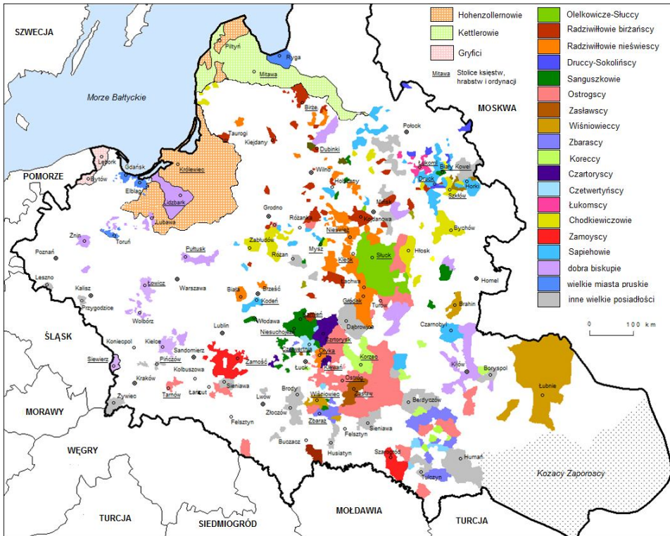
Ryc. 1. Największe posiadłości feudalne Rzeczypospolitej (bez królewskich) na przełomie XVI i XVII w.

księstwa. W ich ramach książęta mieli najwyższą władzę nad poddanymi wszystkich stanów, a więc również nad ludnością wolną: mieszczanami, szlachtą i bojarami 2 (Lubavskij 1892, 1915, Sienkiewicz 1982). Tę częściową suwerenność wewnętrzną ograniczały ogólne normy prawne obowiązujące w ramach Wielkiego Księstwa Litewskiego, które książęta (i inni wielcy panowie) musieli respektować, sprawując najwyższą władzę sądowniczą i administracyjną nad swymi poddanymi.