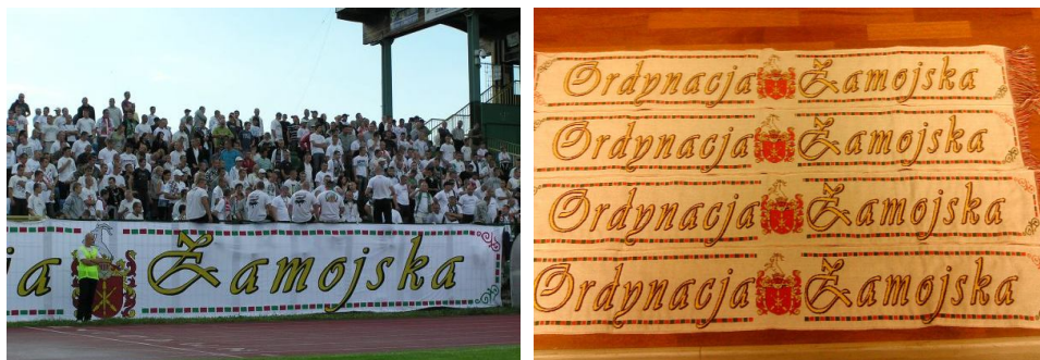
Ryc. 3. Transparent i szaliki kibiców Hetmana Zamość. Ordynacja Zamojska i jej symbole (herb Zamojskich) jako elementy budowania tożsamości kibiców

W przypadku dużej części największych posiadłości feudalnych można zauważyć rozwój silnej tożsamości lokalnej i regionalnej, częstokroć wzmacnianej odrębnościami kulturowymi. Istnienie Ordynacji Zamojskiej miało niewątpliwie istotny wpływ na ukształtowanie się silnego, obserwowanego do dziś, regionalizmu zamojskiego (Reder 1983, ryc. 3). Odrębność mieszkańców Ordynacji zauważali ich sąsiedzi, nazywając ich „Ordynatami” (podobnie jak mieszkańców Księstwa Łowickiego nazywano „Księżakami”).