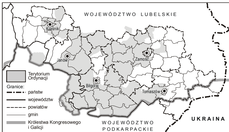
Ryc. 5. Ordynacja Zamojska jako podstawa formowania się granic państwowych (obecnie wojewódzkich), powiatów i gmin

nacji na 100 lat stała się granicą pomiędzy odrodzonym Królestwem Polskim a austriacką Galicją. Po zjednoczeniu ziem polskich trwała nadal, oddzielając jednostki terytorialne pierwszego rzędu, tj. województwa (ryc. 5).