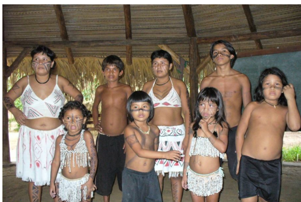
Ryc. 10. Pokaz tradycji plemiennych w wiosce Sateré-Maué Źródło: fotografia autora (2006)