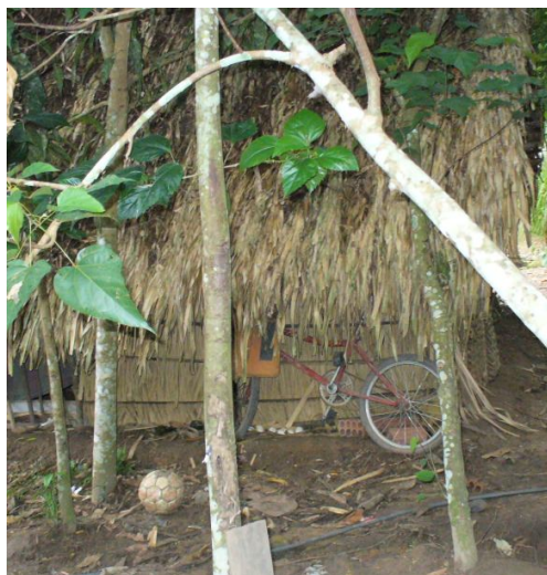
Ryc. 12. Nieoczekiwane ślady innej cywilizacji w wiosce Sateré-Maué