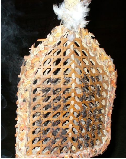
Ryc. 5. Rękawice z mrówkami używane do rytuału inicjacji przez plemię Sateré-Maué

Festiwal Tocandira pokrywa się ze zbiorami guarany, obejmując co najmniej 20 dni tego okresu (Tate 2010). Podczas festiwalu odbywa się drugi – obok produkcji guarany – rytuał, z którego słynie plemię Sateré-Maué i który niezrędko staje się tematem doniesień żadnych sensacji tabloidów (Wright 2012). Jest to rodzaj „pasowania”, obrzęd wprowadzający młodych chłopców w wieku ok. 12 lat w dorosłość (Masters 2013). Rytuał należy do najbardziej okrutnych, nawet jak na warunki Amazonii. Na obie ręce chłopca zakłada się wyplatane ze słomy, prostokątne rękawice, malowane ciemnoniebieskim barwnikiem z rośliny genipa, przybrane piórami jastrzębia i papugi, które przywiązuje się do przedramienia na ok. 10 minut. Rękawice są wypełnione kilkunastoma mrówkami z gatunku Paraponera clavata , popularnie zwanymi „mrówką pociskową” lub „24-godzinna”, gdyż ich ugryzienie ma moc uderzenia pocisku z broni palnej, a ból utrzymuje się przez dobę (Botelho, Weigel 2011) (ryc. 5). Podczas tego rytuału przejścia od dzieciństwa do dorosłości, które ma ogromne znaczenie w mitologii Sateré-Maué, wykonuje się pieśni o treściach sławiących pracę, miłość i odnoszących się do wojny ( Sateré Mawé 2012).