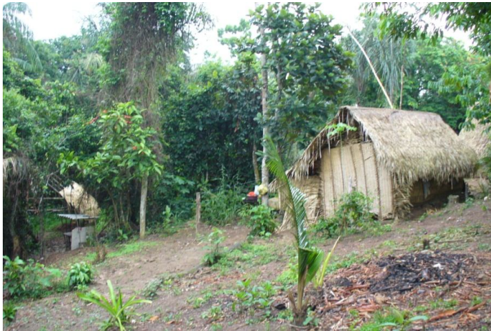
Ryc. 6. Wioska plemienia Sateré-Maué nad rzeką Ariaú niedaleko Ponte do Rio Ariaú

butów swej funkcji i przedmiotów kultu, zrobionych z kości zwierząt, ptaków i wywarów z roślin (ryc. 8). Dla podkreślenia swej dzikości szamanka posługuje się wyłącznie lokalnym językiem (jakoby nie rozumie po portugalsku), który przewodnik tłumaczy na angielski. Ze spisów powszechnych wynika, że znajomość portugalskiego wśród dorosłych Sateré-Maué jest powszechna, a zatem jest to kolejny przejaw „gry” przed turystami.