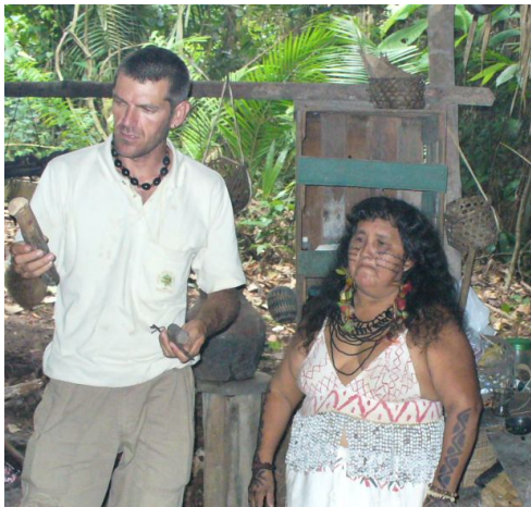
Ryc. 7. Szamanka Sateré-Maué z wioski nad rzeką Ariaú wraz z przewodnikiem-tłumaczem