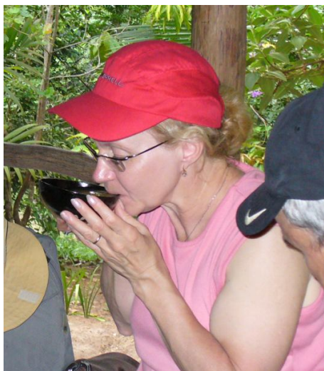
Ryc. 11. Rytuał picia guarany ( çapo )

Autorowi udało się jednak, dzięki indywidualnemu charakterowi wizyty, poszerzyć ją o zwiedzenie dalszej części osiedla (choć zdecydowanie nadal z dala od jej bardziej cywilizowanej części). Zaobserwowano kilka dziwnych jak na dżunglę widoków, takich jak słupy sieci energetycznej w oddali albo pozostawiony przy jednej z chat, zapewne przez nieuwagę mieszkańca, rower (ryc. 12).