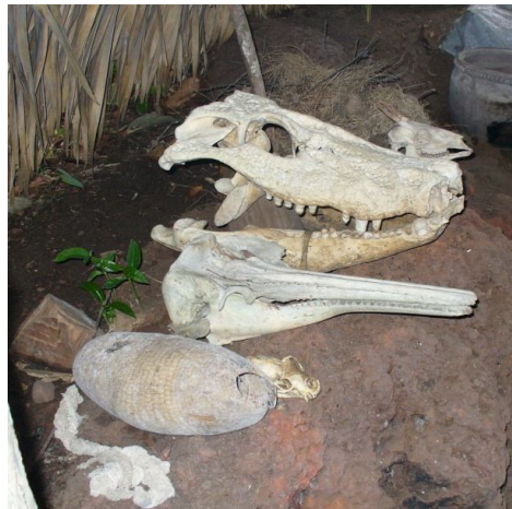
Ryc. 8. Obiekty kultu szamańskiego Sateré-Maué