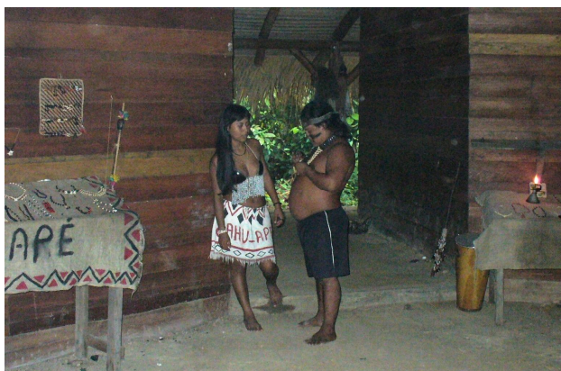
Ryc. 9. Dom zgromadzeń w wiosce Sateré-Maué, mężczyzna jest jej naczelnikiem Źródło: fotografia autora (2006)

Następnie turyści przechodzą bliżej centrum wsi, do domu zgromadzeń (ryc. 9), który podobnie jak obiekt szamanki jest jedynie wiatą, zadaszoną liśćmi palmowymi, z centralnym palem podtrzymującym tę okrągłą konstrukcję. Tam oczekuje już zespół folklorystyczny, złożony z młodych kobiet i dzieci (ryc. 10). Żadne z nich nie wygląda na swój wiek, dziewczyny ponoć są już dorosłe, a dzieci mają ok. 10–12 lat, ale są bardzo niskie i wyglądają na znacznie młodsze. Wszyscy odziani są w stosowne stroje, charakteryzowane raczej na wyobrażenie turysty – choć jak się wydaje – wszystkie elementy są autentyczne, tylko na co dzień raczej nieużywane. Jest to grupa muzyczno-taneczna, która wykonuje kilka tańców, związanych z różnorodnymi rytuałami plemiennymi, do taktu muzyki granej na prostych instrumentach bębnowych.