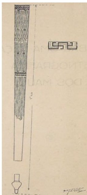
Ryc. 4. Porantim – magiczny symbol plemienia Sateré-Maué

Tradycyjnym zajęciem Sateré-Maué była uprawa roli, przede wszystkim takich roślin, jak guarana i maniok. Maniok jest podstawą diety, a nadwyżki są sprzedawane w najbliższych ośrodkach miejskich Maués, Barreirinha i Parintins. Wyrób mąki z manioku jest wyłączną domeną kobiet (Masters 2013). Wyłącznie na własne potrzeby uprawia się także dynie, wilec ziemniaczany (batat), biały i purpurowy pochrzyn (jams) oraz wiele owoców, w tym pomarańcze. Działalnością wspomagającą rolnictwo jest myślistwo i zbieractwo. Tą drogą dieta uzupełniana jest przez miód, orzech brazylijski, różne odmiany orzecha kokosowego, mrówki i inne owady (larwy). Zbierają też winorośl, różne trawy na własny użytek i na sprzedaż. Spożywa się też tapiokę w postaci swoistej zupy ( tacacá ), przygotowanej przez kobiety ( Sateré Mawé 2012).