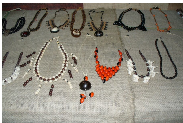
Ryc. 14. Wyroby sztuki ludowej plemienia Sateré-Maué oferowane turystom