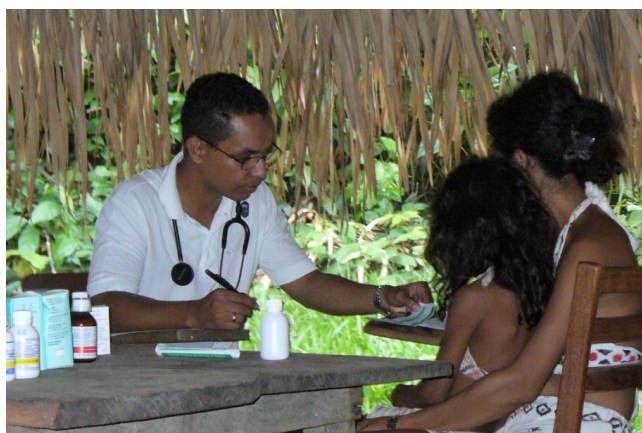
Ryc. 13. Wizyta lekarza w wiosce Sateré-Maué

i wszyscy Indianie żyjący w pobliżu obszarów cywilizowanych są objęci taką opieką co najmniej raz w miesiącu. Brazylia jest podzielona przez fundację Funasa na 34 obszary ochrony zdrowia Indian ( distritos sanitários especiais indígenas ). Omawiana wioska znajdowała się w dystrykcie nr 18 Manaus, a reszta terytoriów plemienia Sateré-Maué to dystrykty nr 24 Parintins i nr 29 Rio Tapajós ( Lei Arouca 2009, s. 31). Z drugiej strony badania prowadzone wśród Sateré-Maué pokazują, że aż 80% respondentów nie korzystało z opieki zdrowotnej, lecz ci, którzy skorzystali, w 97,5% czynili to właśnie poprzez Funasa, a jedynie 0,9% poprzez służbę zdrowia w gminach (Teixeira 2005, s. 61–62).