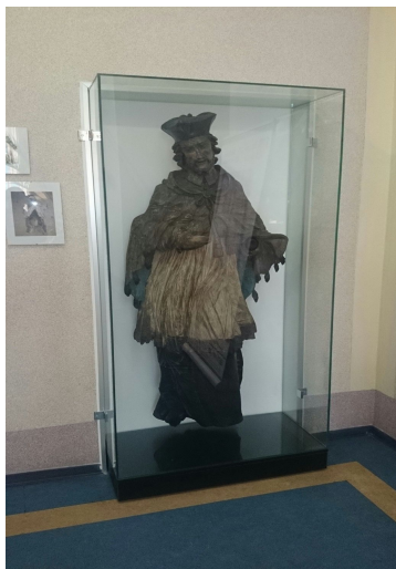
Ryc. 21. Rzeźba św. Jana Nepomucena w Urzędzie Miejskim w Stroniu Śląskim