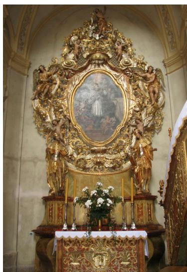
Ryc. 9. Ołtarz boczny w Wambierzycach