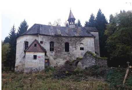
Ryc. 4. Kościół św. Jana Nepomucena na Janowej Górze