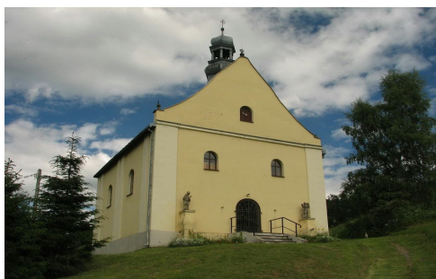
Ryc. 3. Kościół pw. św. Jana Nepomucena w Lutyni

Drugim elementem architektury sakralnej są małe obiekty sakralne, wśród których dominują przydrożne kapliczki murowane i drewniane, kaplice słupowe, rzeźby świętych, kolumny maryjne i krzyże przydrożne (Pukowiec, Pytel 2013). Niewielkie, murowane kaplice poświęcone św. Janowi Nepomucenowi są zlokalizowane w następujących miejscowościach: Krosnowice (ryc. 5), Jaskkowa Dolna (ryc. 6), Starków (ryc. 7) i Ludwikowice Kłodzkie. Ich stan jest zróżnicowany. Dla przykładu, w Krosnowicach na posesji nr 143, wizerunek świętego umieszczono w murowanej kapliczce, która jest przykryta dwuspadowym dachem, a figurę świętego ustawiono na niskim kamiennym postumencie w półkolistej wnęcie (ryc. 5). Figura i kapliczka pomalowane są kolejnymi warstwami farby. Dla porównania zaprezentowano kapliczkę z wnęką, w której znajduje się rzeźba świętego, zlokalizowaną przed posesją prywatną w miejscowości Starków. W miejscowości Niemojów znajduje się ruina kaplicy św. Jana Nepomucena.