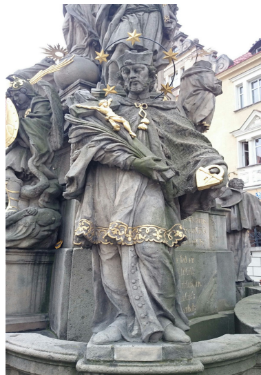
Ryc. 11. Pomnik Jana Nepomucena na rynku w Bystrzycy Kłodzkiej