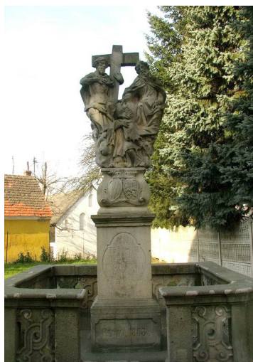
Ryc. 14. Pomnik Jana Nepomucena w Krosnowicach