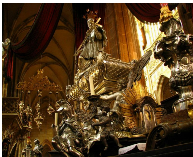
Ryc. 1. Nagrobek św. Jana Nepomucena w praskiej katedrze św. św. Wita, Waclawa i Wojciecha