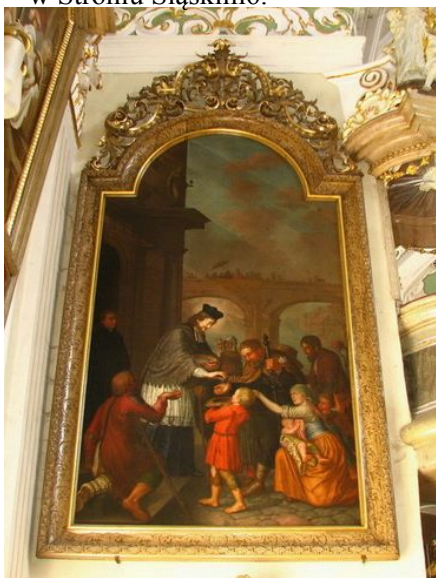
Ryc. 22. Obraz przedstawiający Jana Nepomucena w kościele pw. Narodzenia NMP w Łądku-Zdroju

w Stroniu Śląskim (ryc. 21). Rzeźba wcześniej znajdowała się w niszy pomnika przy cmentarzu i kościele pomocniczym pw. Zmartwychwstania Pańskiego w Stroniu Śląskim. Można przypuszczać, że była to wtórna lokalizacja rzeźby, gdyż jej wykonanie (drewniana rzeźba z polichromią na gruncie kredowo-klejowym) nie mogło być wystawione na czynniki zewnętrzne. Zły stan rzeźby spowodowany był działaniem czynników atmosferycznych i organizmów biologicznych. Zmiany wilgotności doprowadziły do kurczenia się i pęknięcia drewna. Obiekt nie był wolny również od uszkodzeń mechanicznych. Pozbawiony był prawego przedramienia i lewej dłoni oraz swojego atrybutu, widoczne były ubytki w ubiorze (biret, almucja, sułtana) i we włosach (Sadowska 2012). Po przeprowadzeniu w 2012 r. prac oczyszczenia, zabezpieczenia i odtworzenia brakujących elementów, przez konserwatora dzieł sztuki Cezarego Wandrychowskiego, została umieszczona w szklanej gablocie w holu Urzędu Miejskiego w Stroniu Śląskim 6 .