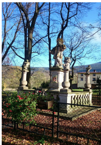
Ryc. 15. Pomnik Jana Nepomucena w Bolesławowie