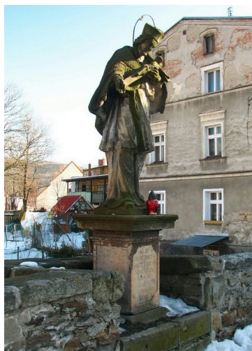
Ryc. 12. Pomnik Jana Nepomucena w Łądku-Zdroju przed renowacją

Wizerunki św. Jana Nepomucena w Krosnowicach można spotkać nieopodal kościoła św. Jakuba Apostoła. Jest to wizerunek męczennika dość rzadko spotykany, przedstawiający grupę Trójcy Świętej adorowaną przez św. Jana Nepomucena (ryc. 14). Rzeźba ta zmieniła swoją lokalizację po powodzi z 1997 r., podczas której została uszkodzona. Przeniesiono ją w inne miejsce i ustawiono na trójczłonowym cokole z inskrypcjami i z herbami. W dolnej części cokołu umieszczono datę wcześniejszej renowacji z 1883 r.