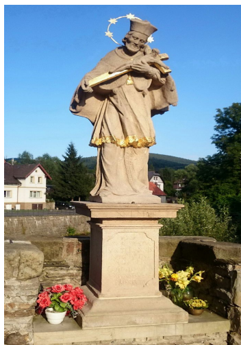
Ryc. 13. Pomnik Jana Nepomucena w Łądku-Zdroju po renowacji