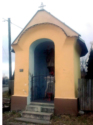
Ryc. 6. Kapliczka św. Jana Nepomucena w Jaskkowej Dolnej