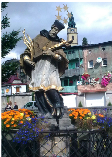
Ryc. 10. Pomnik Jana Nepomucena na placu Szpitalnym w Bystrzycy Kłodzkiej