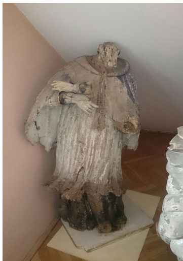
Ryc. 20. Rzeźba św. Jana Nepomucena w Muzeum Filumenistycznym w Bystrzycy Kłodzkiej