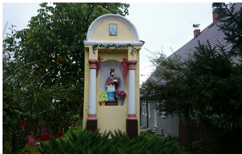
św. Jana Nepomucena w Starkowie

W wielu świątyniach uwagę zwracają boczne ołtarze upamiętniające św. Jana Nepomucena. Są to ołtarze w kościele Matki Boskiej Różańcowej w Kłodzku, kościele pw. Józefa Oblubieńca w Bolesławowie (ryc. 8), w bazylice Nawiedzenia NMP Wambierzycach (ryc. 9), kościele pw. św. Mikołaja w Nowej Rudzie.