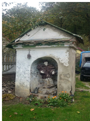
Ryc. 5. Kapliczka św. Jana Nepomucena w Krosnowicach