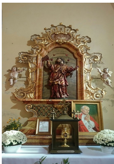
Ryc. 8. Ołtarz boczny w Bolesławowie

W wielu świątyniach uwagę zwracają boczne ołtarze upamiętniające św. Jana Nepomucena. Są to ołtarze w kościele Matki Boskiej Różańcowej w Kłodzku, kościele pw. Józefa Oblubieńca w Bolesławowie (ryc. 8), w bazylice Nawiedzenia NMP Wambierzycach (ryc. 9), kościele pw. św. Mikołaja w Nowej Rudzie.