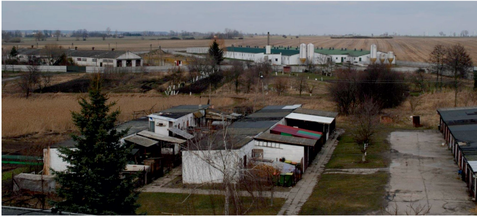
Fot. 2. Stara i nowa zabudowa gospodarcza na terenie popegeerowskim w Ligocie

Ostatni z zakładów włączonych do badania – PGR w Kobierzycku składał się z budynków gospodarczych, takich jak: stodoły, spichlerze, zbiornik małej retencji, dwie hydroformie i budynku bukaciarni. PGR w Kobierzycku to miejsce, które nie zmieniło sposobu zagospodarowania. Aktualnie na obszarze gospodarstwa prowadzi się hodowlę bydła oraz uprawę zbóż. Badania terenowe wykazały, że zasób budynków gospodarczych jest w bardzo złym stanie technicznym, wymagającym jak najszybszej modernizacji. Tereny, które w przeszłości należały do PGR-u w omawianej miejscowości, wcześniej zajmowane przez łąki i pastwiska, obecnie zajęte są przez przydomowe ogródki, w których mieszczą się szklarnie. Na potrzeby tego gospodarstwa stworzono 64 mieszkania. Obiekty te prezentują bardzo dobry stan estetyczno-architektoniczny. Jest to także przykład zaradności mieszkańców i wykorzystania przez nich funduszy unijnych (fot. 3).