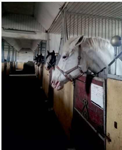
Fot. 1. Zaadaptowanie budynku obory popegeerowskiej na stadninę koni w Januszewicach