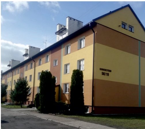
Fot. 3. Zmodernizowana zabudowa mieszkaniowa na osiedlu popegeerowskim w Kobierzycku

Ostatni z zakładów włączonych do badania – PGR w Kobierzycku składał się z budynków gospodarczych, takich jak: stodoły, spichlerze, zbiornik małej retencji, dwie hydroformie i budynku bukaciarni. PGR w Kobierzycku to miejsce, które nie zmieniło sposobu zagospodarowania. Aktualnie na obszarze gospodarstwa prowadzi się hodowlę bydła oraz uprawę zbóż. Badania terenowe wykazały, że zasób budynków gospodarczych jest w bardzo złym stanie technicznym, wymagającym jak najszybszej modernizacji. Tereny, które w przeszłości należały do PGR-u w omawianej miejscowości, wcześniej zajmowane przez łąki i pastwiska, obecnie zajęte są przez przydomowe ogródki, w których mieszczą się szklarnie. Na potrzeby tego gospodarstwa stworzono 64 mieszkania. Obiekty te prezentują bardzo dobry stan estetyczno-architektoniczny. Jest to także przykład zaradności mieszkańców i wykorzystania przez nich funduszy unijnych (fot. 3).