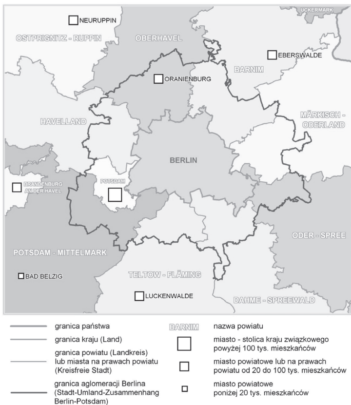
Ryc. 1. Aglomeracja Berlina (Obszar Powiazań Miasto–Otoczenie – SUZ) na tle struktury terytorialno-administracyjnej środkowej Brandenburgii