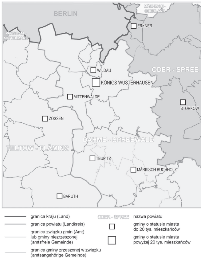
Ryc. 2b. Struktura terytorialno-administracyjna i układ miast w środkowej Brandenburgii (część południowo-wschodnia) w 2015 roku (stan w dniu 31 grudnia)