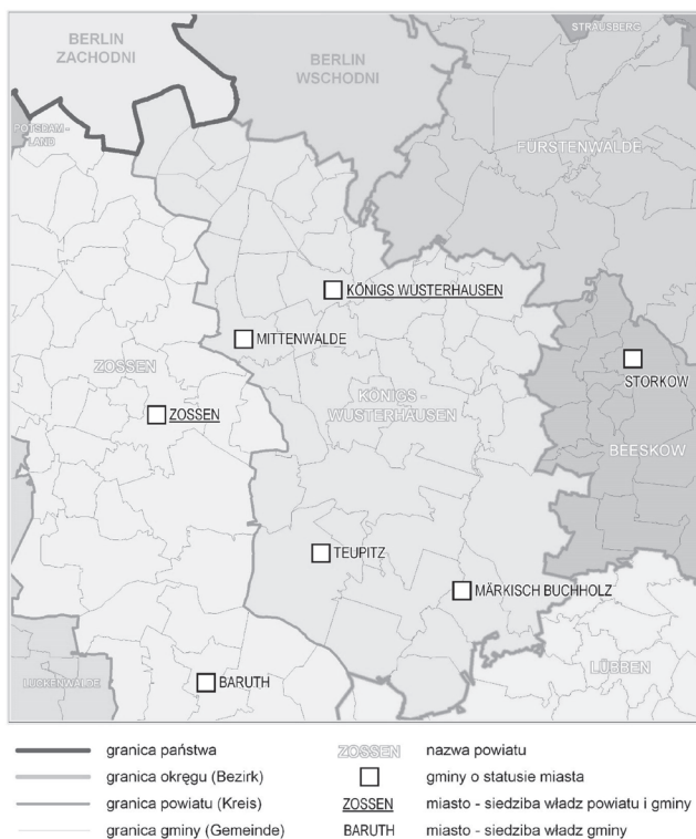
Ryc. 2a. Struktura terytorialno-administracyjna i układ miast w środkowej Brandenburgii (część południowo-wschodnia) w 1990 roku (stan w dniu 1 stycznia)

do miast okolicznych gmin wiejskich 12 . Skalę i charakter zmian struktur terytorialno-administracyjnych przeprowadzonych w Brandenburgii po 1990 roku ilustrują ryc. 2a i 2b, które odnoszą się do przykładu południowo-wschodniej części środkowej Brandenburgii, w tym istniejącego do 1993 roku powiatu Königs Wusterhausen. Powiat ten w ostatnim okresie funkcjonowania zajmował powierzchnię 726 km 2 i składał się z 48 gmin. W 1993 roku jego obszar stał się w ogólnym zarysie częścią nowego, znacznie większego powiatu Dahme-Spreewald (2274 km 2 ). W latach 1993–2015 liczba gmin w granicach byłego powiatu Königs Wusterhausen została zredukowana do 15.