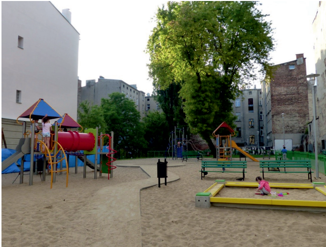
Fot. 4. Plac zabaw przy ul. Legionów 39 (2017)

ryzacji historii związanej z Janem Karskim i być miejscem spotkań mieszkańców w różnym wieku 13 . W 2015 roku powstał kieszonkowy plac zabaw. Była to pierwsza tego typu inwestycja. Plac został założony w luce między budynkami przy ul. Legionów 39 (fot. 4).