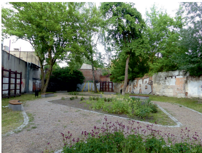
Fot. 2. Park kieszonkowy przy ul. 28 Pułku Strzelców Kaniowskich 34