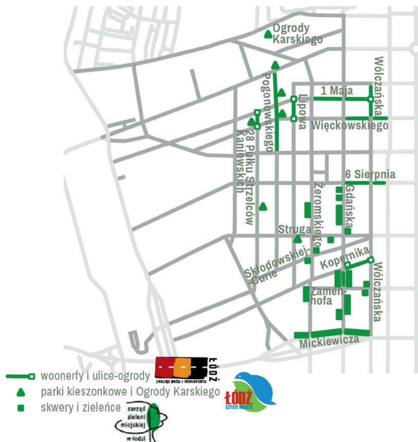
Ryc. 2. Rewitalizacja Staro Polesia

W miejscu asfaltowych jezdni i betonowych płyt chodnikowych zostanie wprowadzona zieleń. Nie zmieni się obecna funkcja ulic. Dalej będą stanowiły ciągi komunikacyjne, jednak zwężenie jezdni wymusi zmniejszenie prędkości jazdy, co wpłynie na wzrost bezpieczeństwa.