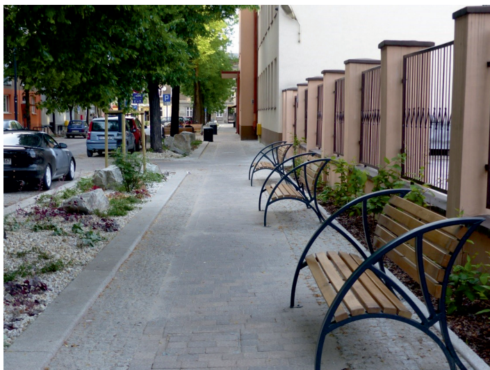
Fot. 9. Podwórzec miejski przy ul. Zacisze fot. M. Zdyb (2017)

Na ul. Lindleya zakończyły się już prace remontowe. W trakcie rewitalizacji została zdjęta nawierzchnia (fot. 10), aby ułożyć kostkę kamienną i betonową, z zachowaniem zabytkowej granitowej. Wprowadzono nowe nasadzenia. Z ciekawych rozwiązań, zgodnie z planem, drzewostan ma być oświetlony (Wasiak 2017).