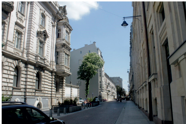
Fot. 6. Woonerf przy ul. 6 Sierpnia

ki, kosze, stojaki na rowery, wyznaczono miejsca parkingowe, także w przestrzeni między budynkami. Ułożono nową nawierzchnię bez typowego podziału ulicy na chodnik i jezdnię.