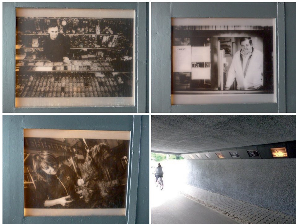
Fot. 5. Galeria Społeczna

zewnątrznych. Z roku na rok wzrasta zainteresowanie tego typu akcjami społecznymi. Ponadto organizowane są animacje podwórkowe – gry, zabawy łączące edukację i rekreację. Podejmowane są działania odsyłające i zachęcające do tzw. wysokiej kultury. Podjęto współpracę z Teatrem „Pinokio” w Łodzi. Stworzono „Galerię Społeczną” (fot. 5), znajdującą się w przejściu podziemnym pod wiaduktem kolejowym przy ul. Konstantynowskiej, na odcinku od al. Włókniarzy do parku na Zdrowiu. Przedstawia ona fotografie portretowe Staropolesian.