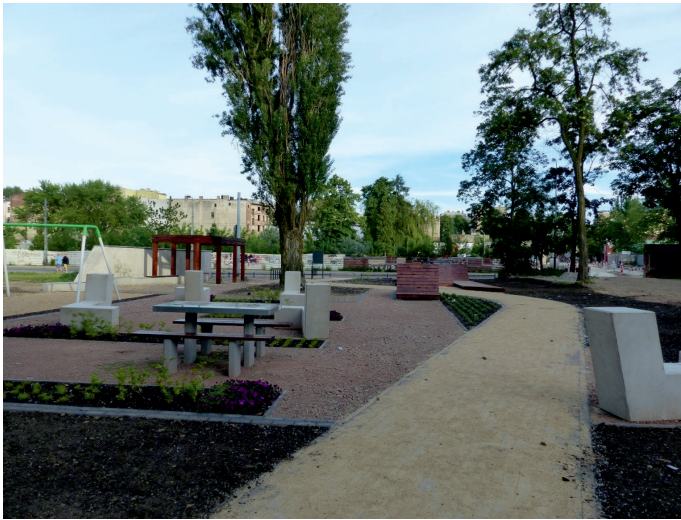
Fot. 1. Plac zabaw przy ul. Pogonowskiego 10/12

w ciągu zabudowy, tworzone są tzw. parki kieszonkowe. Nazwę swą zaczerpnęły od luk, swego rodzaju kieszonek w zabudowanej przestrzeni miejskiej. Zgodnie z inicjatywą urzędników, w 2016 roku na Starym Polesiu ma powstać sześć takich parków w ramach realizacji projektu „Zielone Polesie”. Wśród obszarów wytypowanych do stworzenia miejsc do celów rekreacyjnych wyróżniono przestrzenie przy następujących ulicach: Pogonowskiego 10/12 (fot. 1), 28 Pułku Strzelców Kaniowskich 34 (fot. 2), narożnik 28 Pułku Strzelców Kaniowskich i Więckowskiego, Pogonowskiego i Więckowskiego, Struga i Lipowa (fot. 3).