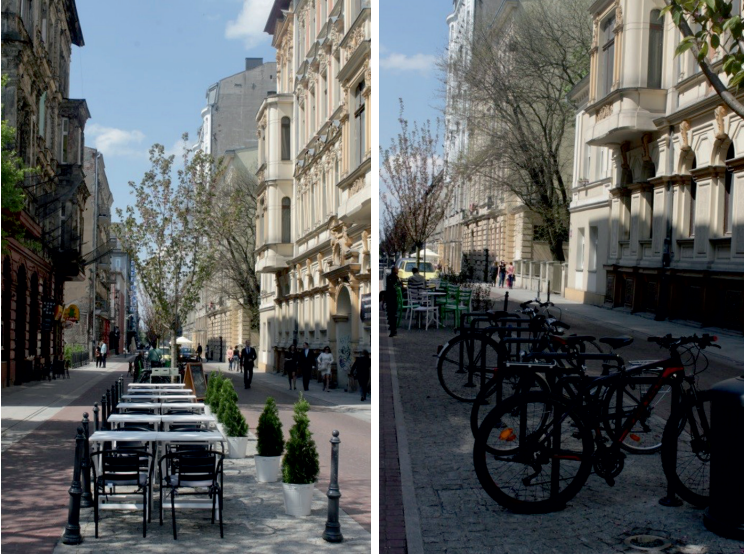
Fot. 7. Woonerf przy ul. Traugutta