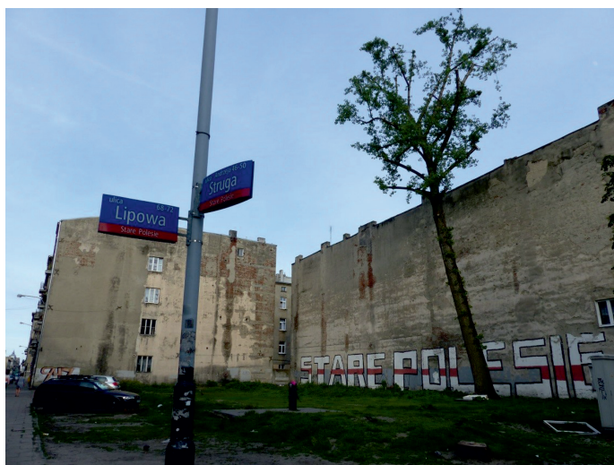
Fot. 3. Przestrzeń do zagospodarowania na park kieszonkowy przy skrzyżowaniu ulic Lipowej i A. Struga