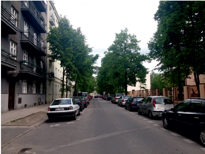
Fot. 8. Ulica Zacisze – stan na rok 2016

Woonerf przy ul. Zacisze został oddany po weekendzie majowym. Fotografie ukazują stan przed i po rewitalizacji (fot. 8 i 9). Zmieniono nawierzchnię, ustawiono ławki, stary drzewostan uzupełniono nowymi nasadzeniami niższych roślin. Wszystko odbyło się z zachowaniem miejsc parkingowych.