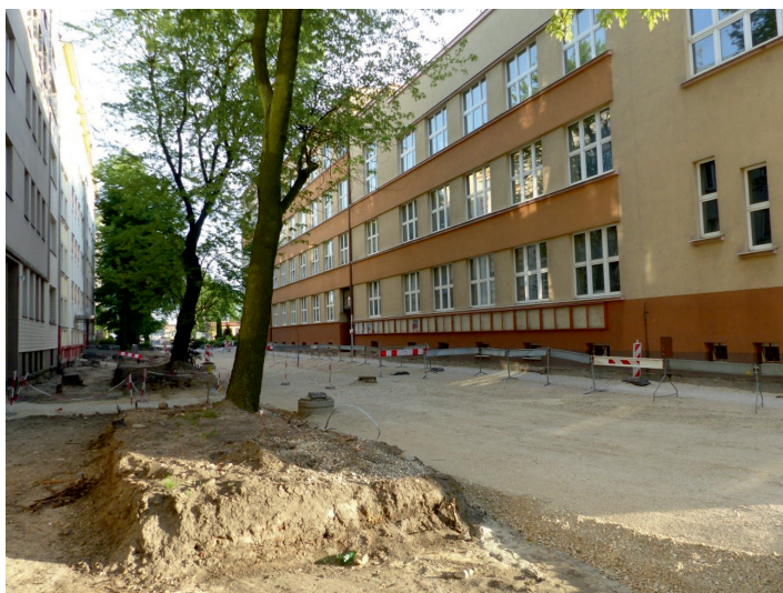
Fot. 10. Budowa przy ul. Lindleya

Na ul. Lindleya zakończyły się już prace remontowe. W trakcie rewitalizacji została zdjęta nawierzchnia (fot. 10), aby ułożyć kostkę kamienną i betonową, z zachowaniem zabytkowej granitowej. Wprowadzono nowe nasadzenia. Z ciekawych rozwiązań, zgodnie z planem, drzewostan ma być oświetlony (Wasiak 2017).