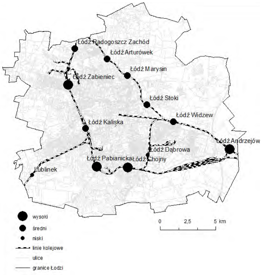
Rys. 2. Udział terenów zabudowanych w ekwidystancji dojazdu 1 000 m do stacji ŁKA