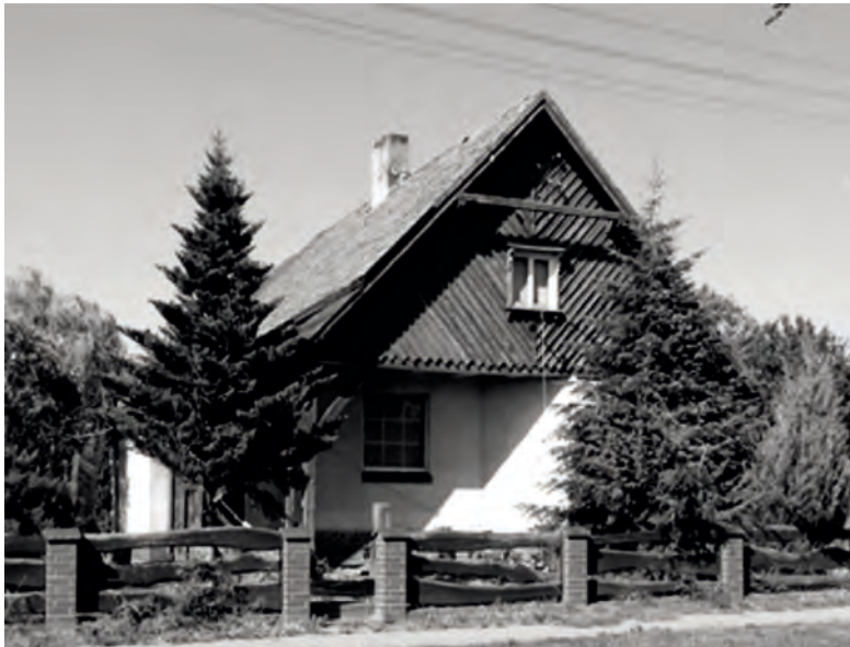
Fot. 2. Zabytkowy dom w Gołęczewie, ul. Dworcowa 36