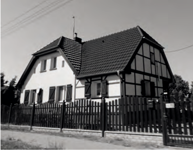
Fot. 1. Zabytkowy dom w Gołęczewie, ul. Dworcowa 30